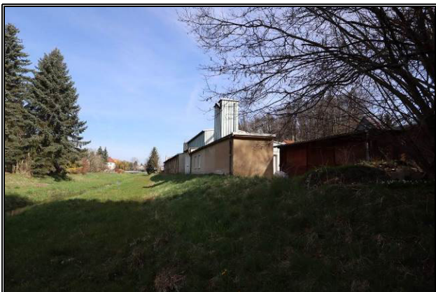
Teil der Flutwiese - Blick in nordwestliche Richtung