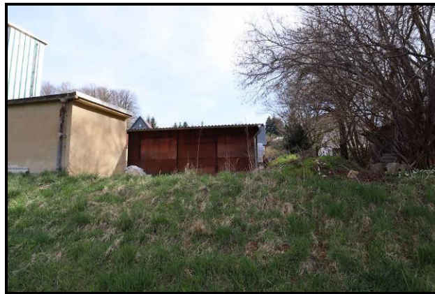
Süd-West-Ansicht des Gebäudes 5 und tw. Gebäude 4