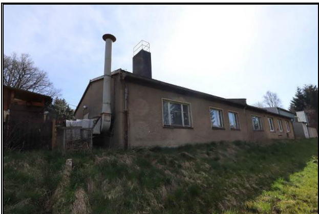
Nord-West-Ansicht des Gebäudes 3 und 2