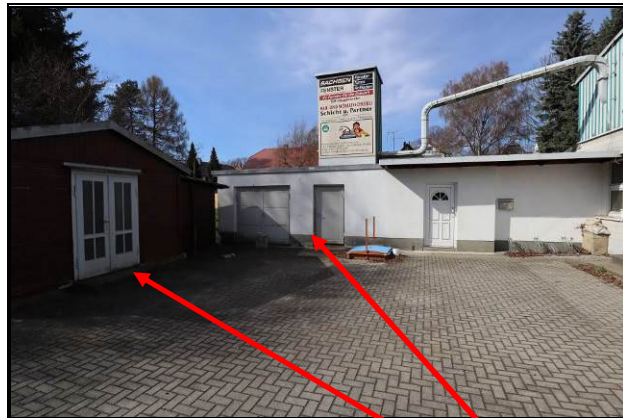
Nord-Ost-Ansicht von Gebäude 5 und 4