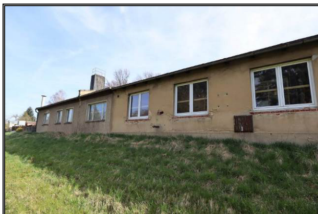
Süd-West-Ansicht von Gebäude 2 und 3