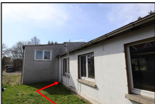
Detailansicht Anbau (Bereich Überbau) von Gebäude 2 an Gebäude 1