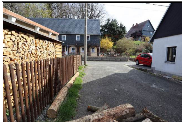
West-Ansicht der Grundstückszufahrt zum Teilgrundstück 1