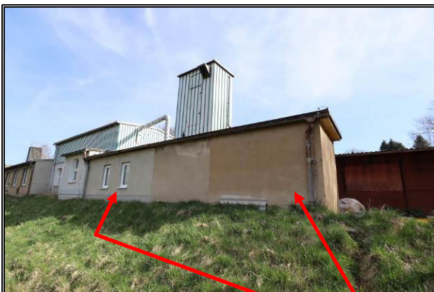
Süd-West-Ansicht des Gebäudes 1.2 und 4