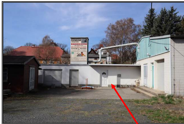
Nord-Ost-Ansicht des Gebäudes 1.2