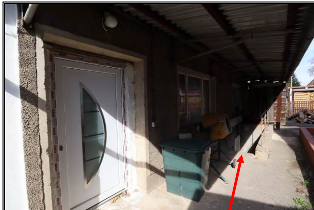
Eingangsbereich Gebäude 3; Kelleraußentreppe