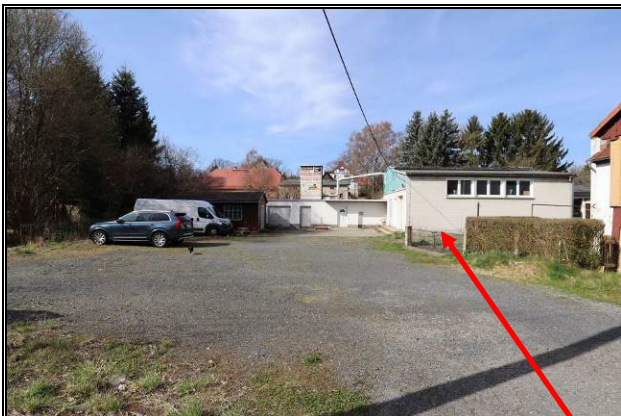
Grundstückszufahrt (Teil der Dorfstraße) zur ehem. Tischlerei