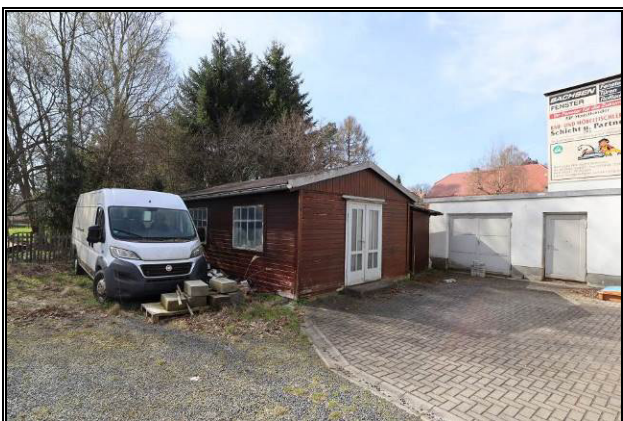
Nord-Ansicht des Gebäudes 5