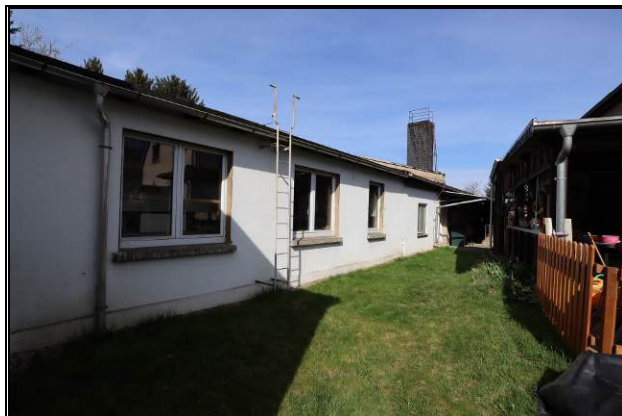
Süd-Ost-Ansicht des Gebäudes 2