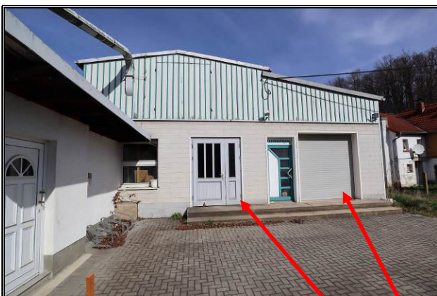
Giebelansicht der ehem. Tischlerei; Gebäude 1 und 1.1