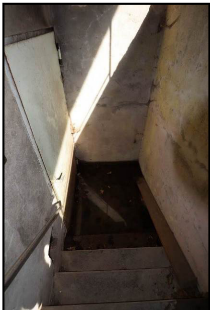
Detailansicht Kelleraußentreppe Gebäude 3 mit erkennbarem Wasserpegel