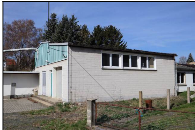
Detailansicht der ehem. Tischlerei (Gebäude 1 und 1.1 – Teilgrundstück 2)