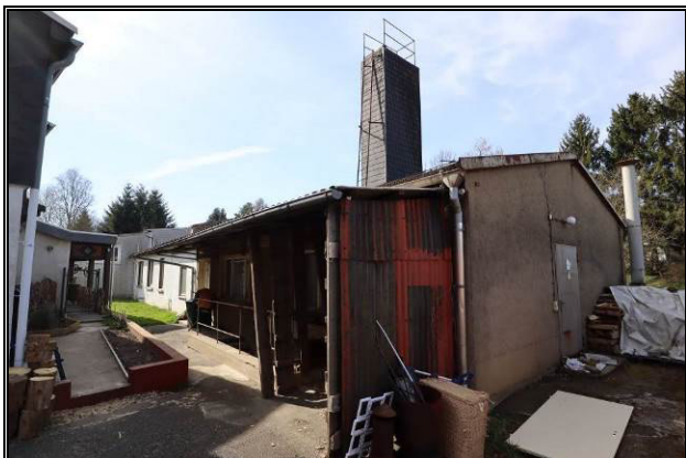
Nord-Ansicht des Gebäudes 3