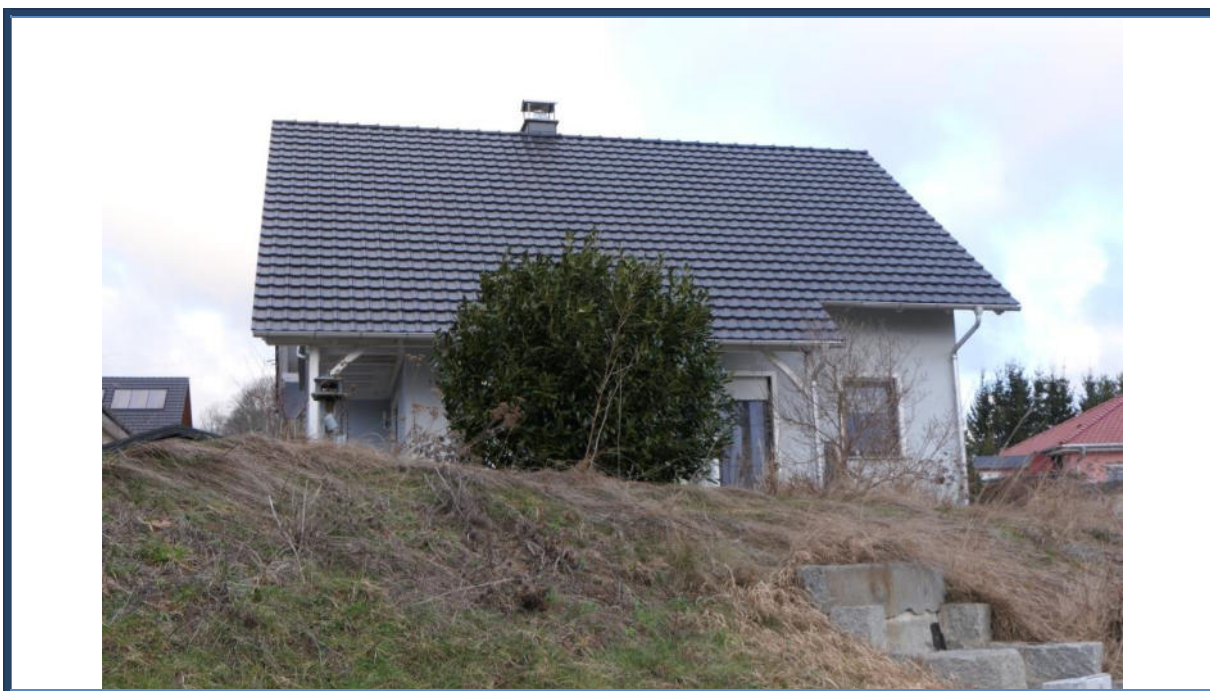
Abbildung 3: Straßenansicht (Süd-Ansicht); verwilderte Außenanlagen; umliegende Bebauung