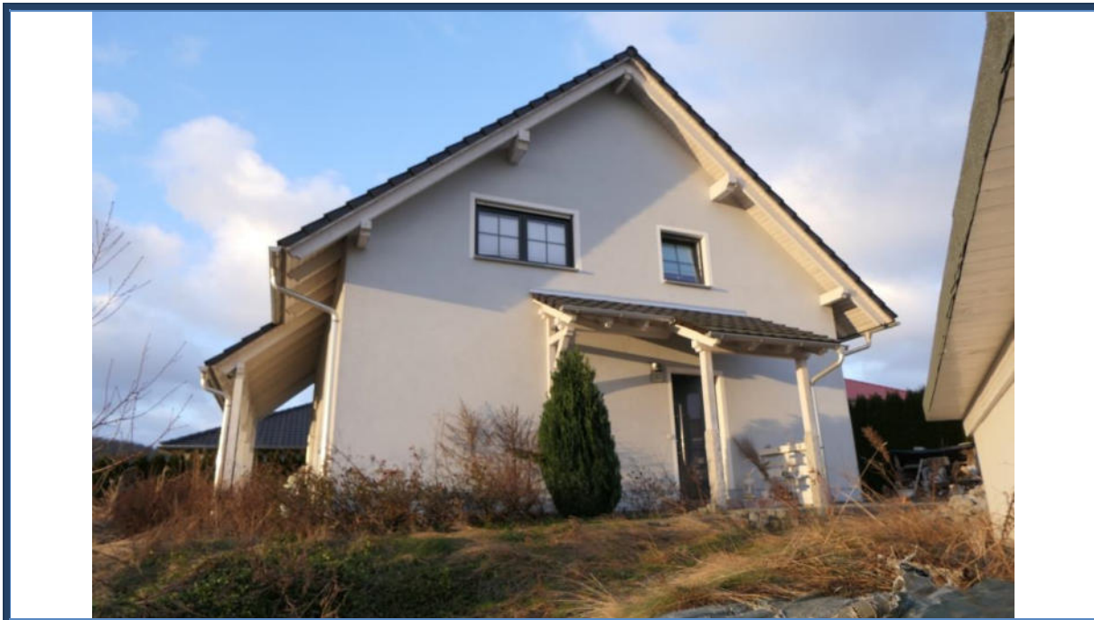
Abbildung 5: Straßenansicht (Nord-Ost-Ansicht); Hauseingangsbereich; verwilderte Außenanlagen (tlw. Fertigstellungsbedarf)