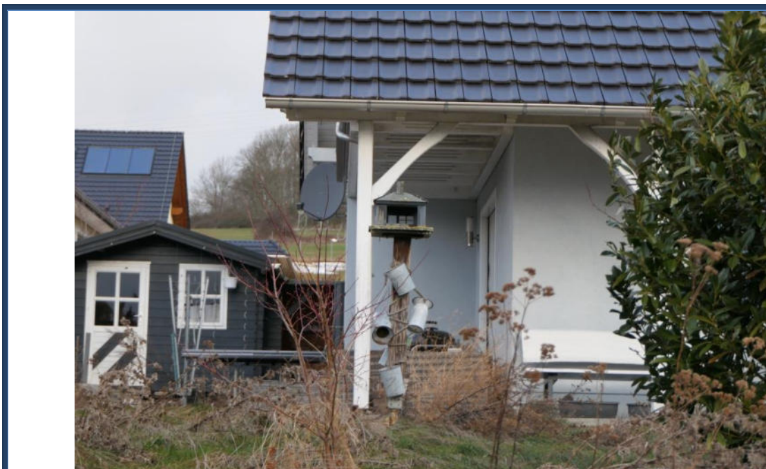
Abbildung 10: Detailansicht; links ein handelsübliches Gartenhaus; verwilderte Außenanlagen; umliegende Bebauung