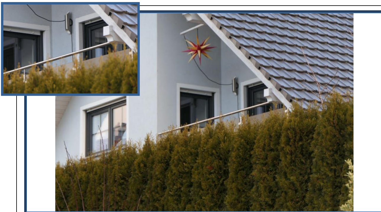
Abbildung 7: Detailansichten