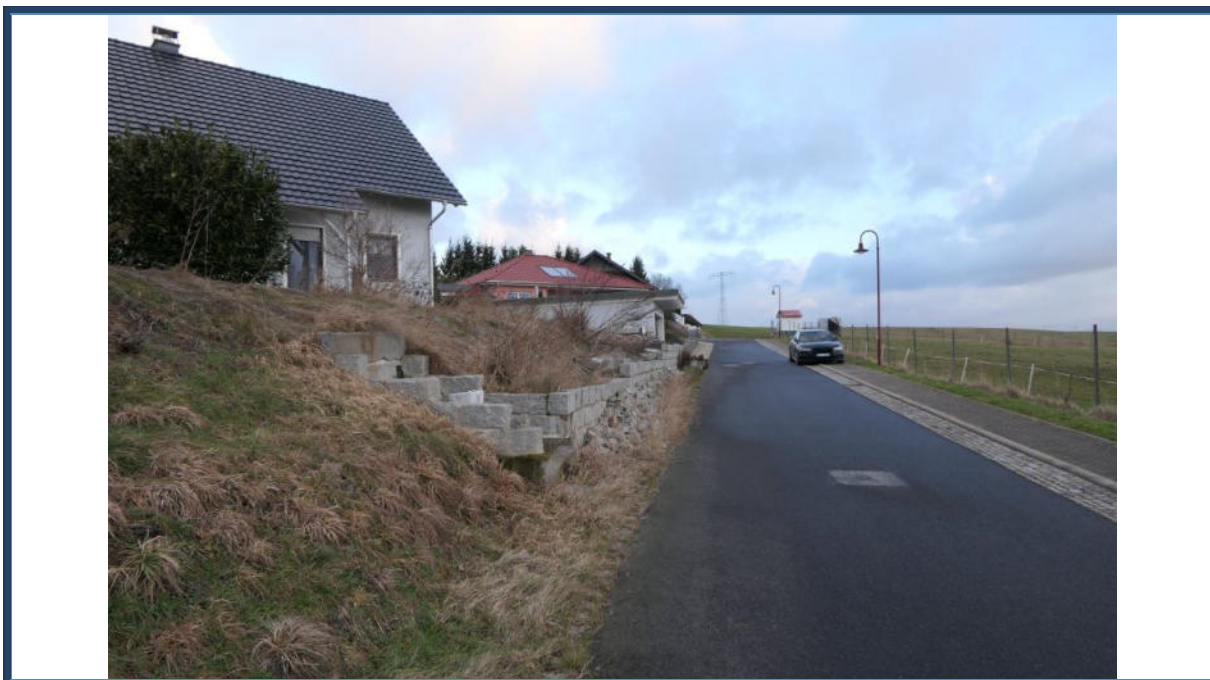
Abbildung 16: Blick in nördliche Richtung in die Rosenstraße; links das Bewertungsobjekt; umliegende Bebauung und Nutzung