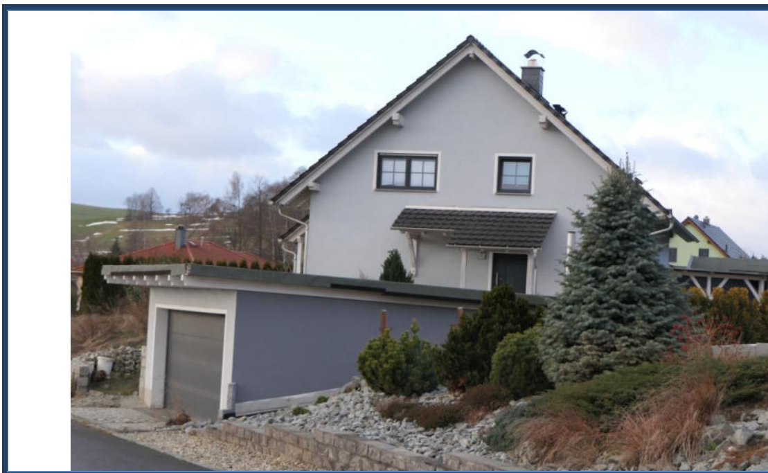
Abbildung 18: Blick in südliche Richtung zu Bewertungsobjekt von der Rosenstraße; umliegende Bebauung