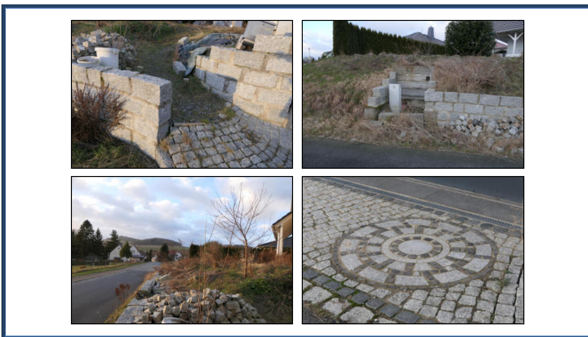
Abbildung 13: Detailansichten; Fertigstellungsbedarf hinsichtlich Pflasterarbeiten und Grundstückseinfriedung sowie der Stützmauer