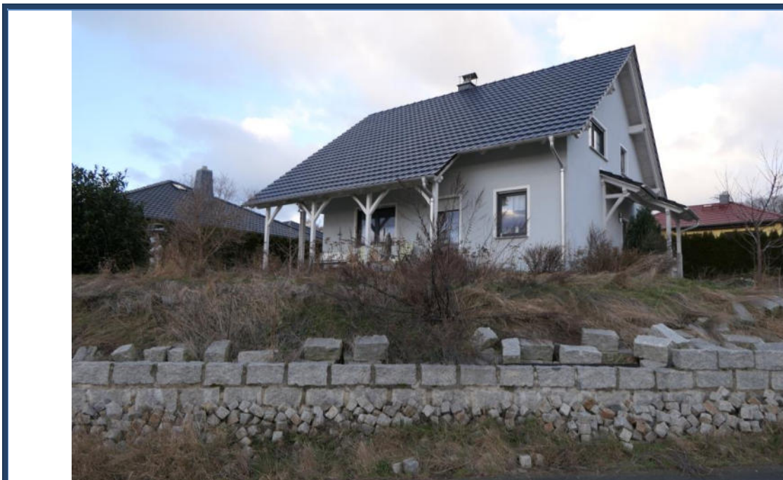
Abbildung 1: Straßenansicht (Süd-Ost-Ansicht); verwilderte Außenanlagen (tlw. Fertigstellungsbedarf); umliegende Bebauung