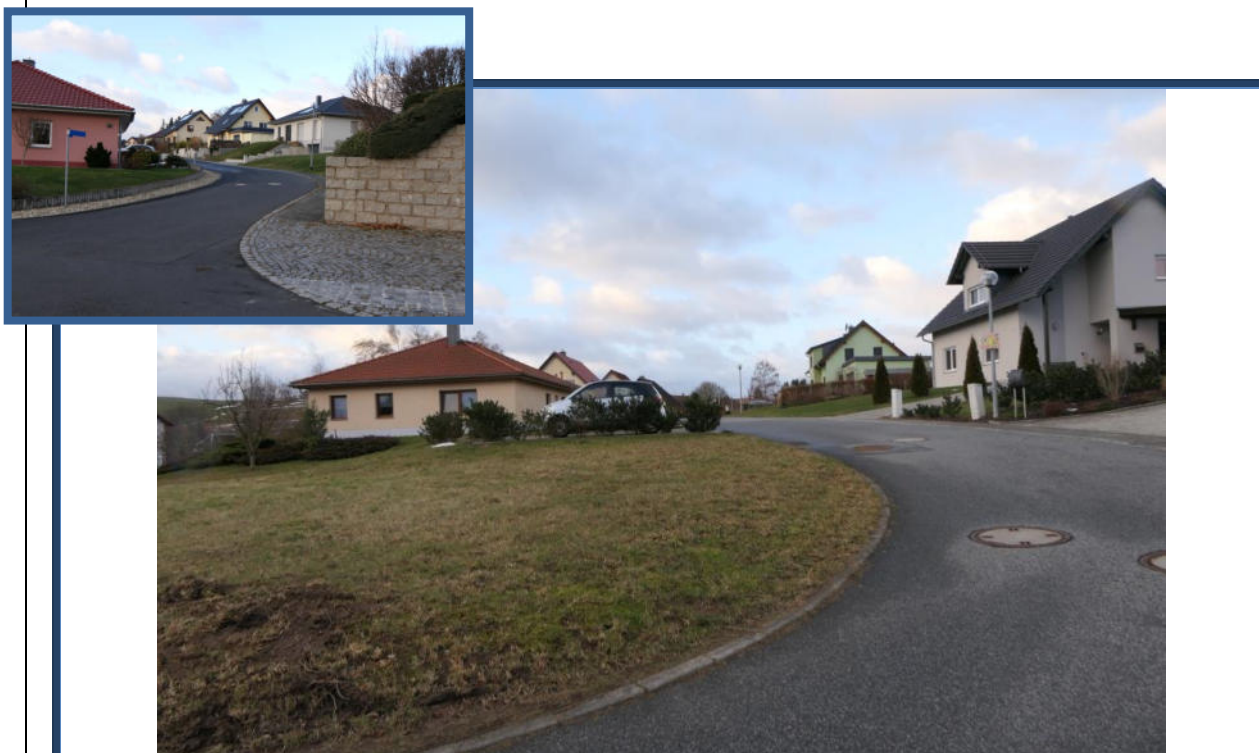
Abbildung 20: Umliegende Bebauung in der Straße "An der Schäferei"