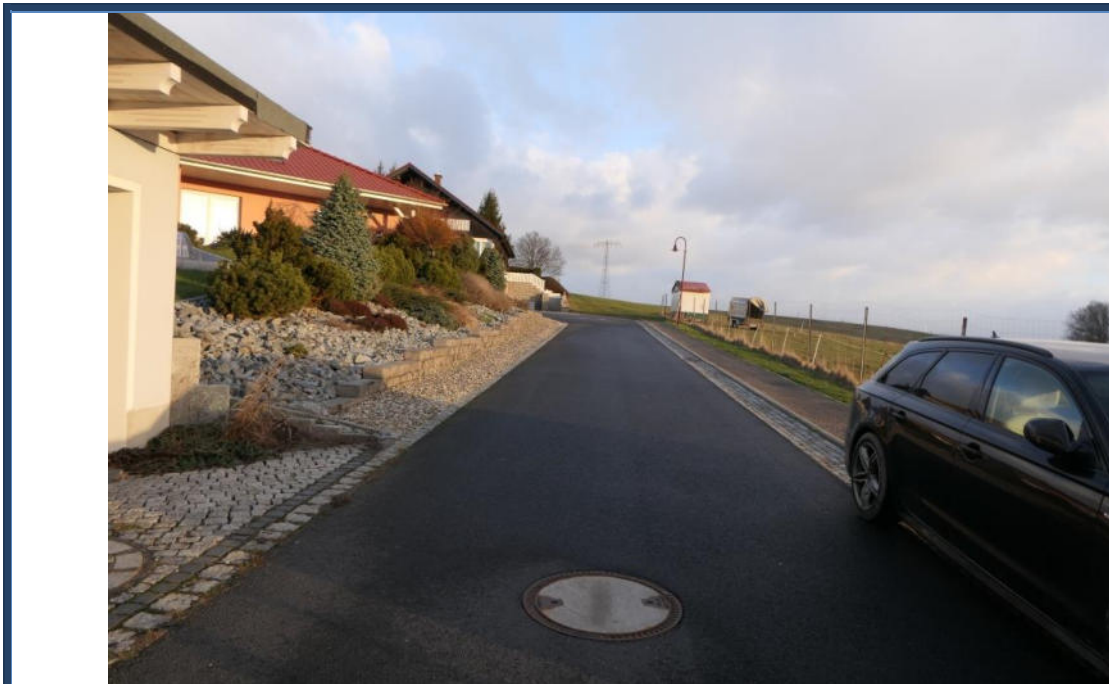
Abbildung 17: Blick in nördliche Richtung in die Rosenstraße; links das Bewertungsobjekt; umliegende Bebauung und Nutzung