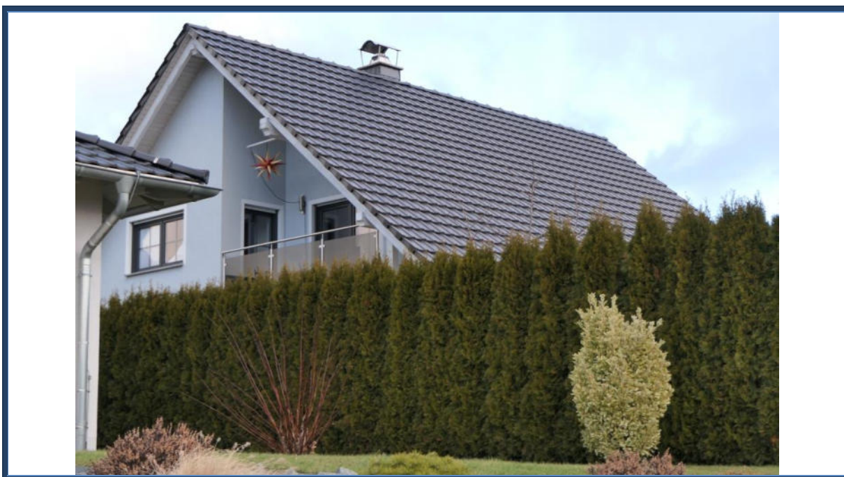
Abbildung 4: Straßenansicht (Süd-West-Ansicht); Außenanlagen; umliegende Bebauung