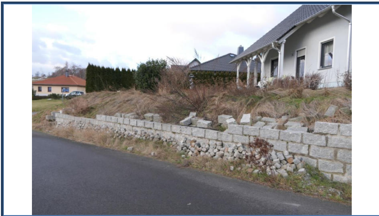
Abbildung 15: Fertigstellungsbedarf hinsichtlich Pflasterarbeiten und Grundstückseinfriedung sowie der Stützmauer im südlichen Grundstücksbereich