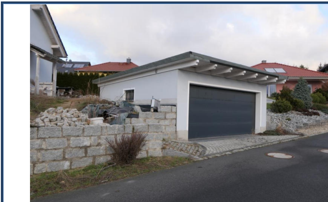
Abbildung 11: Doppelgarage; Außenanlagen (tlw. Fertigstellungsbedarf); umliegende Bebauung