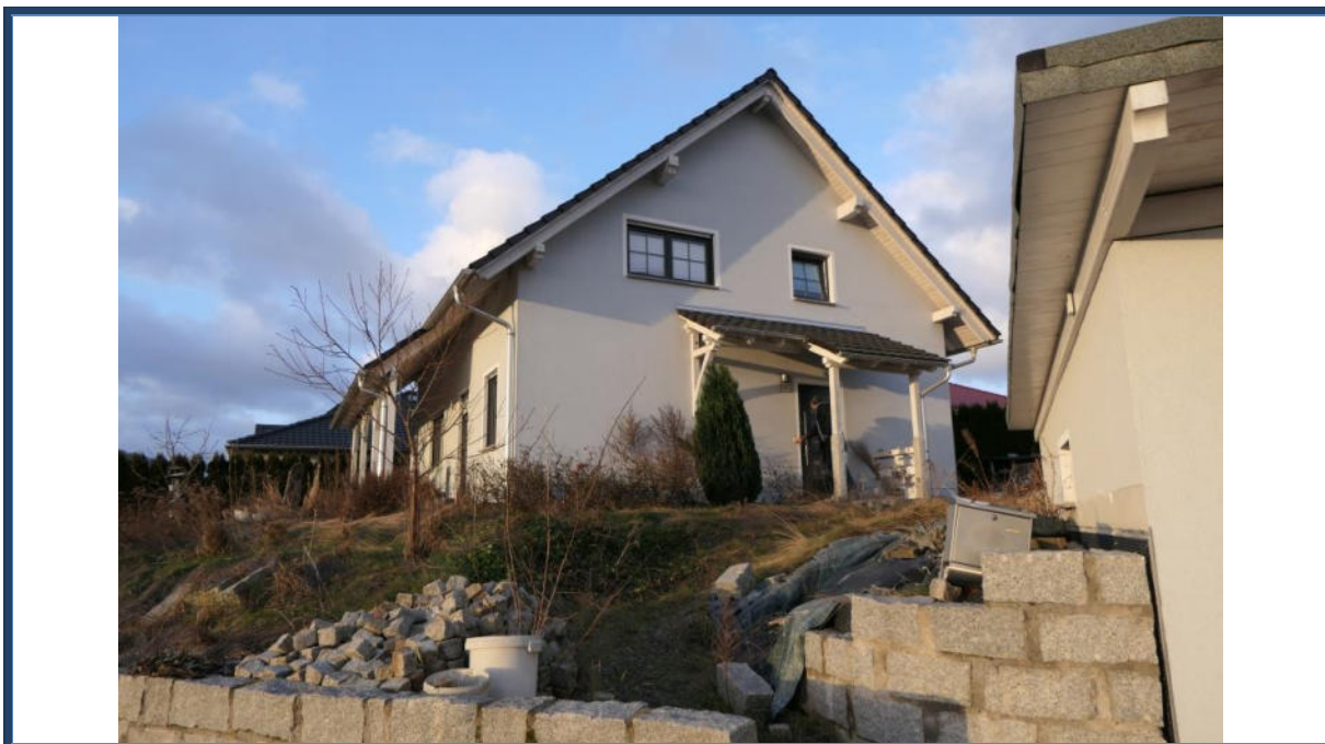
Abbildung 14: Fertigstellungsbedarf hinsichtlich Pflasterarbeiten und Grundstückseinfriedung sowie der Stützmauer im nördlichen Grundstücksbereich