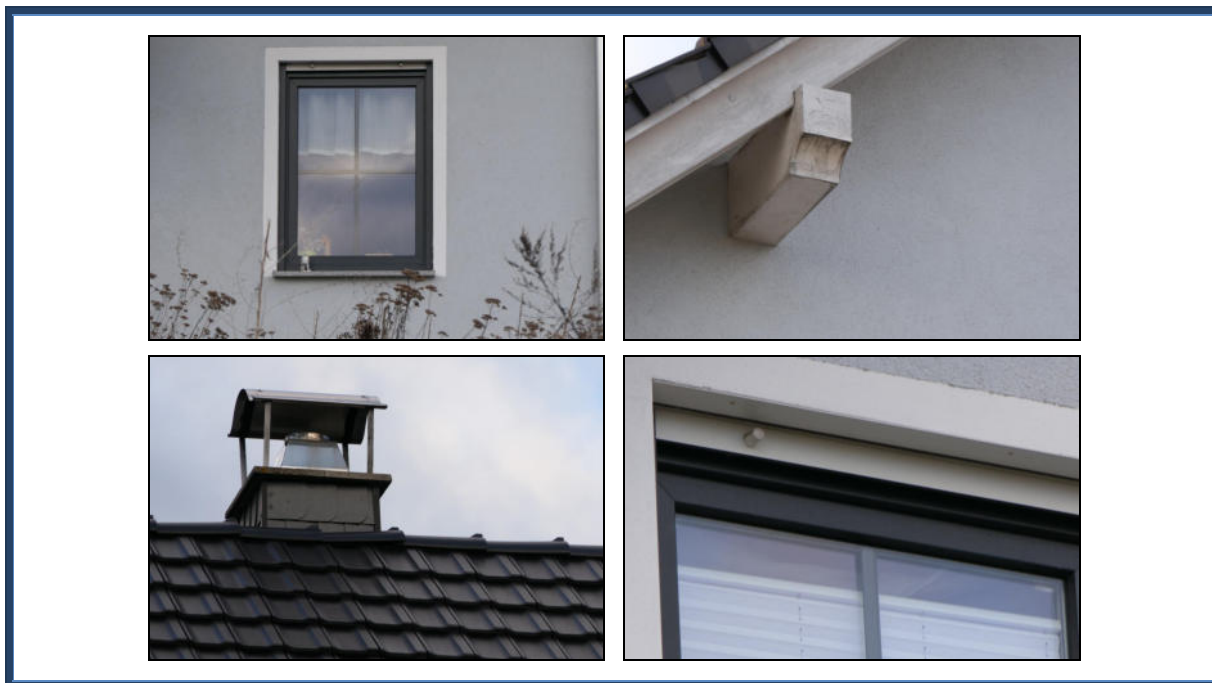
Abbildung 8: Detailansichten