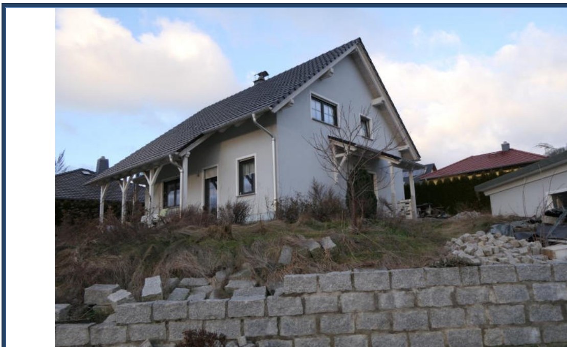
Abbildung 2: Straßenansicht (Süd-Ost-Ansicht); verwilderte Außenanlagen (tlw. Fertigstellungsbedarf); umliegende Bebauung