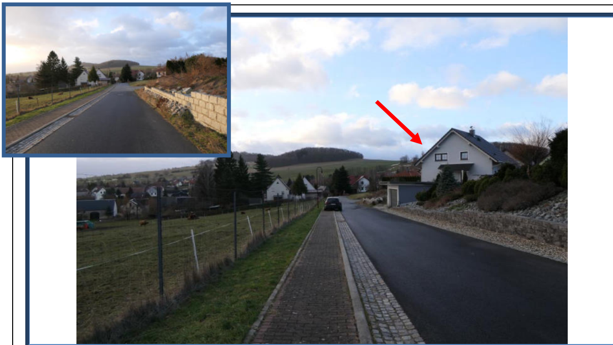
Abbildung 19: Blick in südliche Richtung in die Rosenstraße; rechts das Bewertungsobjekt; umliegende Bebauung und Nutzung