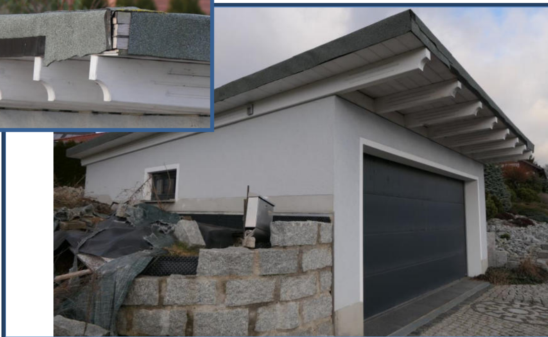
Abbildung 12: Doppelgarage; Außenanlagen (tlw. Fertigstellungsbedarf); reparaturbedürftige Dacheindeckung