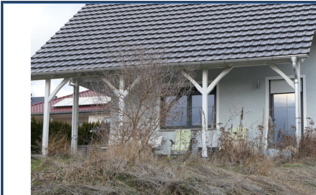
Abbildung 9: Detailansicht; verwilderte Außenanlagen