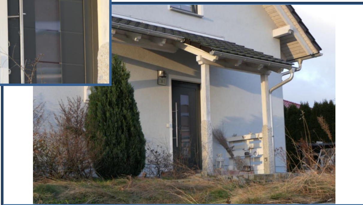
Abbildung 6: Hauseingangsbereich; verwilderte Außenanlagen (Fertigstellungsbedarf hinsichtlich der Zuwegung zum Gebäude)