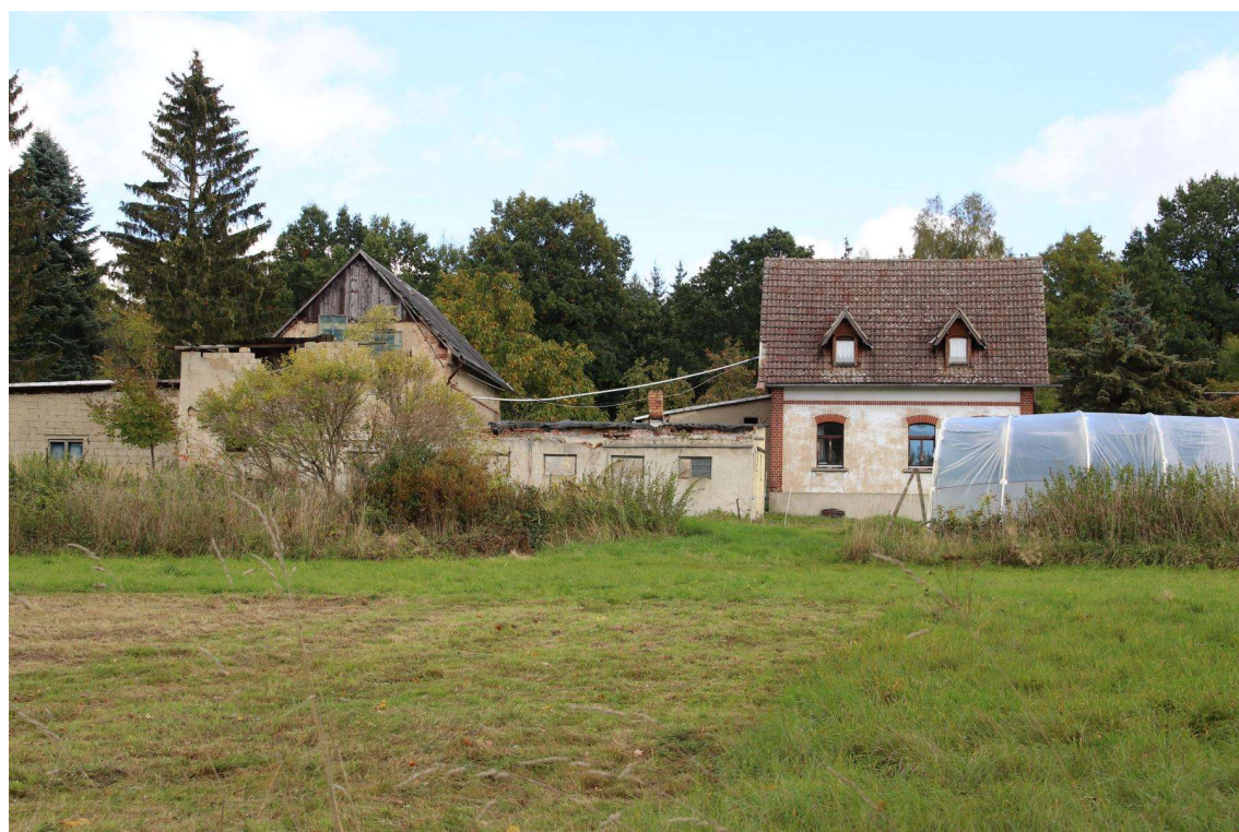
Blick von der westlichen Flurstücksgrenze in östliche Richtung auf die zu bewertende Hofstelle in Spitzkunnersdorfer Straße 27 in Großschönau (Flurstück 1179/1).

Es handelt sich im vorliegenden Fall um das in Großschönau gelegene Grundstück Spitzkunnersdorfer Straße 27 . Das Grundstück setzt sich aus den Flurstücken 1179/1 und 1180 zusammen und ist insgesamt 39.970 m 2 groß und wurde ursprünglich als Gärtnerei genutzt.