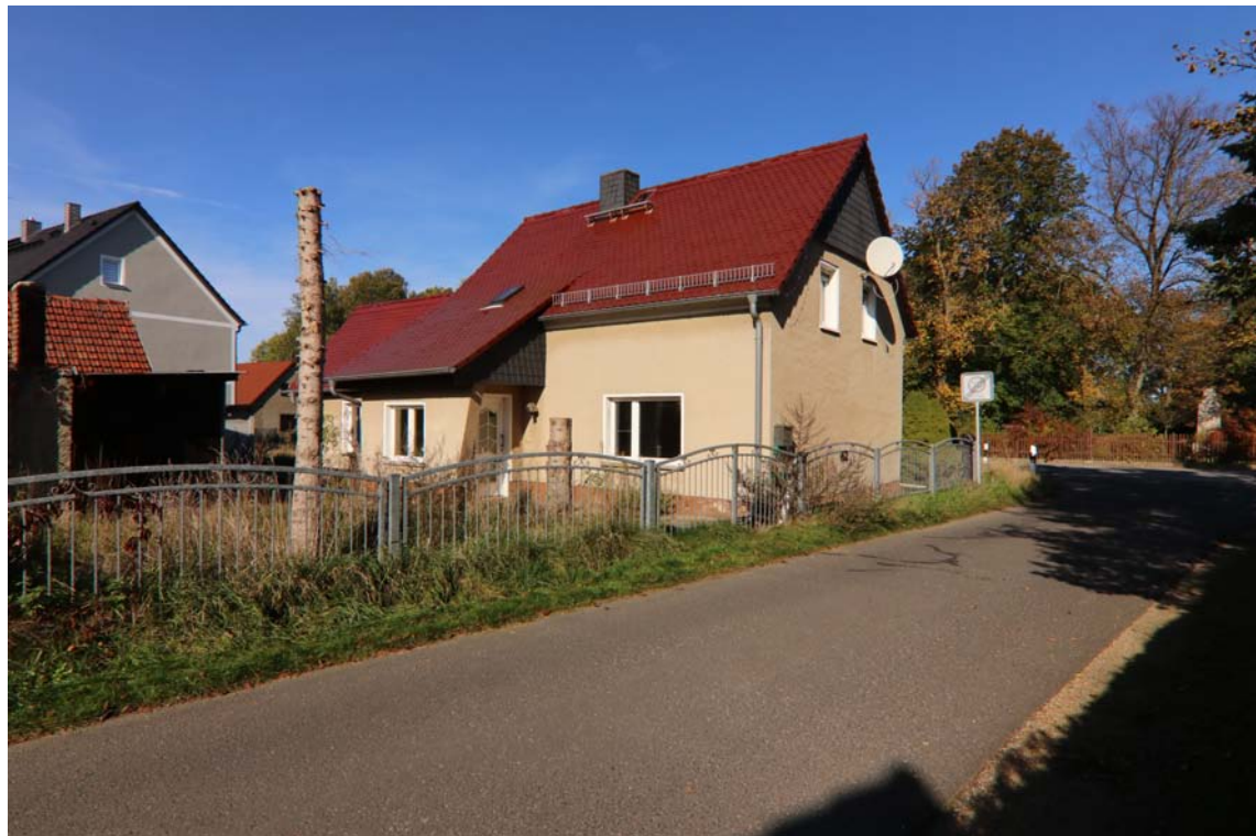
Blick in nördliche Richtung auf die Südseite des Flurstücks 179 und das Wohngebäude Görlitzer Landstraße 62 in Rothenburg/O.L. OT Nieder-Neundorf.

Es handelt sich im vorliegenden Fall um das in Rothenburg/O.L. OT Nieder-Neundorf gelegene Grundstück Görlitzer Landstraße 62. Das Grundstück ist insgesamt 557 m 2 groß und liegt auf den Flurstücken 178 und 179. Es ist mit einem Wohnhaus und zwei Nebengebäuden bebaut.