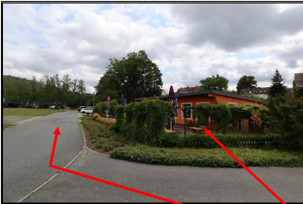
Zuwegung über vorgelagertes Flurstück 579/25 (öffentl. gewidmet); Bewertungsobjekt