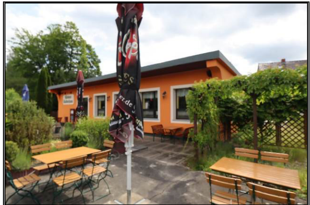
Süd-West-Ansicht des Bewertungsobjekts