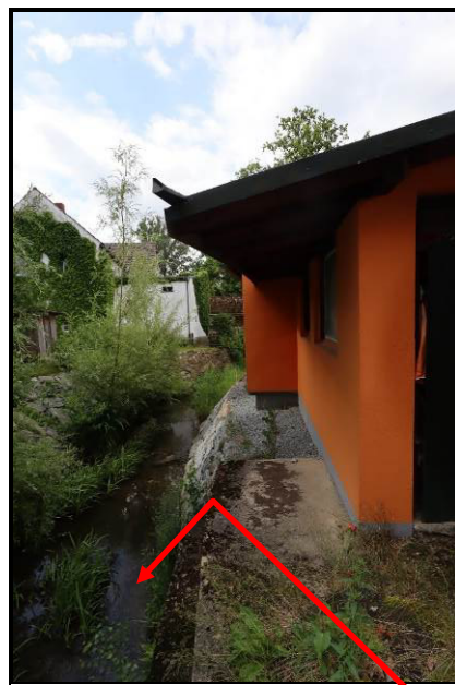
Detailansicht Grundstücksgrenze; Elzebach