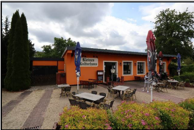
Nord-West-Ansicht des Bewertungsobjekts