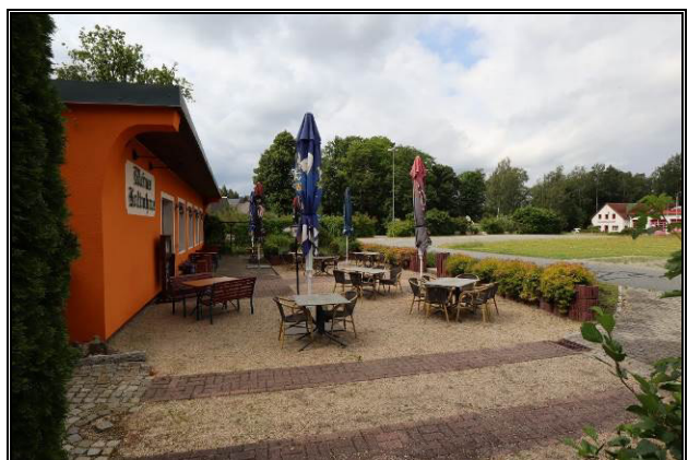
Nord-Ansicht des Terrassenbereichs