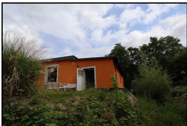
Süd-Ansicht des Bewertungsobjekts