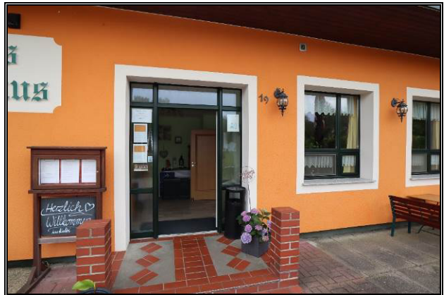
Detailansicht des Eingangsbereichs