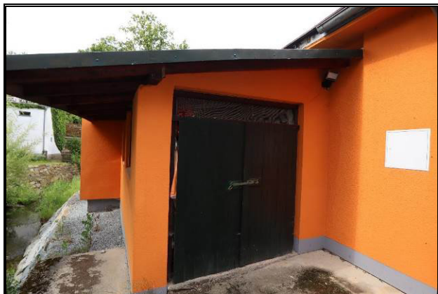
rückseitiger Anbau (Nord-Ost-Ansicht)