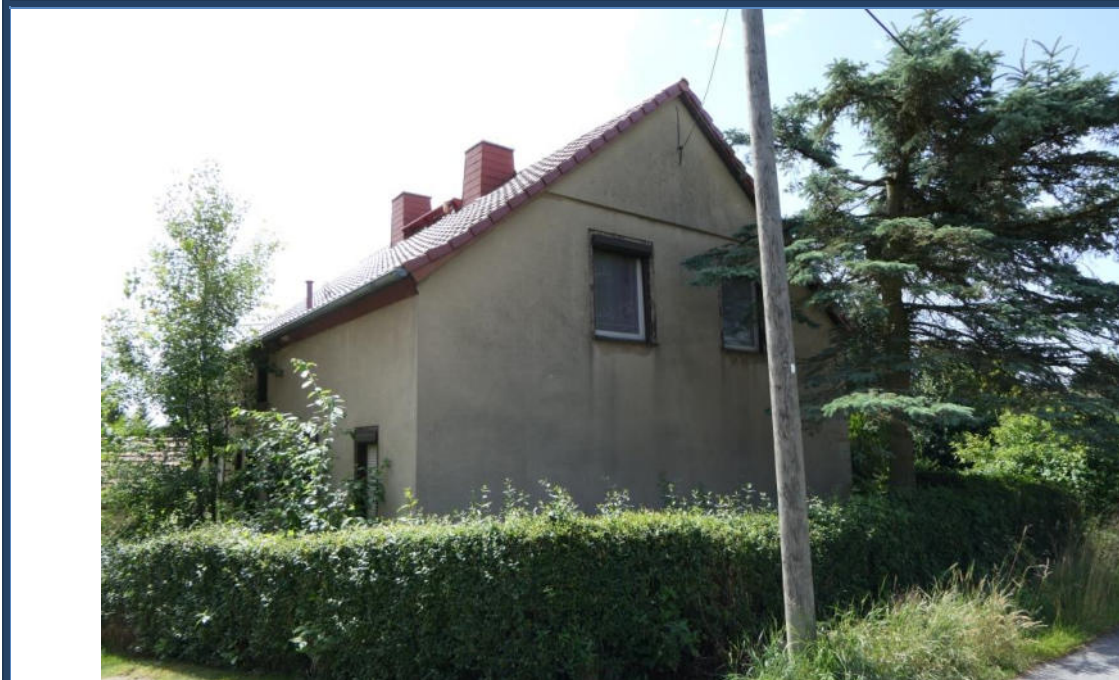
Abbildung 1: Nord-West-Ansicht; Außenanlagen