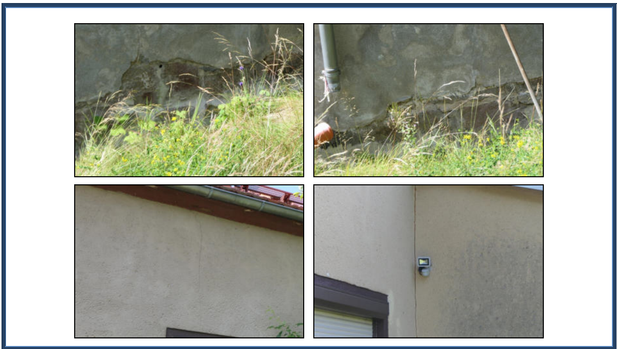
Abbildung 9: Detailansichten: Beschädigungen an der Fassade; Schäden/Fertigstellungsbedarf im Sockelbereich; tlw. Rissbildung; tlw. verschmutzte Fassadenbekleidung