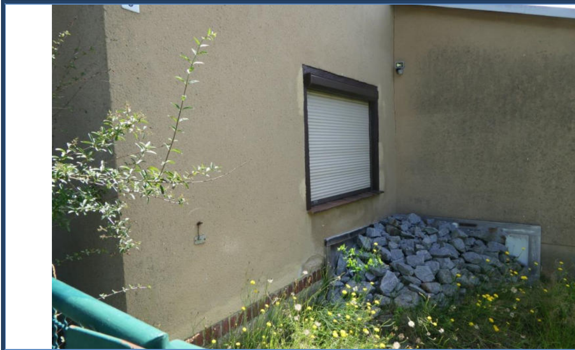
Abbildung 5: Detailansicht