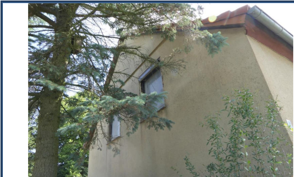
Abbildung 6: Detailansicht