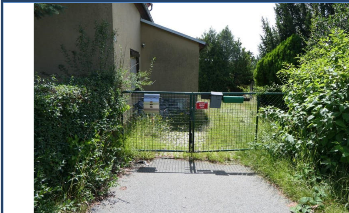
Abbildung 17: Blick zu Bewertungsobjekt von der Kleindehsaer Straße; Eingangs-/Einfahrtsbereich; verwilderte Außenanlagen