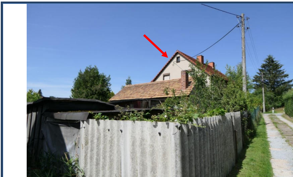
Abbildung 14: Blick entlang der nördlichen Grundstücksgrenze