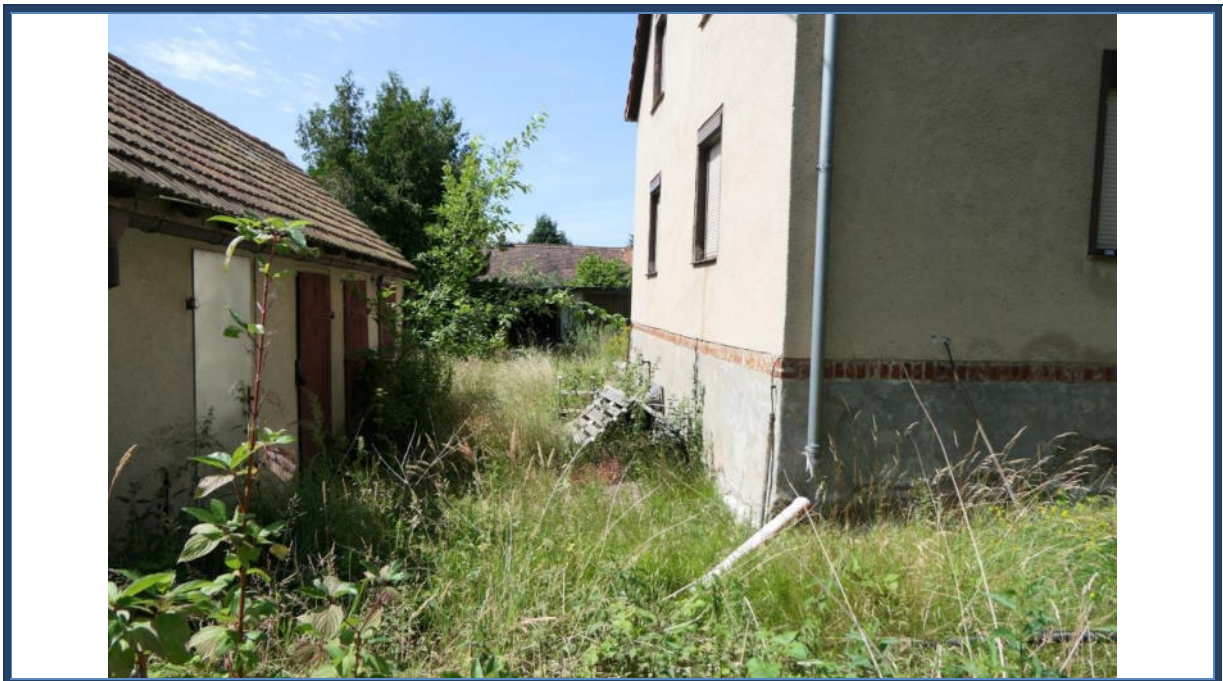
Abbildung 10: Rechts das Wohngebäude; links das einfache Nebengebäude; mittig im Hintergrund das Garagengebäude; verwilderte Außenanlagen