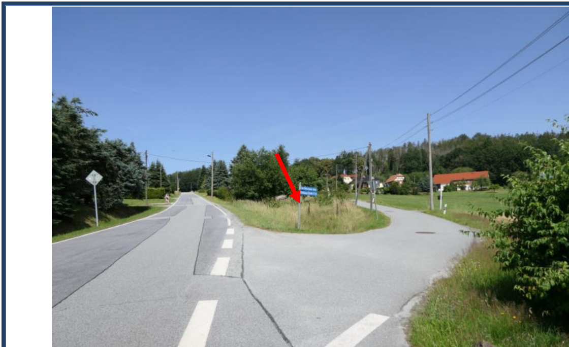
Abbildung 21: Blick in nordwestliche Richtung; Kreuzungsbereich der Halbauer Straße und der Straße "Am Kötzschauser Berg"; etwaige Lage des Flurstücks 398; umliegende Bebauung und Nutzung