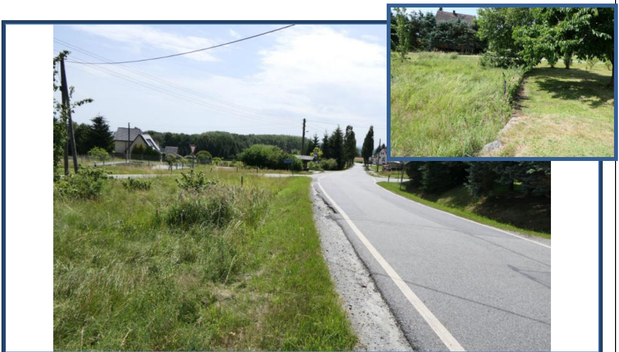
Abbildung 24: Blick in südöstliche Richtung zum Kreuzungsbereich der Halbauer Straße und der Straße "Am Kötzschaer Berg"; links das Flurstück 398; umliegende Bebauung und Nutzung