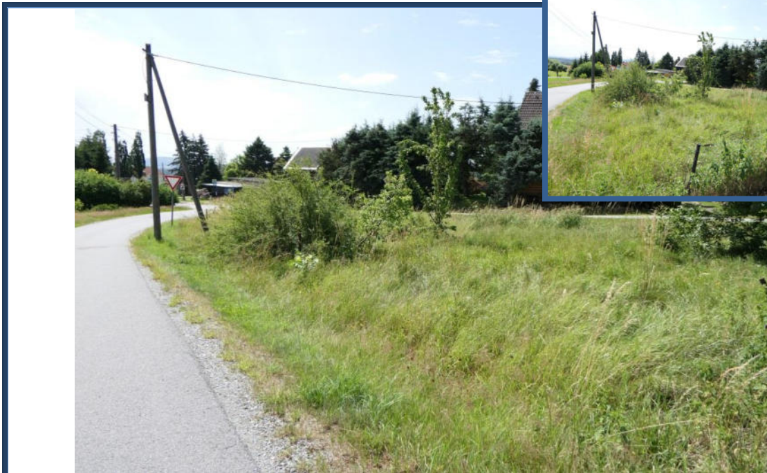
Abbildung 23: Verwilderte Außenanlagen auf Flurstück 398