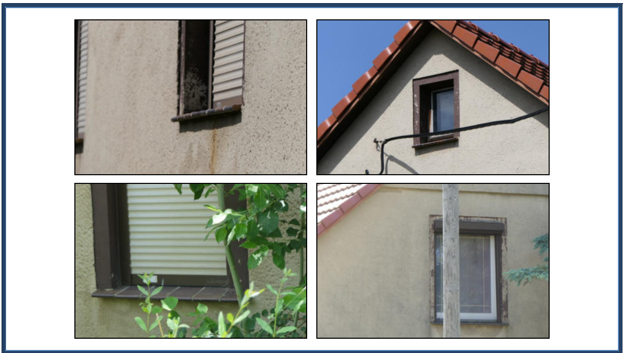
Abbildung 7: Detailansichten: Fenster, Fassade