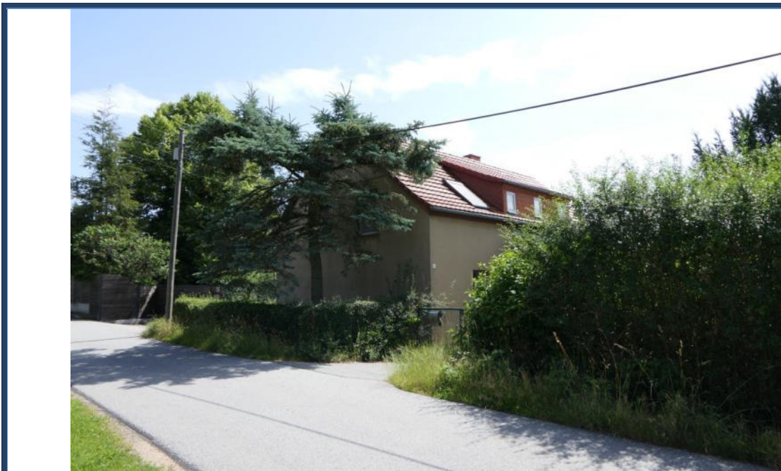
Abbildung 16: Blick zum Bewertungsobjekt von der Kleindehsaer Straße