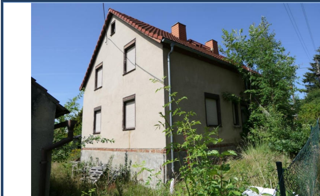
Abbildung 3: Nord-Ost-Ansicht; verwilderte Außenanlagen