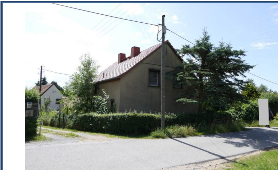
Abbildung 15: Blick zum Bewertungsobjekt von der Kleindehsaer Straße; umliegende Bebauung