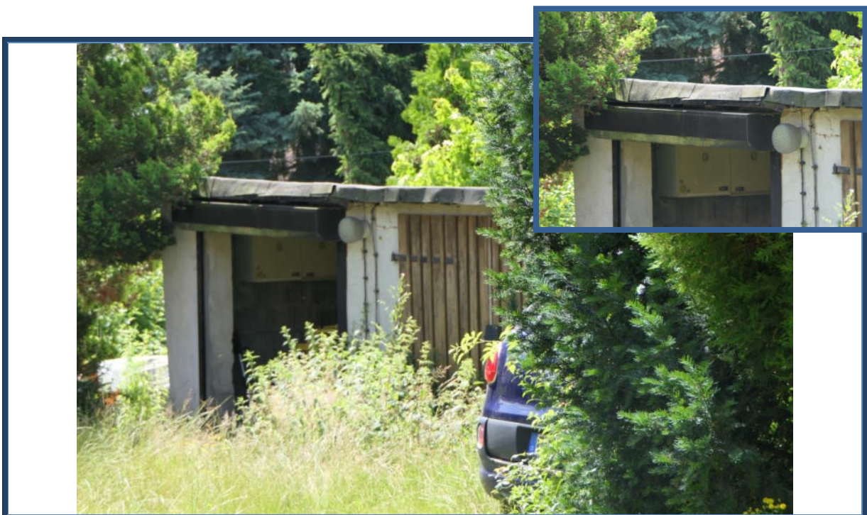
Abbildung 12: Garagengebäude; verwilderte Außenanlagen