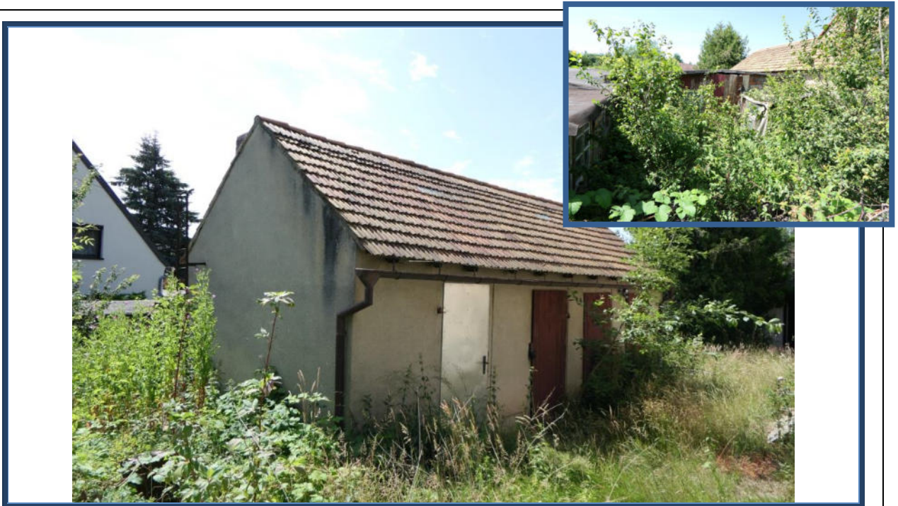
Abbildung 11: Einfaches Nebengebäude mit mehreren abrisssreifen Schuppenanbauten o. ä.; verwilderte Außenanlagen