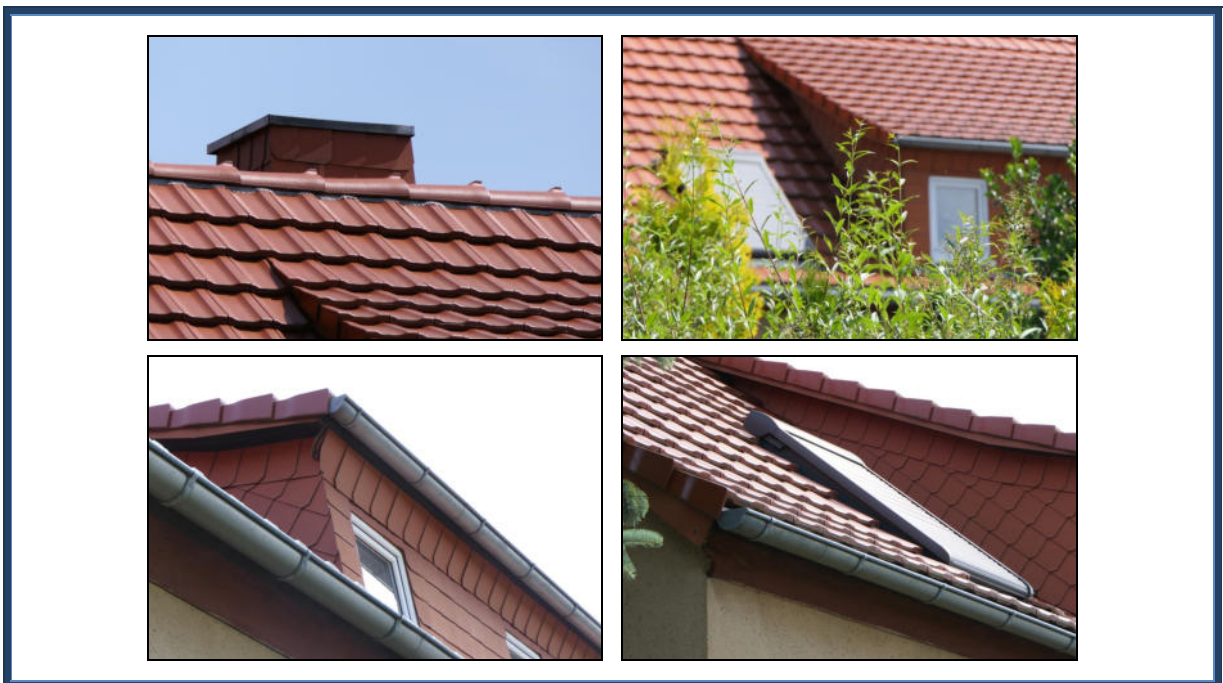
Abbildung 8: Detailansichten: Dacheindeckung