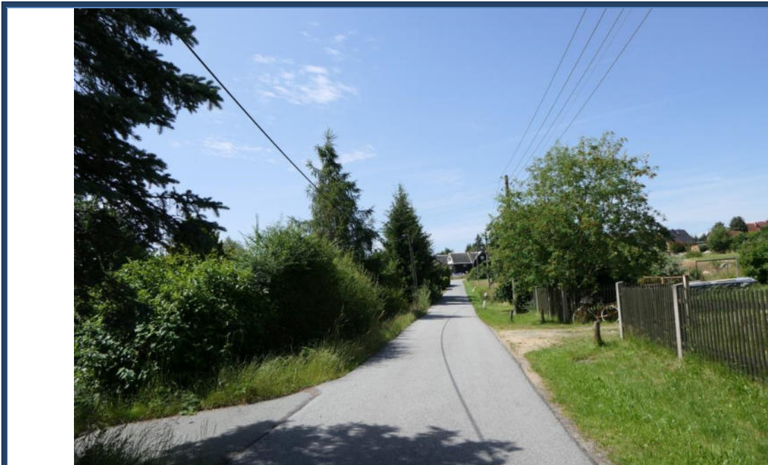
Abbildung 18: Blick in südwestliche Richtung in die Kleindehsaer Straße; links der Einfahrtsbereich; umliegende Nutzungen