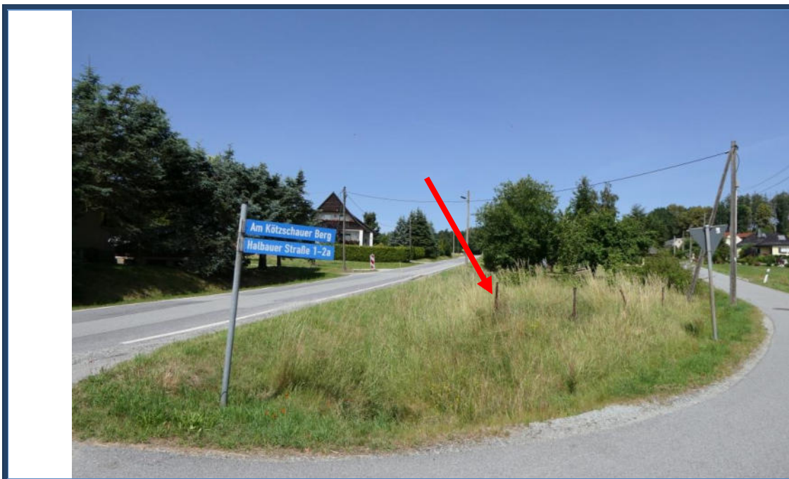
Abbildung 22: Blick in nordwestliche Richtung; Kreuzungsbereich der Halbauer Straße und der Straße "Am Kötzschauser Berg"; etwaige Lage des Flurstücks 398; umliegende Bebauung und Nutzung