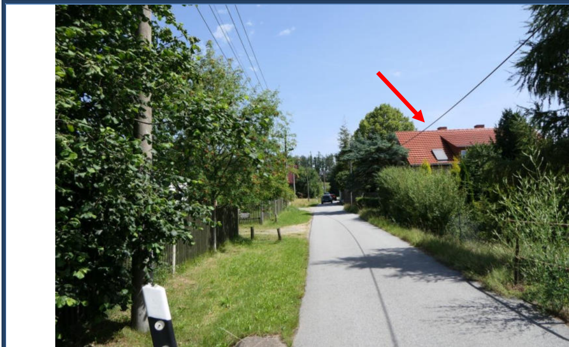
Abbildung 19: Blick in nordöstliche Richtung in die Kleindehsaer Straße; rechts das Bewertungsobjekt; umliegende Nutzungen