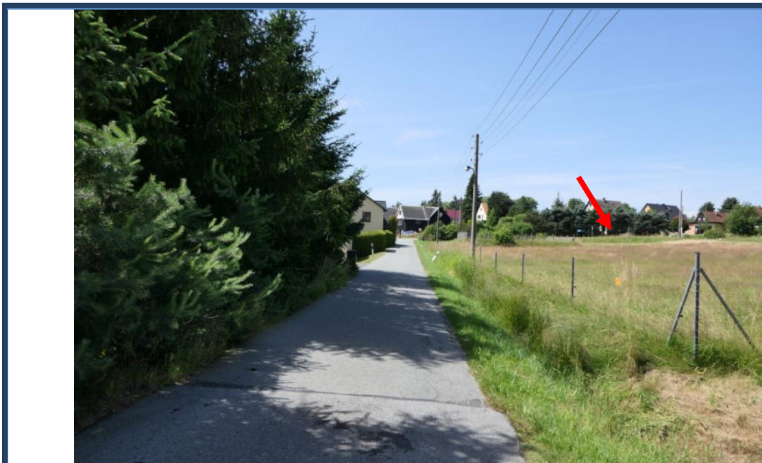
Abbildung 20: Blick in südwestliche Richtung in die Kleindehsaer Straße zum Kreuzungsbereich mit der Halbauer Str.; etwaige Lage des Flurstücks 398; umliegende Bebauung und Nutzung