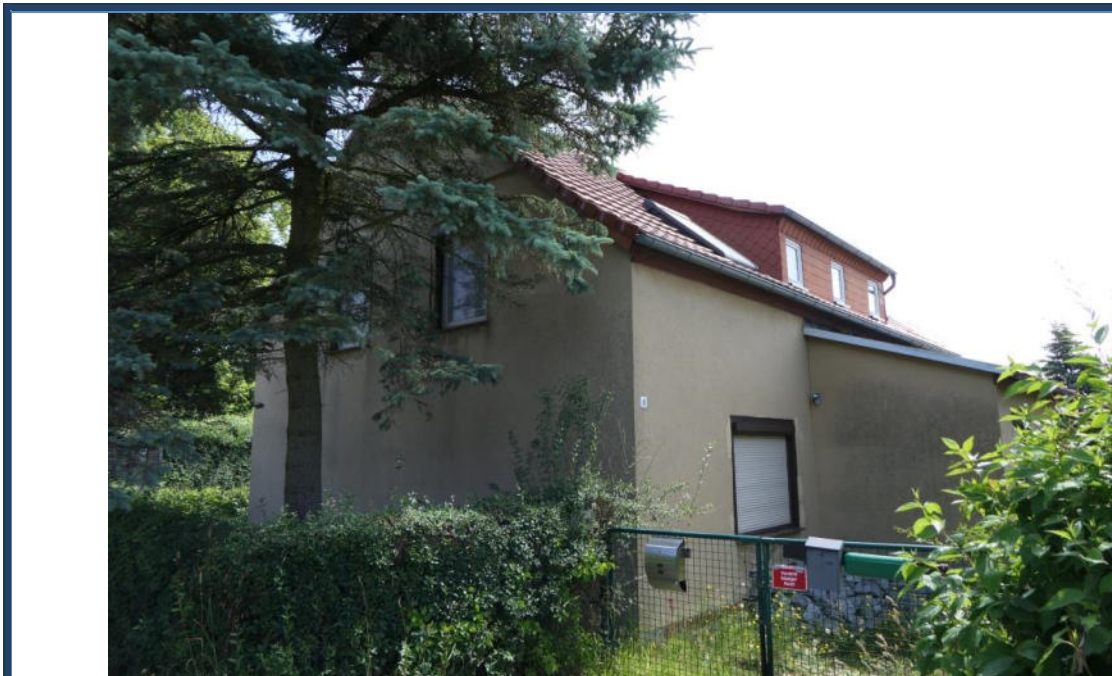
Abbildung 4: Süd-West-Ansicht; Einfahrtsbereich; rechts der Eingangsanbau; Außenanlagen