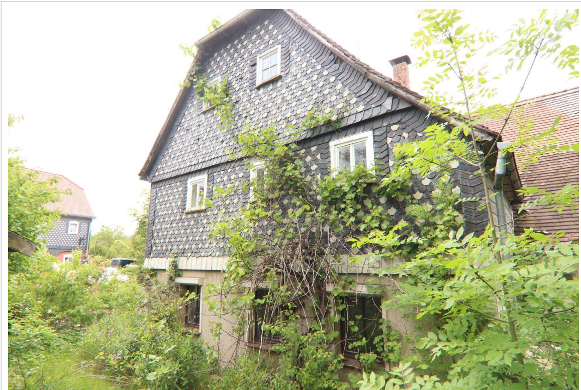
Blick auf den südlichen Giebel des zu bewertenden historischen Wohnhauses auf dem Grundstück Hauptstraße 71 in Kottmar OT Obercunnersdorf.

Im vorliegenden Fall ist das Grundstück Hauptstraße 71 in Kottmar OT Obercunnersdorf zu bewerten, das mit einem Wohnhaus bebaut ist.