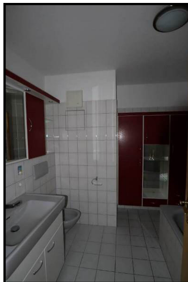
Bad im Obergeschoss