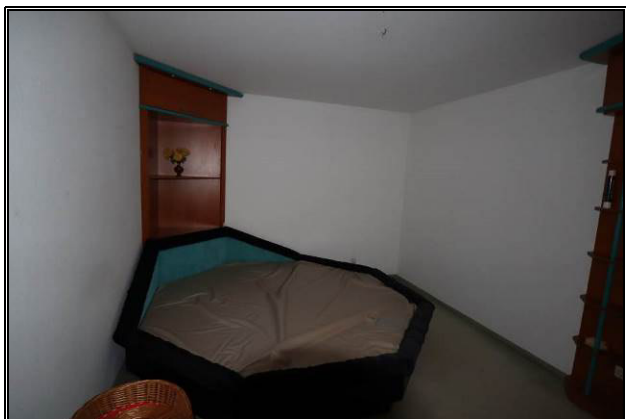
Schlafzimmer im Obergeschoss