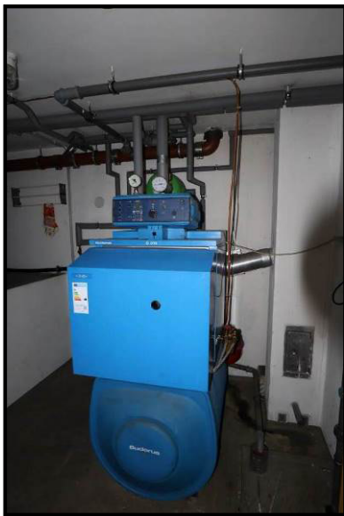
Detailansicht der Heizungsanlage