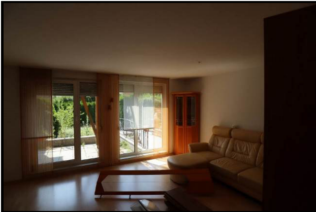
Wohnzimmer im Erdgeschoss mit Zugang zur Terrasse