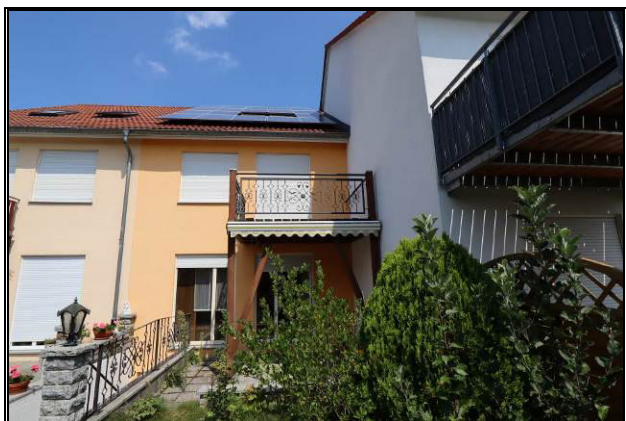
Süd-Ansicht des Bewertungsobjekts