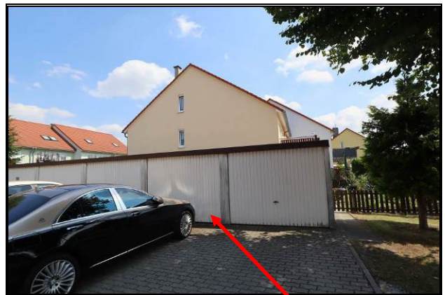
Teil der West-Ansicht der Reihengarage; bewertungsgegenständlich