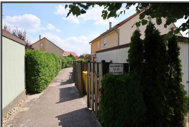
Wohnweg des Teilgrundstücks 2 zum Bewertungsobjekt (Teilgrundstück 1)