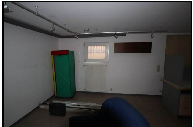
Hobbyraum im Kellergeschoss