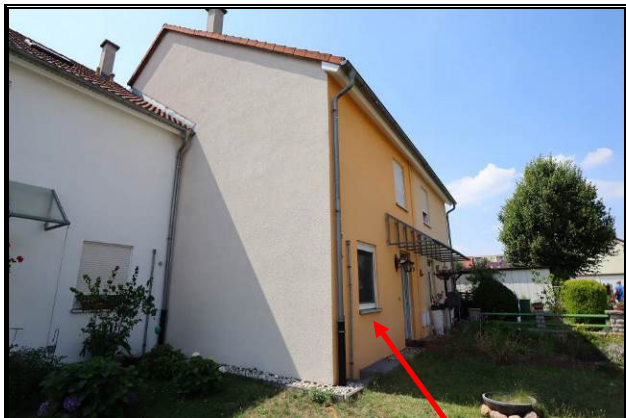
Ost-Ansicht des Bewertungsobjekts