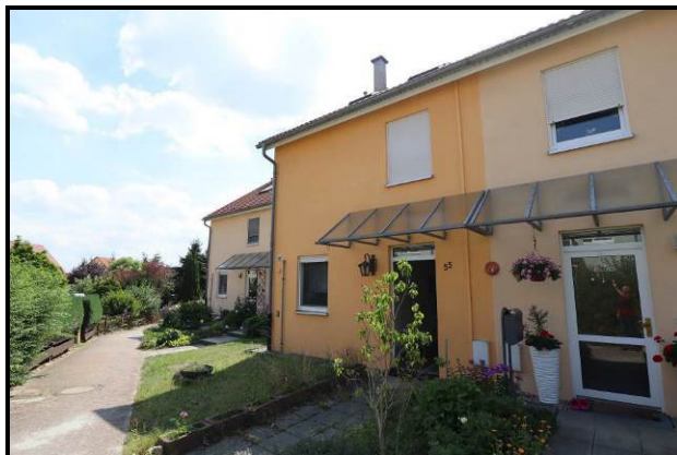
Nord-Ansicht des Wohnhauses