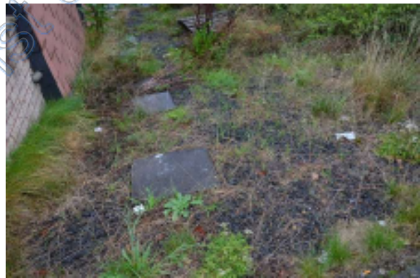
Zuwegung in den Garten