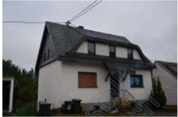
Straßenansicht mit Giebelseite links