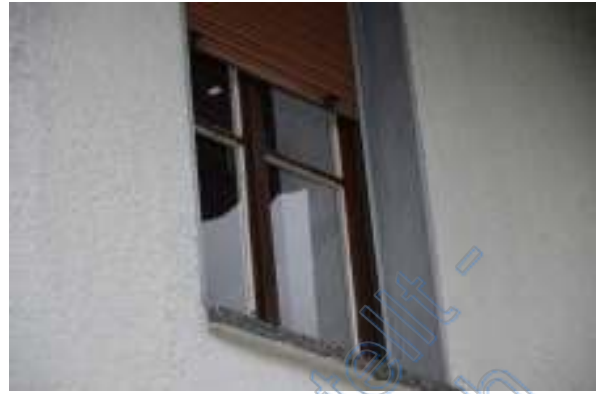
Fenster Gebäuderückseite exemplarisch