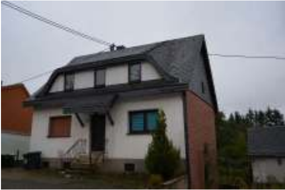
Straßenansicht mit Giebelseite rechts