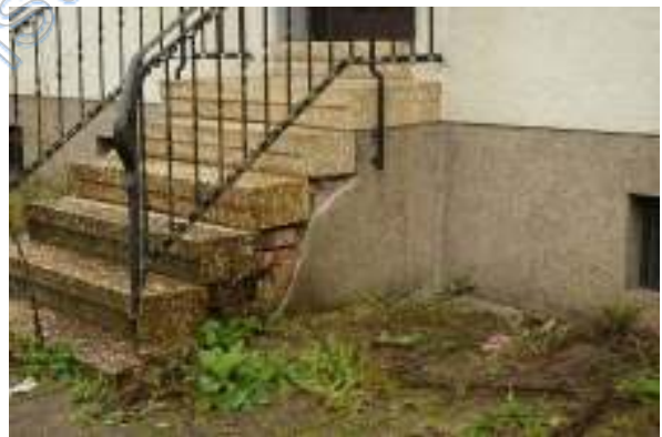
Eingangstreppe mit Putz- und Feuchtigkeitsschäden sowie verschobener Trittstufe