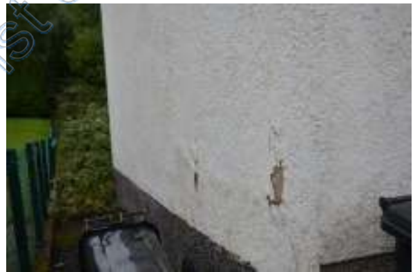
Fassade verfärbt und verschmutzt sowie Putzschäden