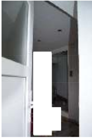
Blick durch offenstehende Tür in Kellergeschoss