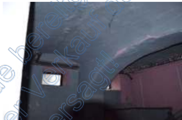
Blick in Kellergeschoss (offenstehende Tür)