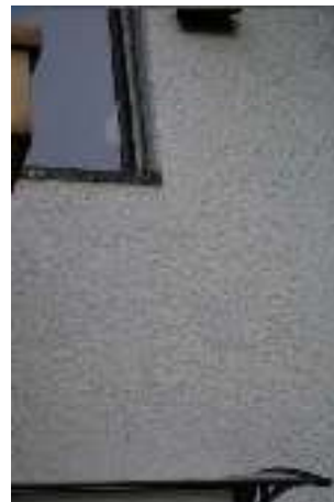
Fassade mit Rissbildung