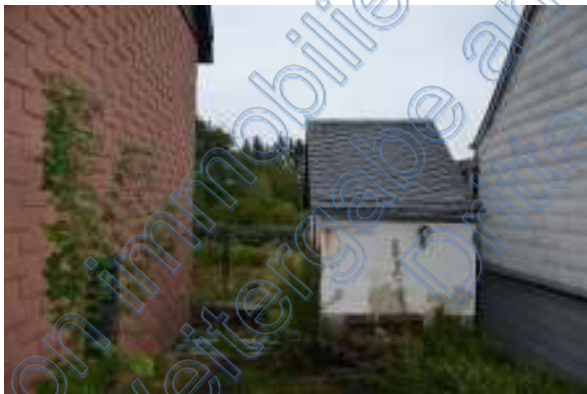
Giebelseite rechts und Geräteschuppen