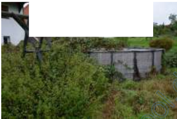
Garten mit Pool