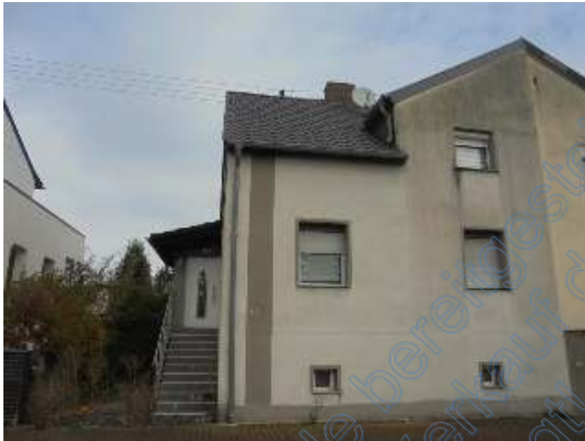
Ansicht von der Ellerstraße