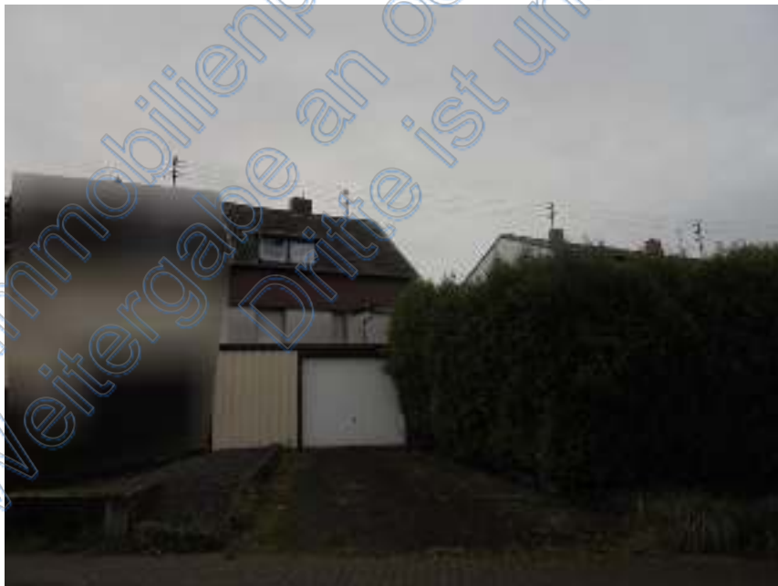
Ansicht von der Ziegelhütter Straße