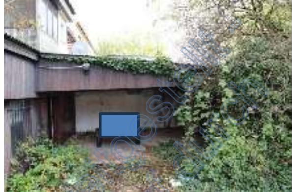
Ansicht Carport/teilw. offene Garage