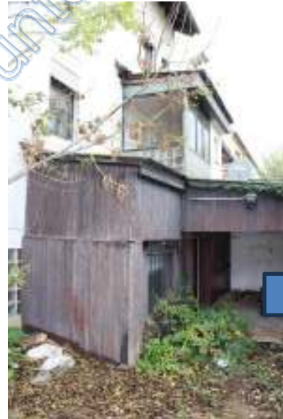
Ansicht Rückseite Wohnhaus und Carport/Garage teilweise