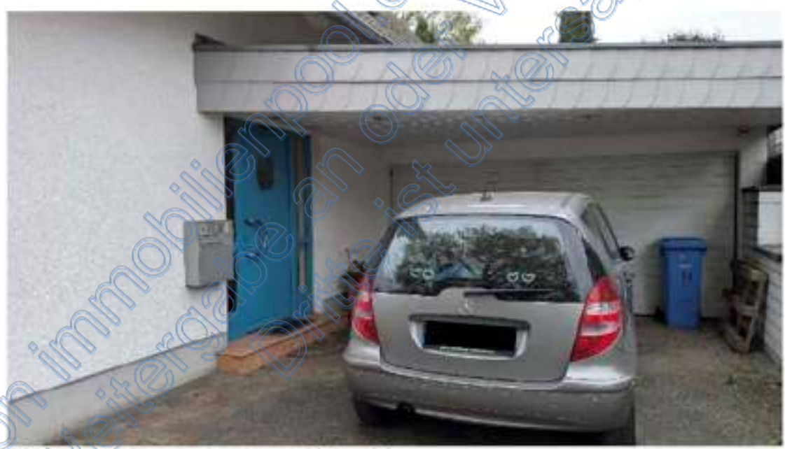
Bild B6 Eingangsbereich mit Blick auf Garage