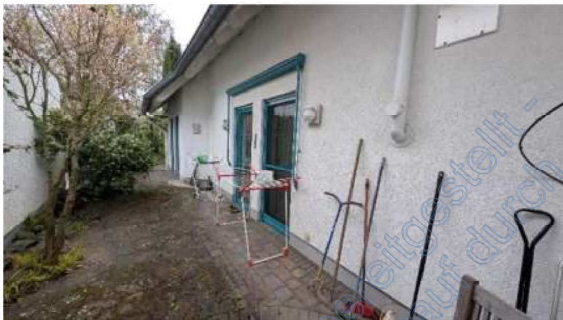
Bild B3 exemplarische Gebäudeansicht