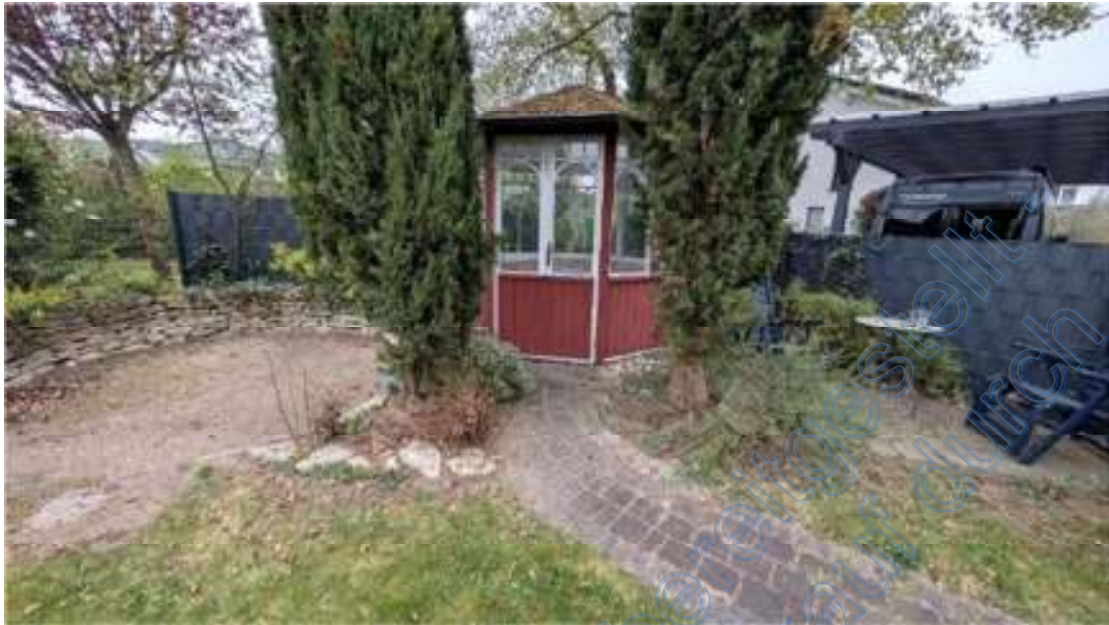
Bild B7 exemplarische Gartenansicht