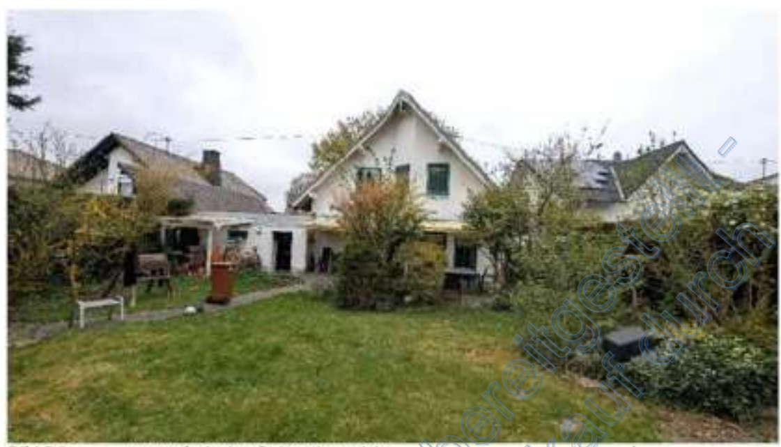
Bild B5 exemplarische Gebäudeansicht