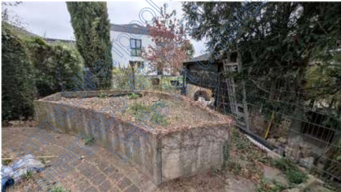
Bild B8 exemplarische Gartenansicht