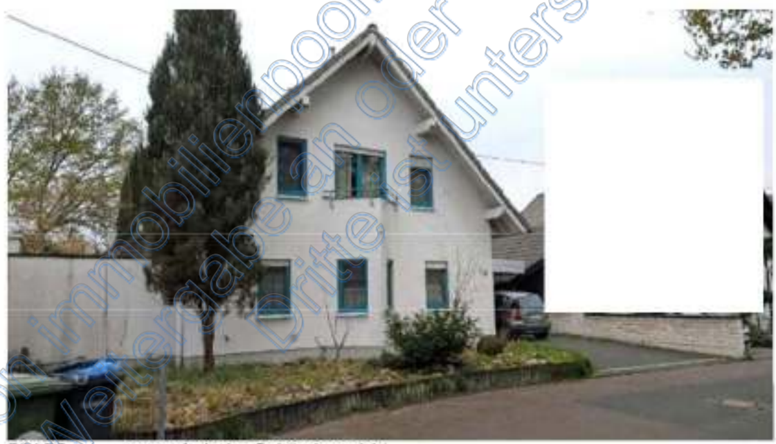
Bild B2 exemplarische Gebäudeansicht