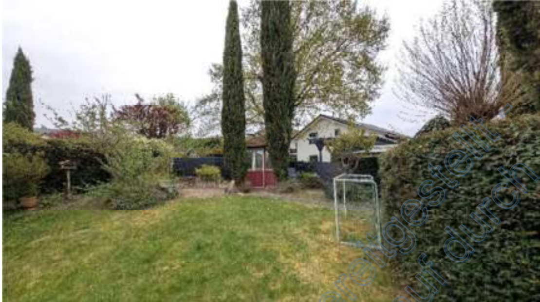
Bild B9 exemplarische Gartenansicht

Von immobilienpool.de bereitgestellt - Weitergabe an oder Verkauf durch Dritte ist untersagt!