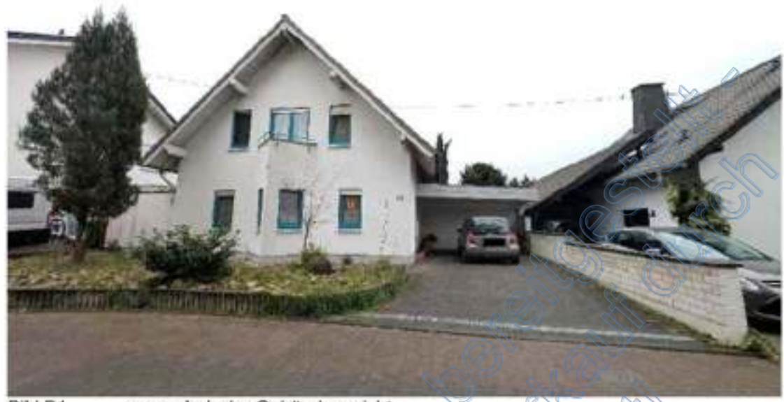
Bild B1 exemplarische Gebäudeansicht