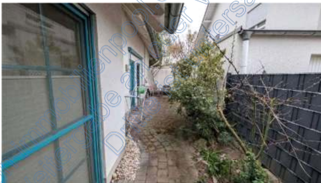
Bild B4 exemplarische Gebäudeansicht