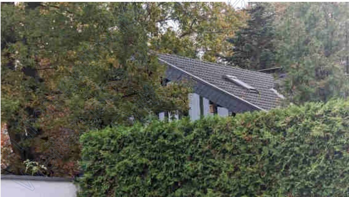
Bild B4 exemplarische Teilausschnitt des Gebäudes