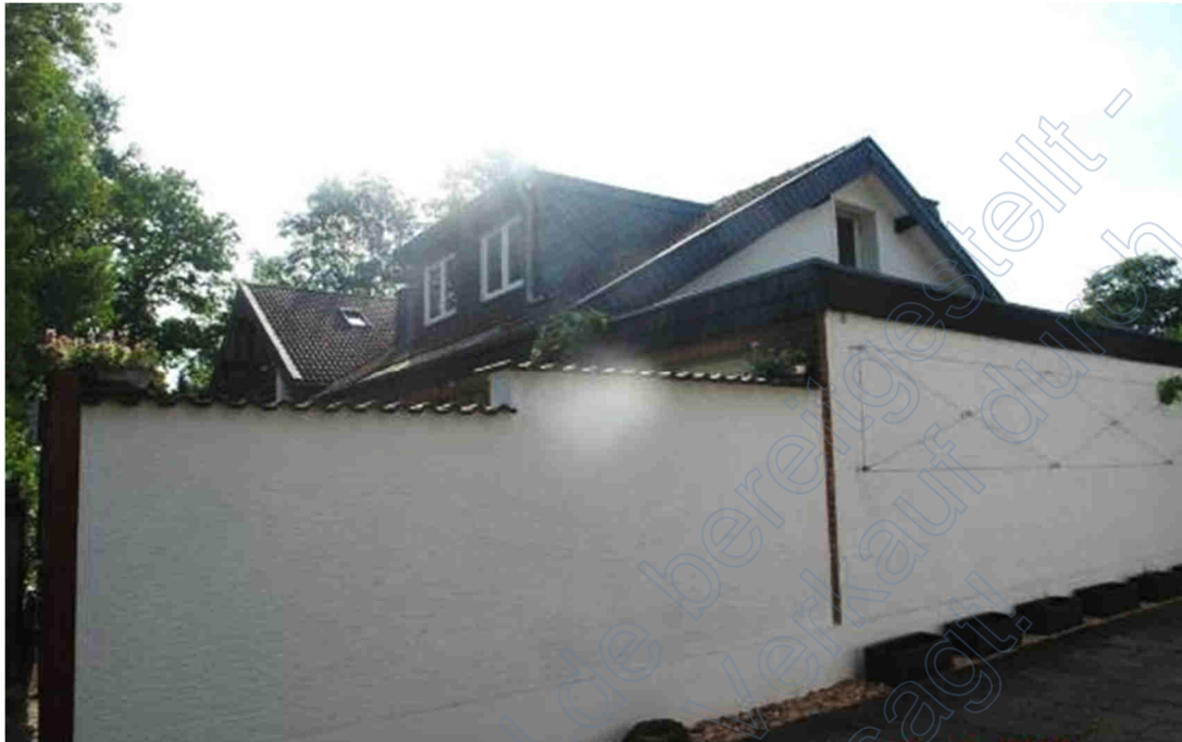
Bild B5 exemplarischer Teilausschnitt des Gebäudes