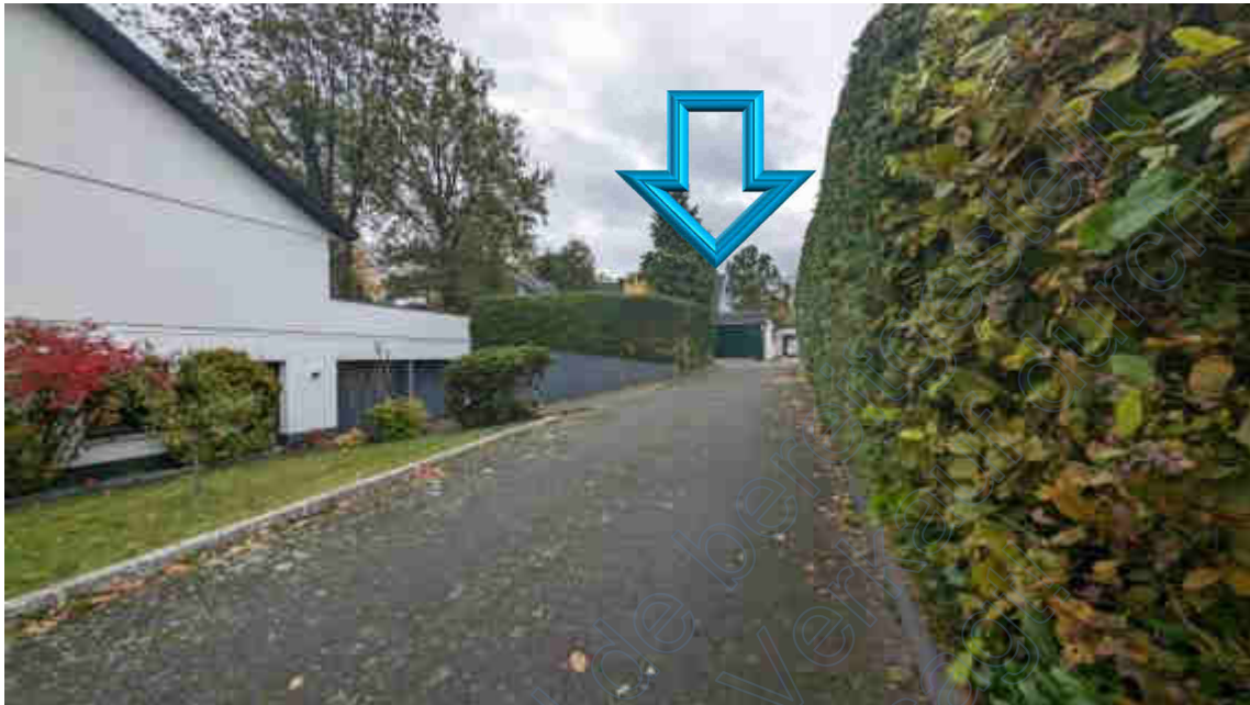
Bild B1 Blick von der Erschließungsstraße in Richtung Bewertungsobjekt