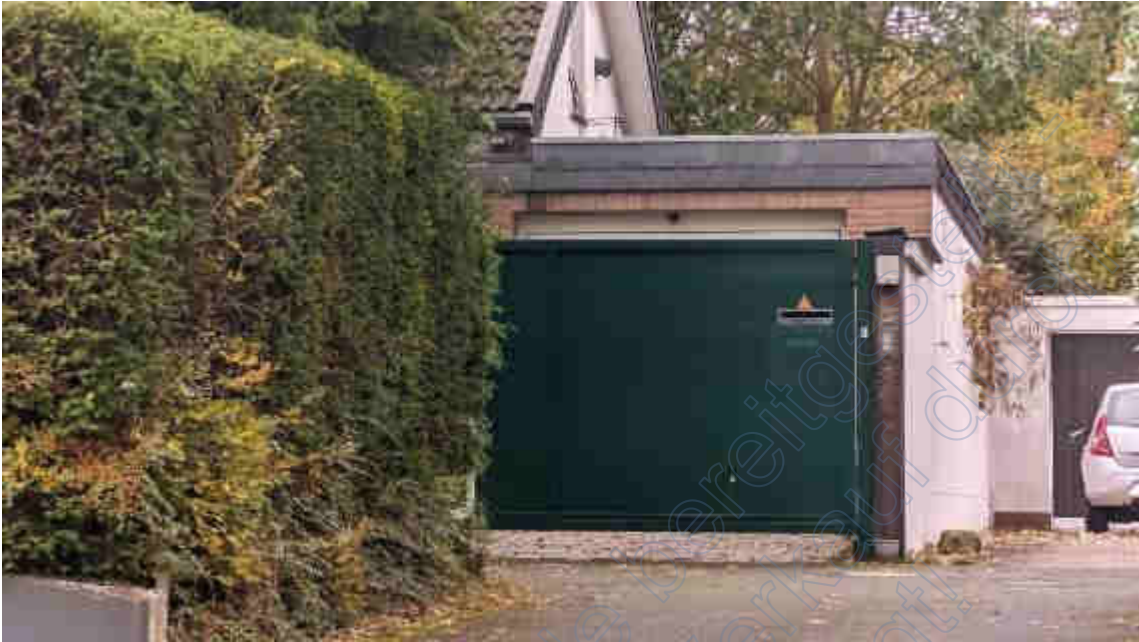
Bild B3 exemplarische Teilausschnitt des Gebäudes