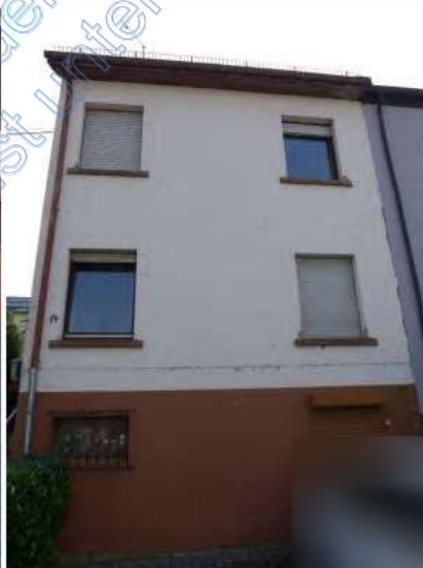
4 b Frontansicht (Westseite)