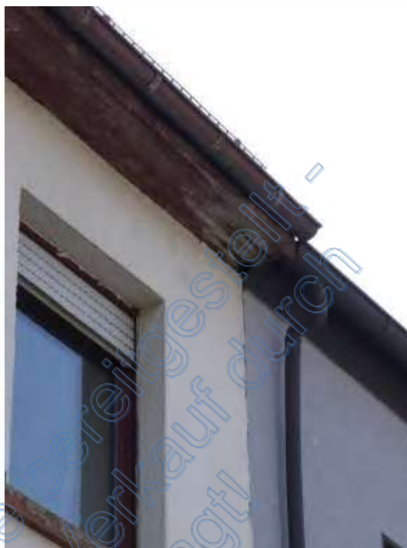
9 b schadhafter Dachrand