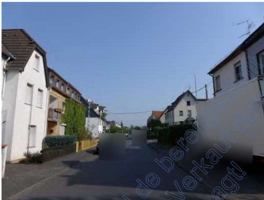
1 Honnefer Straße, Umgebungsbebauung