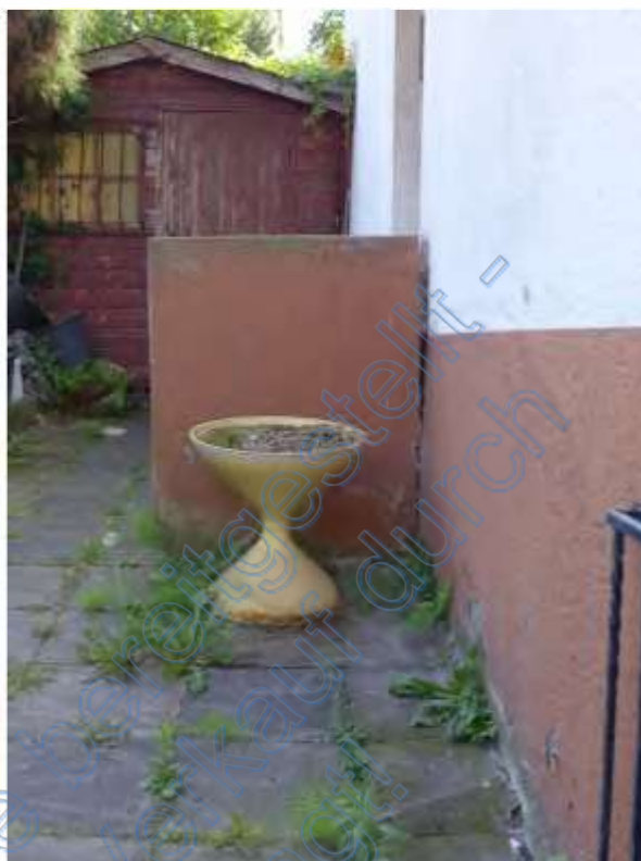
7 b Detail - Eingangsbereich