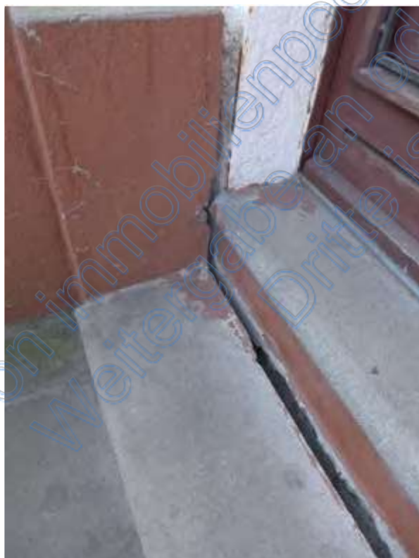
10 a abgängiger Treppenanschluss