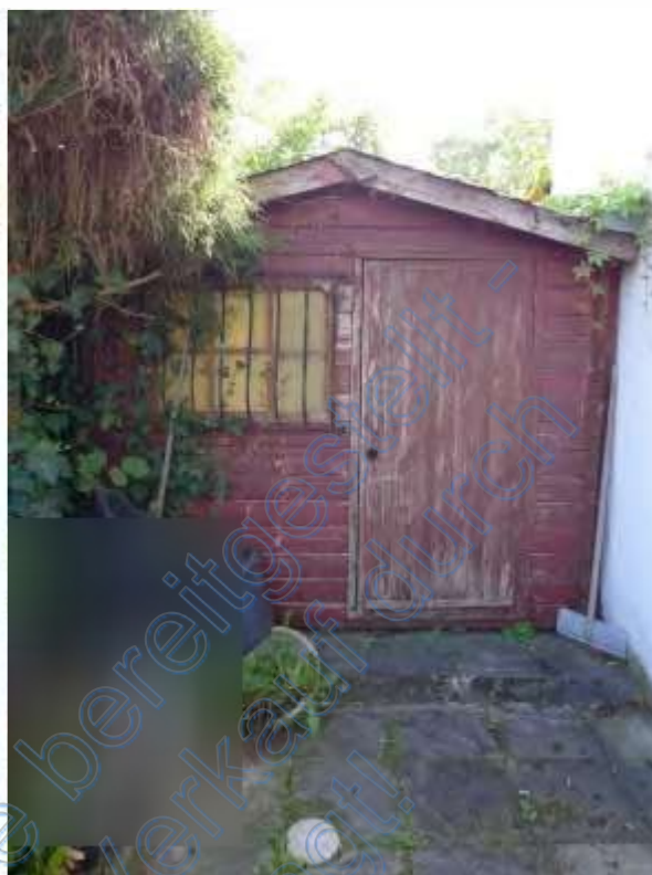
5 b Holzschuppen