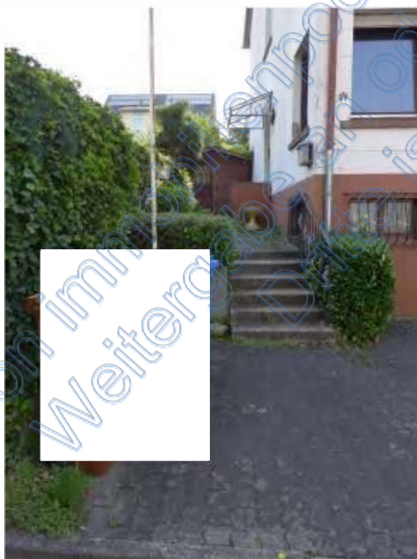
4 a Hauszugangsbereich