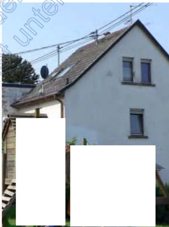
10 b Ansicht von Nordost (ohne Spielgerät)