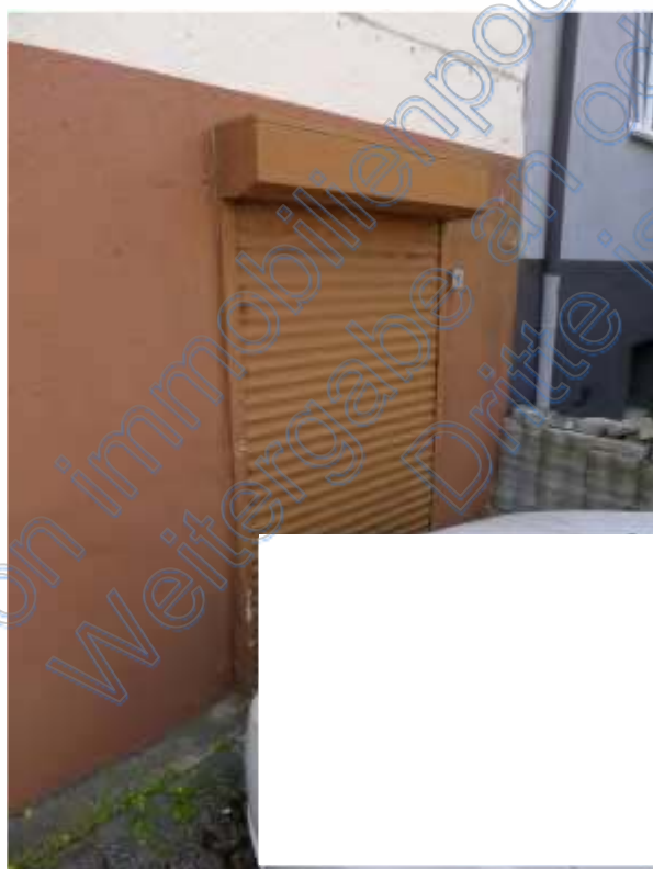
8 a Kellerausgang