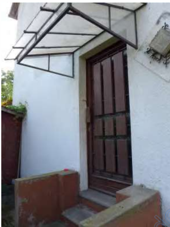
5 a Hauseingangstür