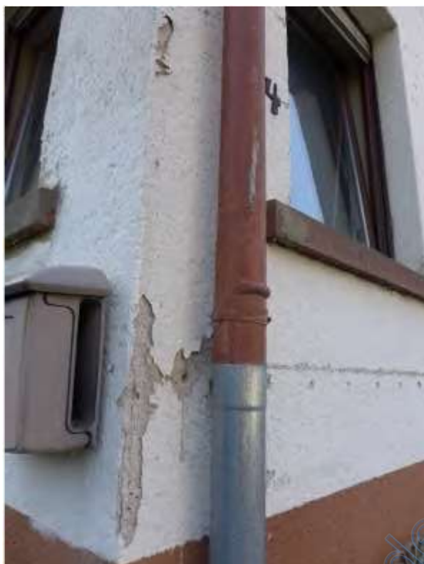
7 a Fassadenschäden