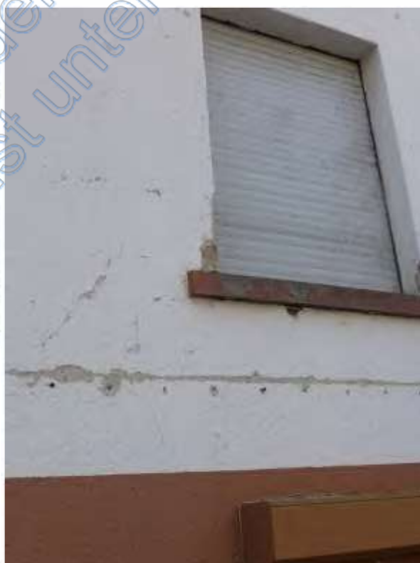
8 b Detail -Fassade