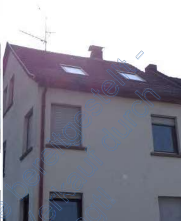
3 b Dacheindeckung