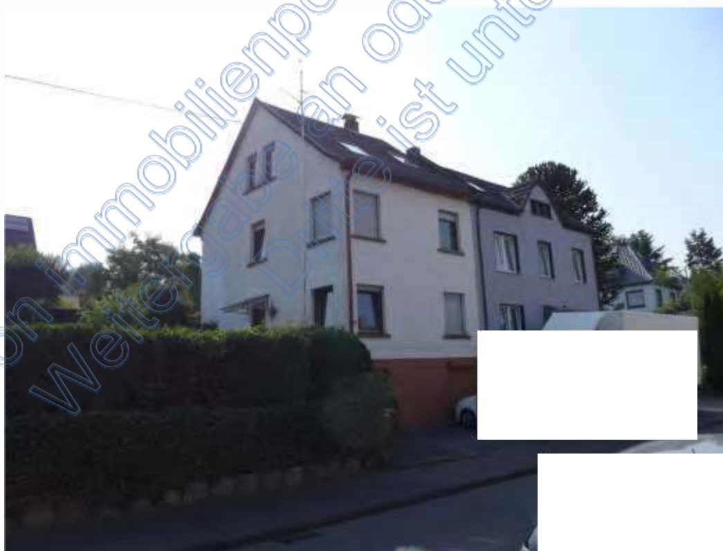
2 Straßenansicht (Nordwestansicht)