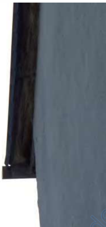
9 a schadhafter Dachrand