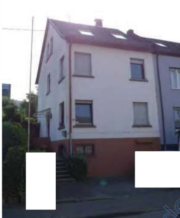
3 a Frontansicht (Westansicht)