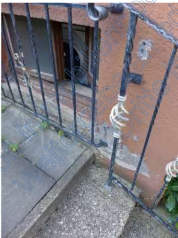
6 a Sockelputz