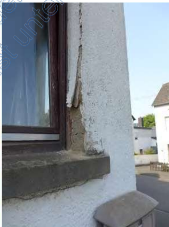
6 b Detail Fassade