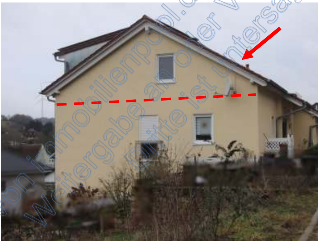
Seitenansicht (WE 1 befindet sich im DG)