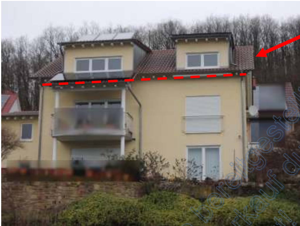
Rückansicht (WE 1 befindet sich im DG)