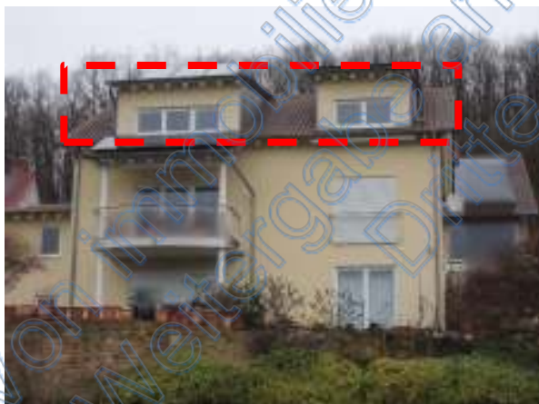
Wohnung Nr. 1 im DG (WE 1)

Versteigerungsobjekt, eingetragen im Grundbuch von Dörnbach, Blatt 938, BV 1, Gemarkung Dörnbach, 4/10 Miteigentumsanteil an Flurstück 1235/3 und 1245/10, Gebäude- und Freifläche Im Schlüssel 11, 158 m 2 und 414 m 2 , verbunden mit dem Sondereigentum an sämtlichen Räumen der Wohnung im Dachgeschoss, im Aufteilungsplan mit Nr. 1 bezeichnet