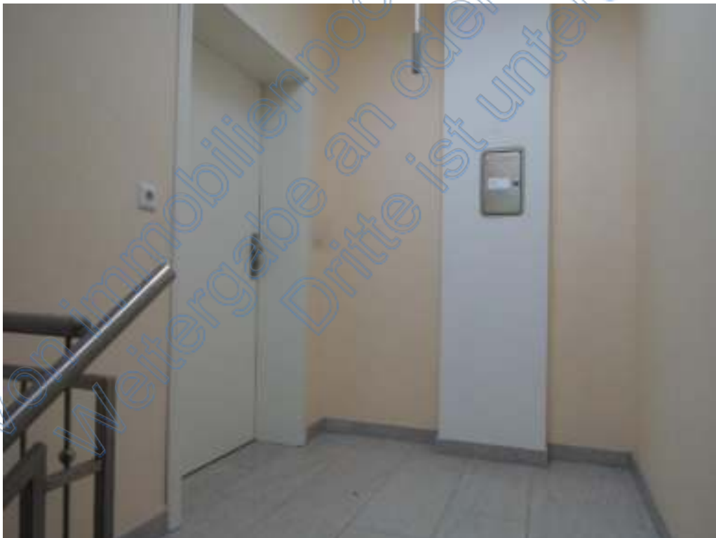
Wohnungseingang zu WE 1