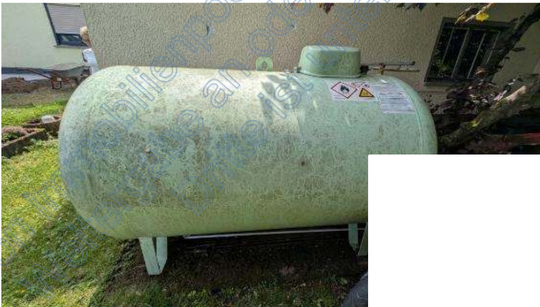
Bild C4 Beispiel Haustechnik