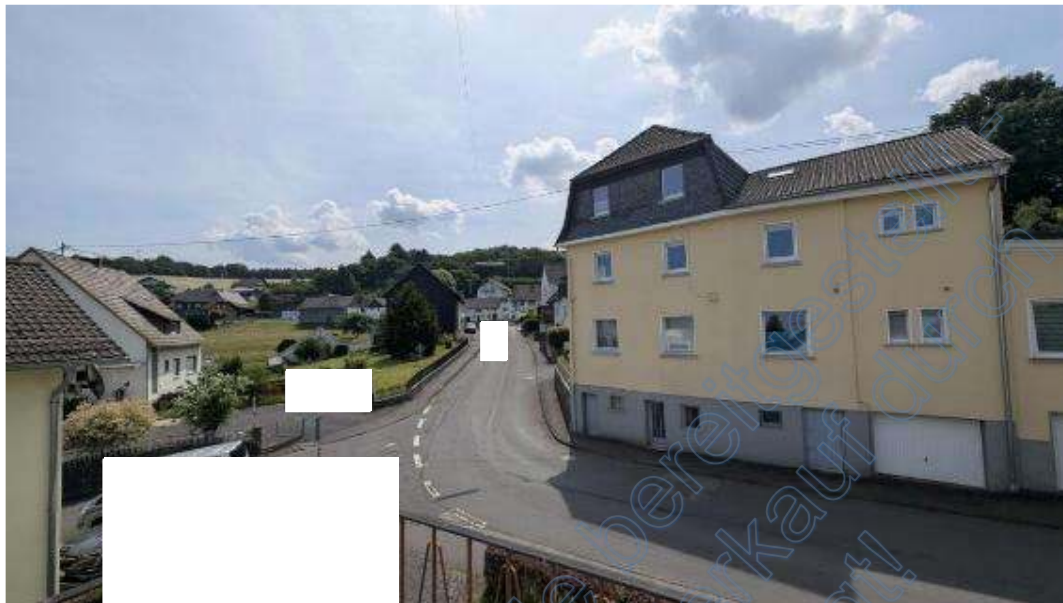
Bild A3 Umfeld