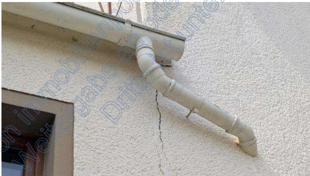
Bild D6 Beispiel Unterhaltungsbesonderheiten