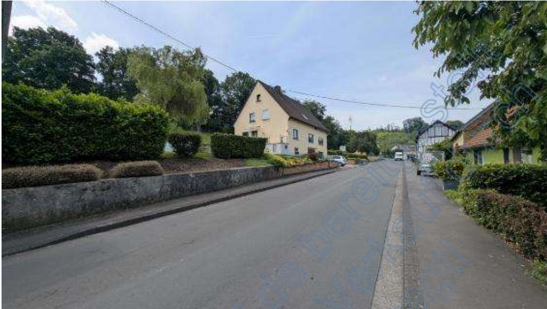
Bild A1 Blick in die Erschließungsstraße