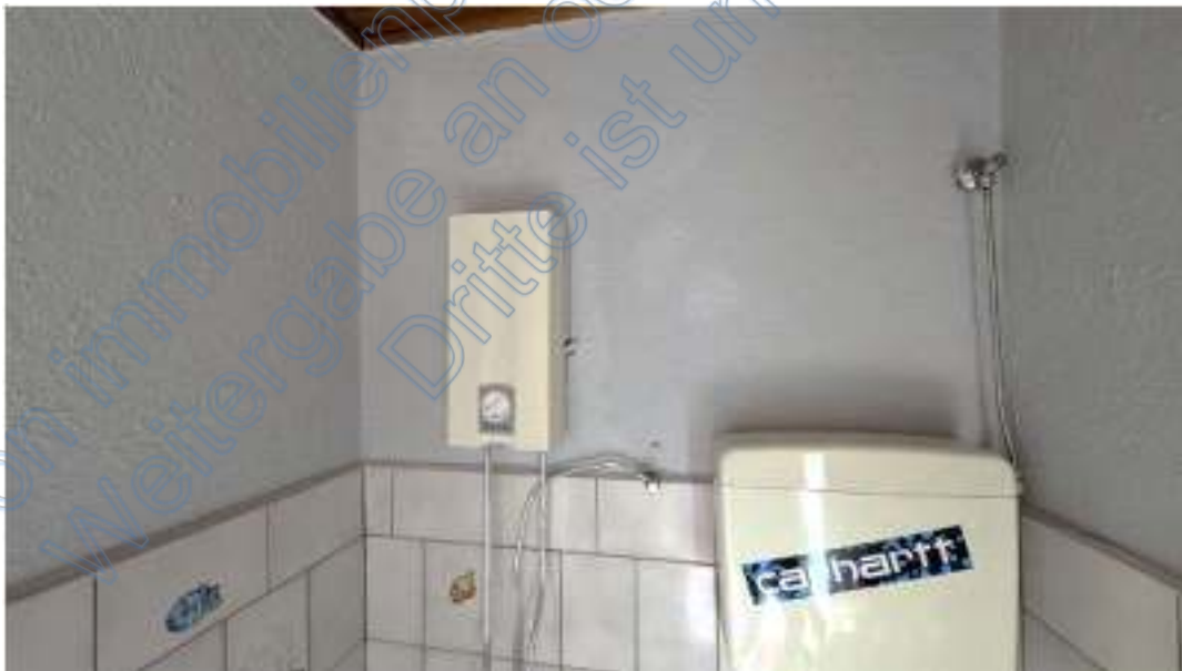
Bild C2 Beispiel Haustechnik