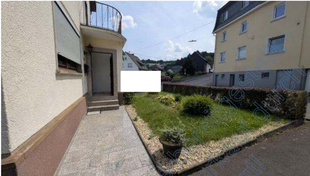
Bild B4 Gebäudeeingang