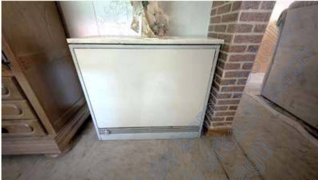
Bild C1 Beispiel Haustechnik