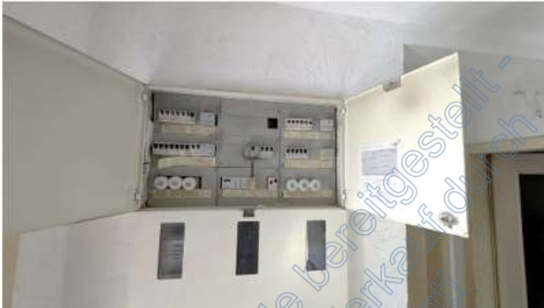
Bild C3 Beispiel Haustechnik