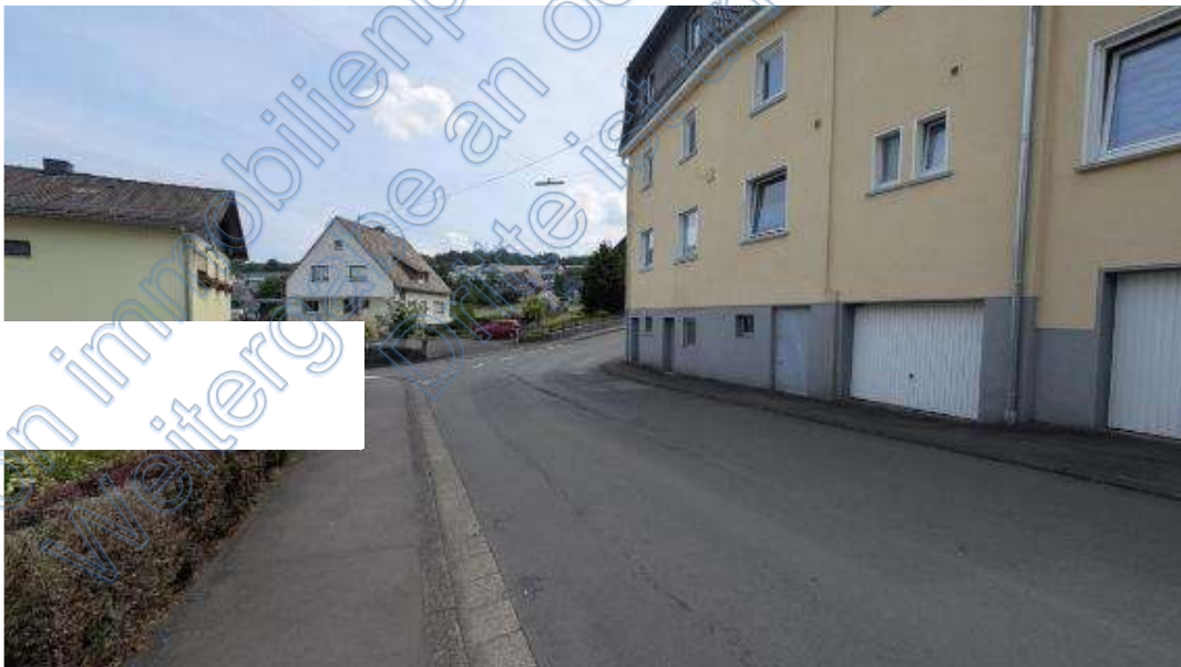
Bild A2 Blick in die Erschließungsstraße