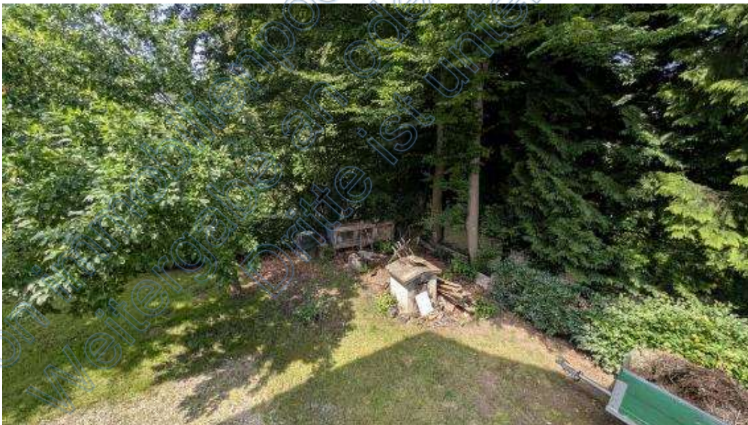
Bild B5 exemplarische Grundstücksfreifläche