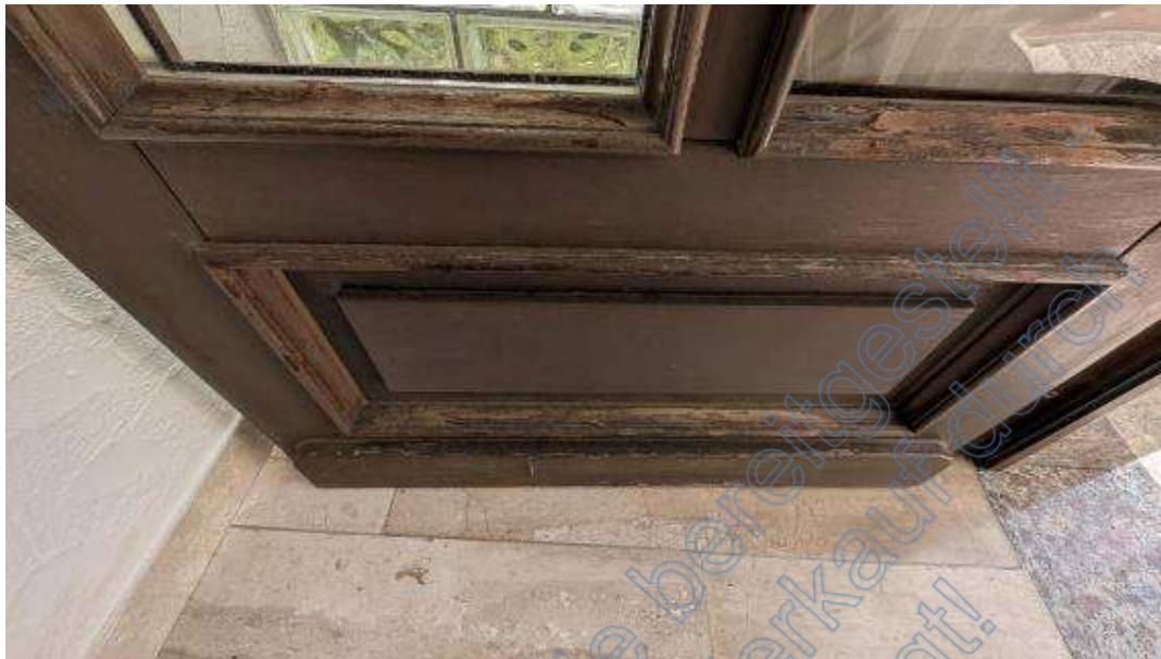
Bild D3 Beispiel Unterhaltungsbesonderheiten