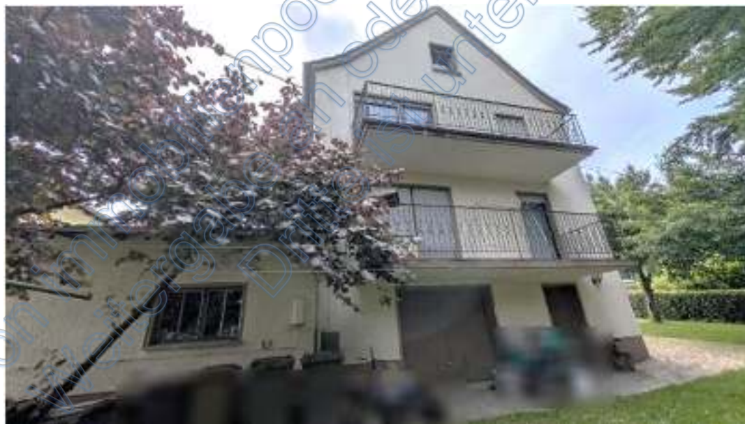
Bild B3 exemplarische Außenansicht