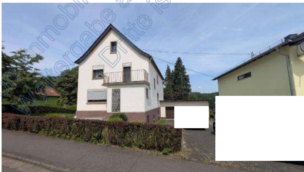
Bild B1 exemplarische Außenansicht