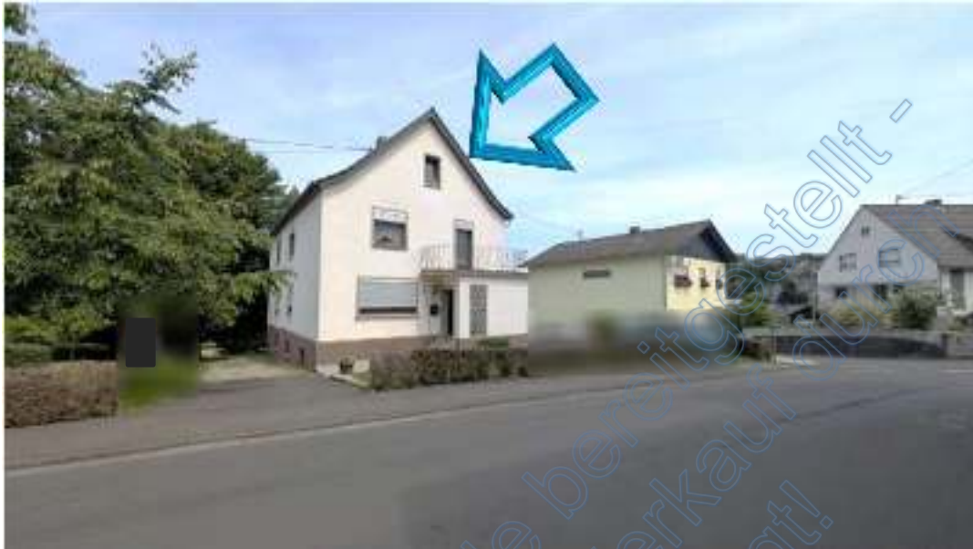
Bild B2 exemplarische Außenansicht