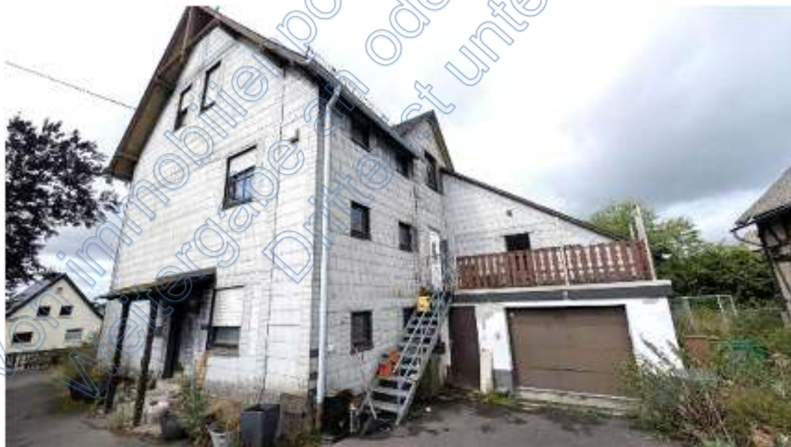
Bild B4 Wohnhausansicht