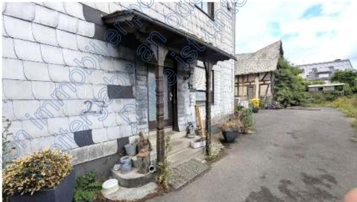
Bild B8 Wohnhauseingang