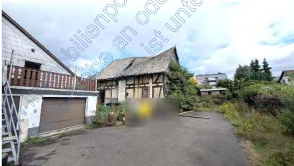
Bild B6 Scheune mit Garage