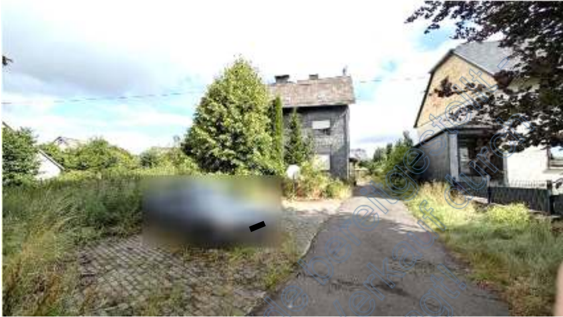
Bild B1 Wohnhausansicht