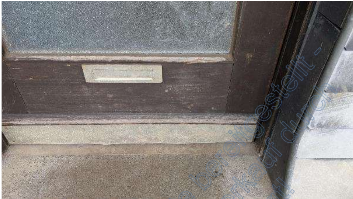
Bild C2 Unterhaltungsbesonderheiten