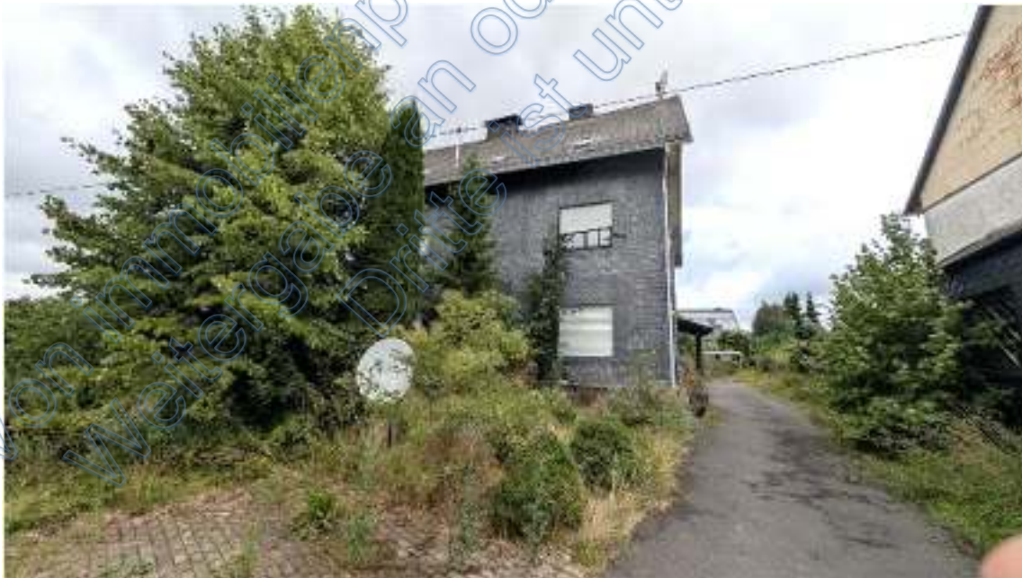
Bild B2 Wohnhausansicht