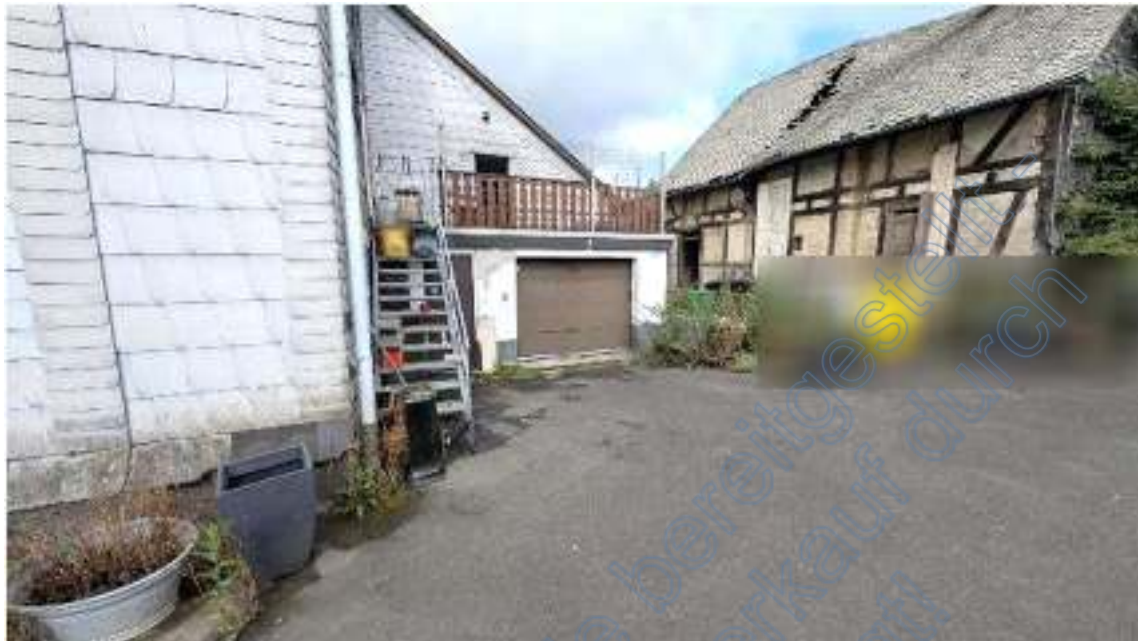
Bild B5 Garage mit Scheune