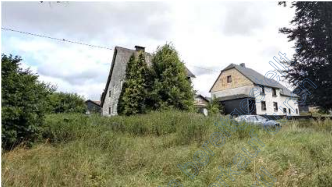
Bild B3 Wohnhausansicht