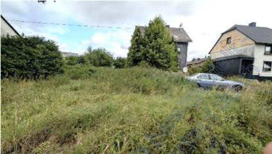
Bild B9 Blick auf den westlichen Grundstücksbereich