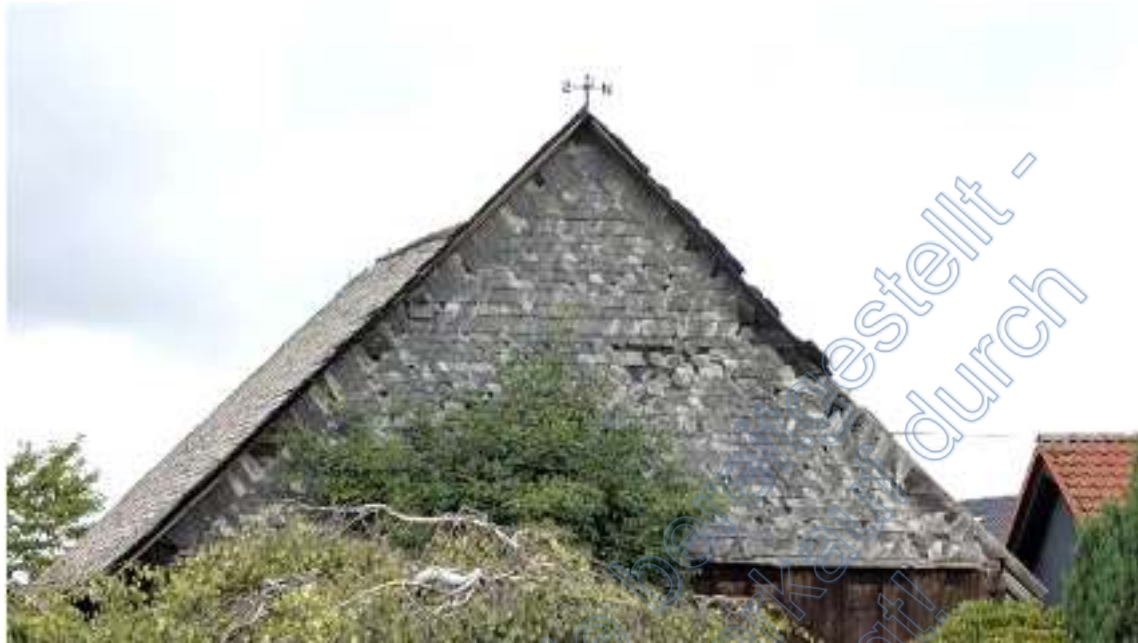
Bild B7 Scheune