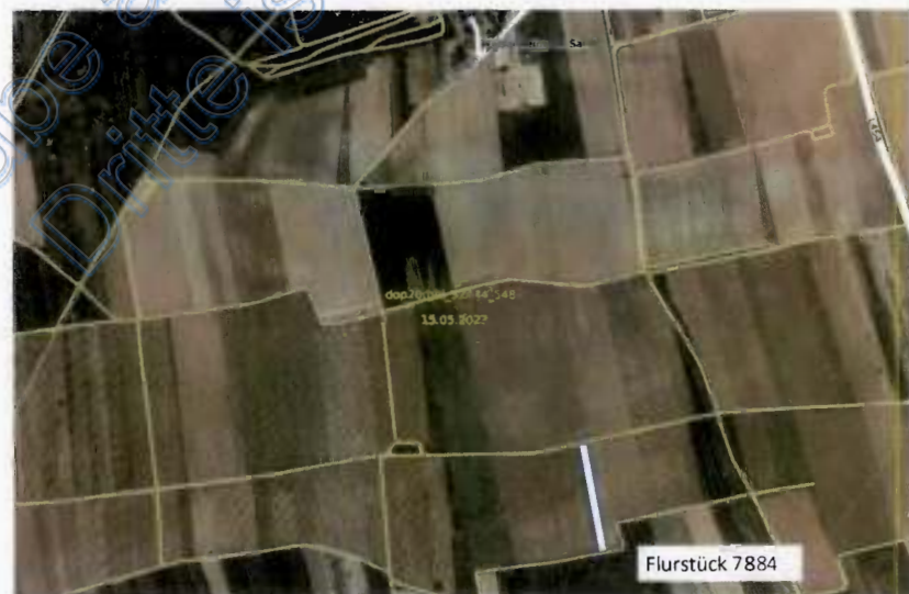
Abb. 2: Lage der Flurstücks 7884 in der Gemarkung Weisenheim am Sand