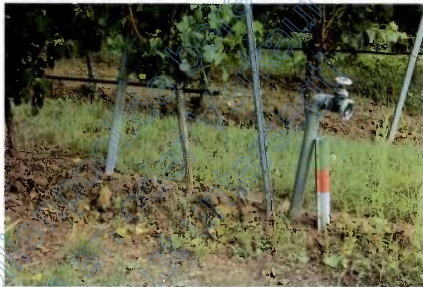
Abb. 3: Anlage einer Tröpfchenbewässerung mit Wasseranschluss auf dem Flurstück 7885

Geobasisinformationen des Verm.-Katasteramt Landau