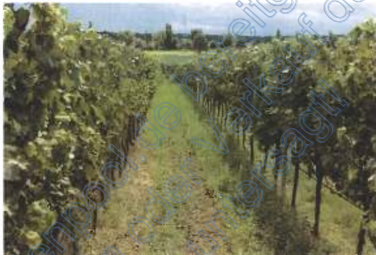
Abb. 1: Flurstück Nr. 7884 in der Gemarkung Weisenheim am Sand (Blick von Nord nach Süd)

Verkehrswert nach §§ 192 bis 199 BauGB für das Flurstück 7884 in der Gemarkung Weisenheim am Sand.