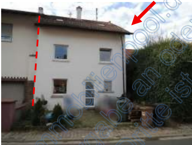
Straßenansicht Doppelhaushälfte (DHH)

Versteigerungsobjekt, eingetragen im Grundbuch von Mannweiler Blatt 265, BV 3, Gemarkung Mannweiler, Flurstück 1039, Gebäude- und Freifläche, Burgstr. 5, 106 m 2