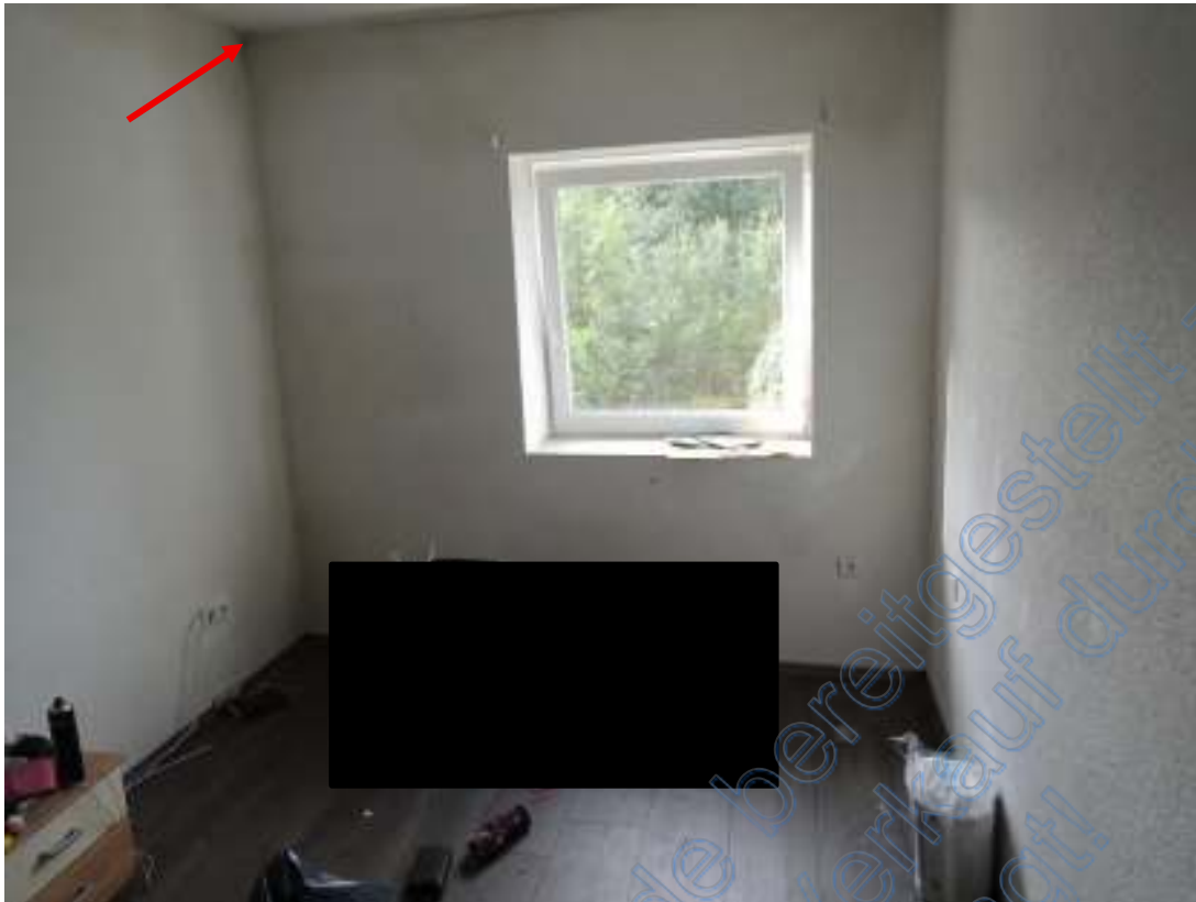
Zimmer (vermutlich punktueller Schimmelbefall – siehe Pfeil)