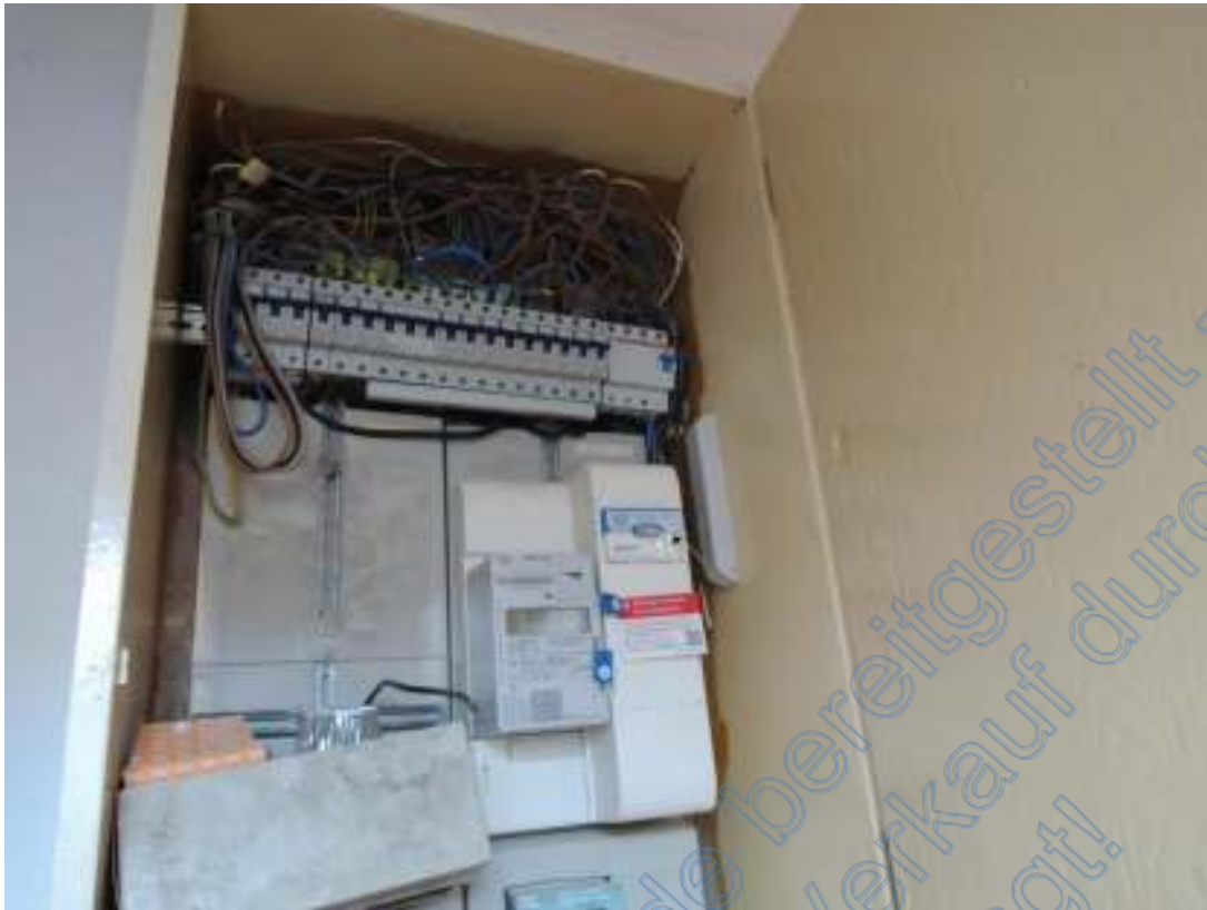
Sicherungs- und Zählerkasten