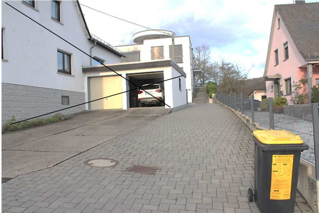
Zufahrt von der Waldstraße und süd-westliche Vorderansicht