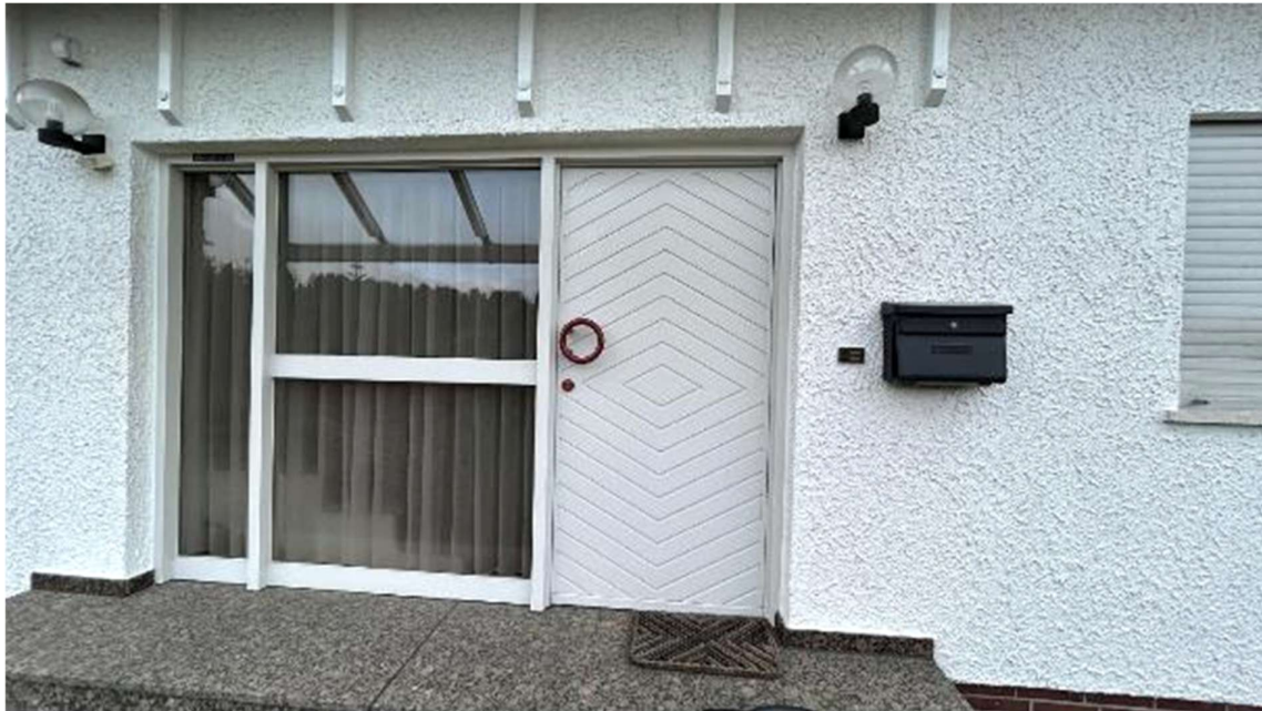
Bild B4 Hauseingänge