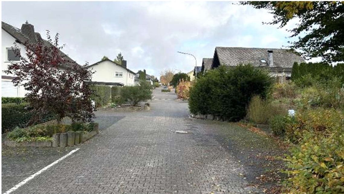
Bild A2 Erschließungssituation