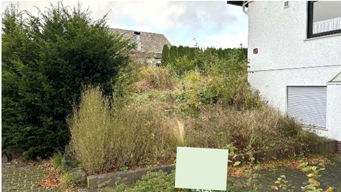
Bild B8 Grundstücksfreifläche