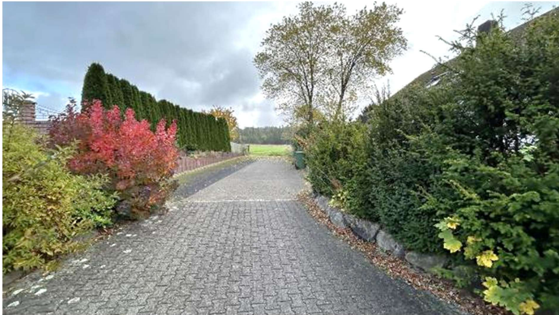
Bild A3 Erschließungssituation