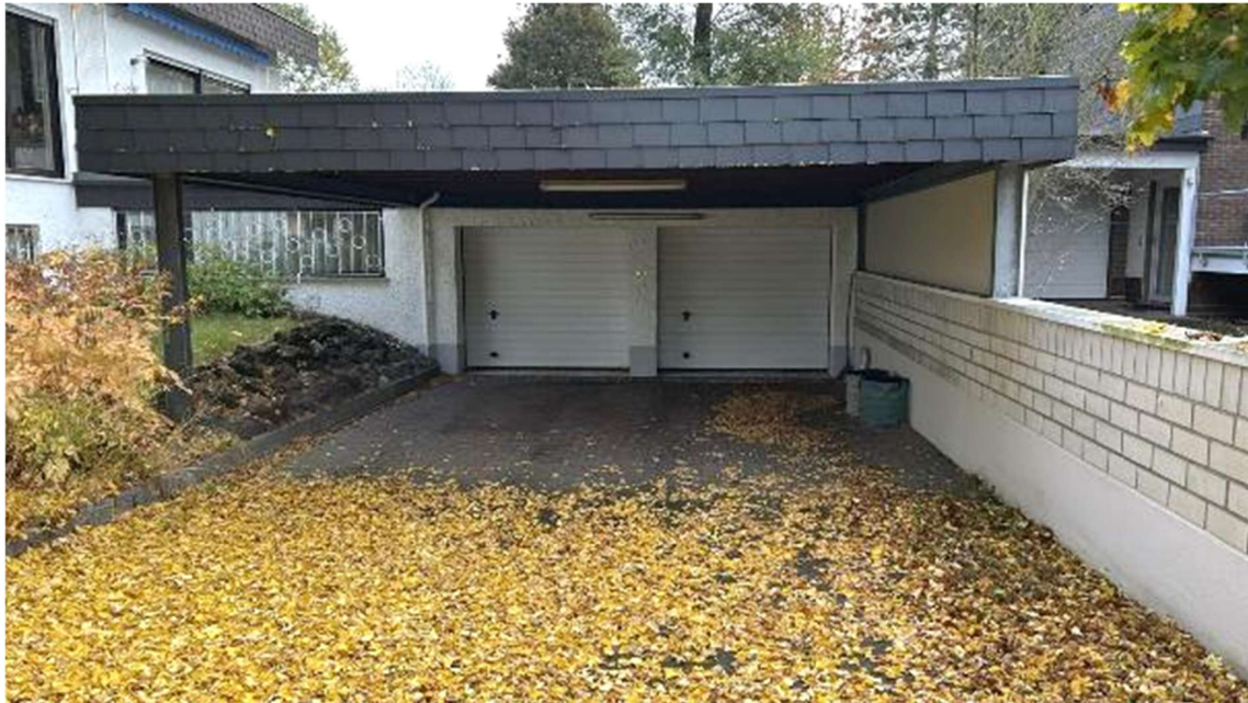
Bild B6 Doppelgarage