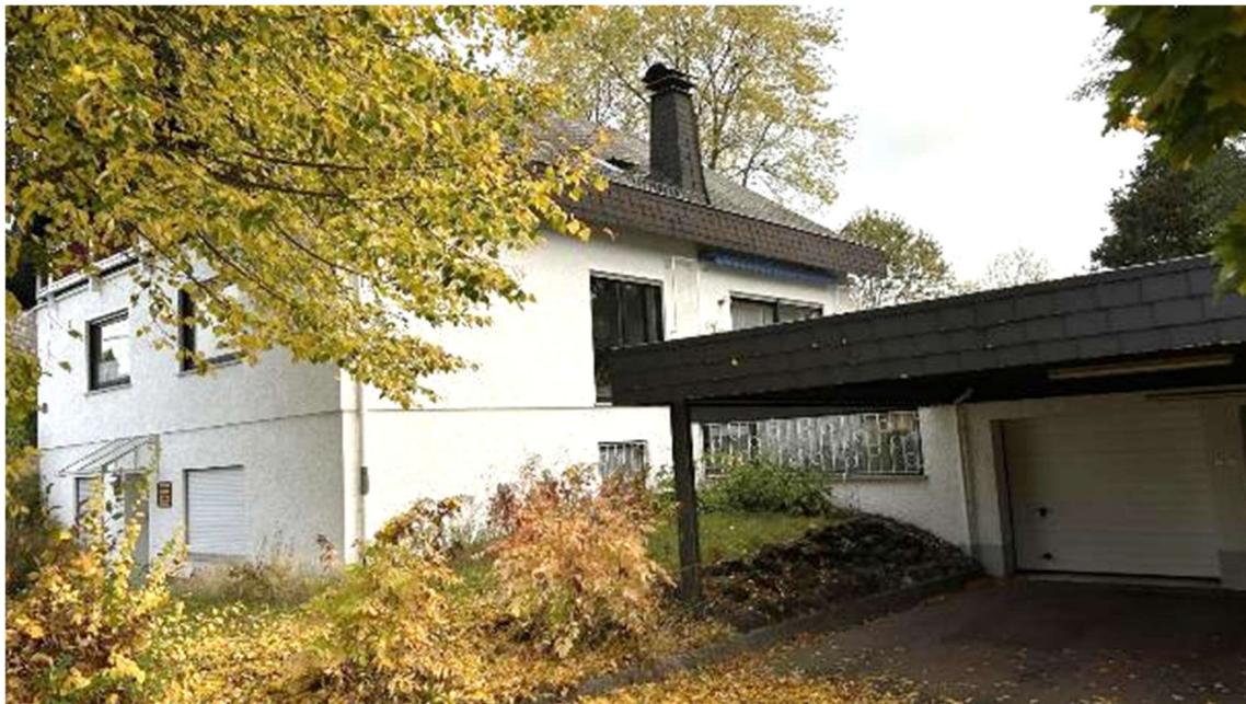
Bild B3 exemplarische Außenansicht