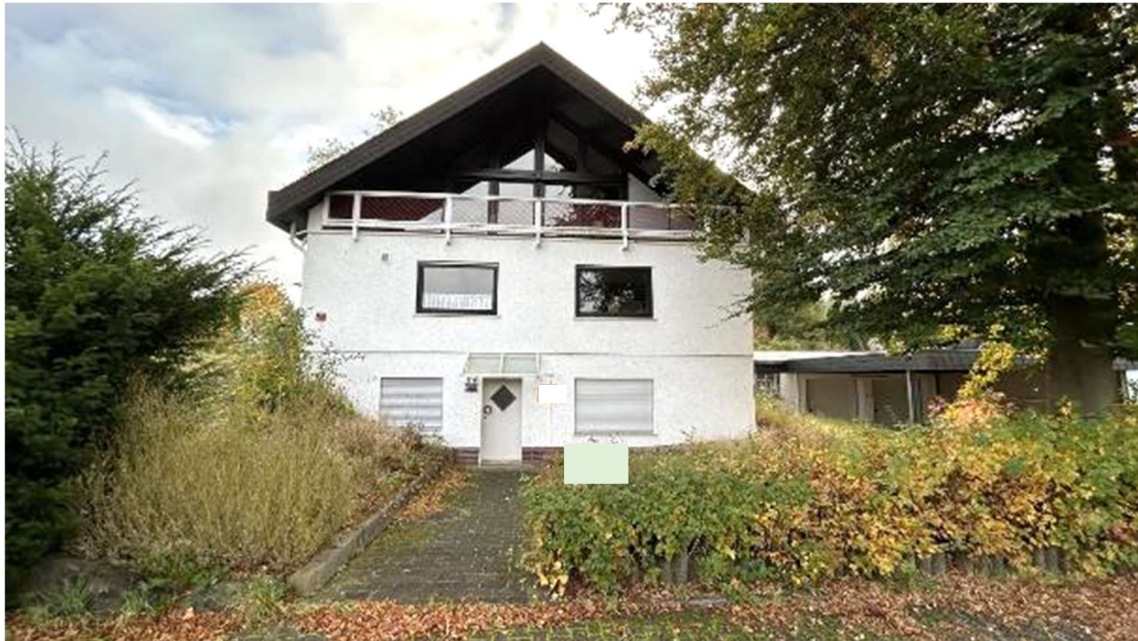
Bild B2 exemplarische Außenansicht