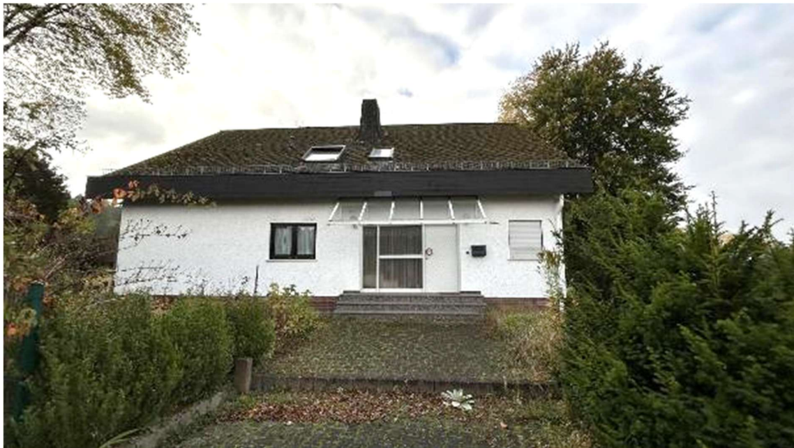
Bild B1 exemplarische Außenansicht