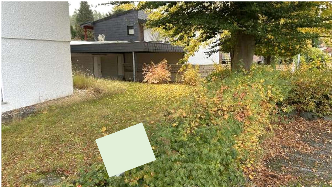
Bild B9 Grundstücksfreifläche