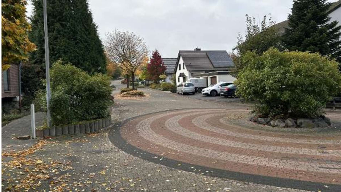
Bild A1 Erschließungssituation