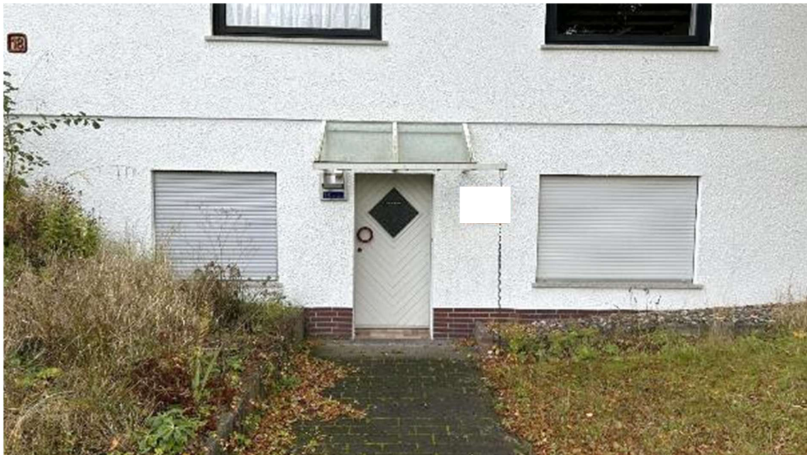
Bild B5 Hauseingänge