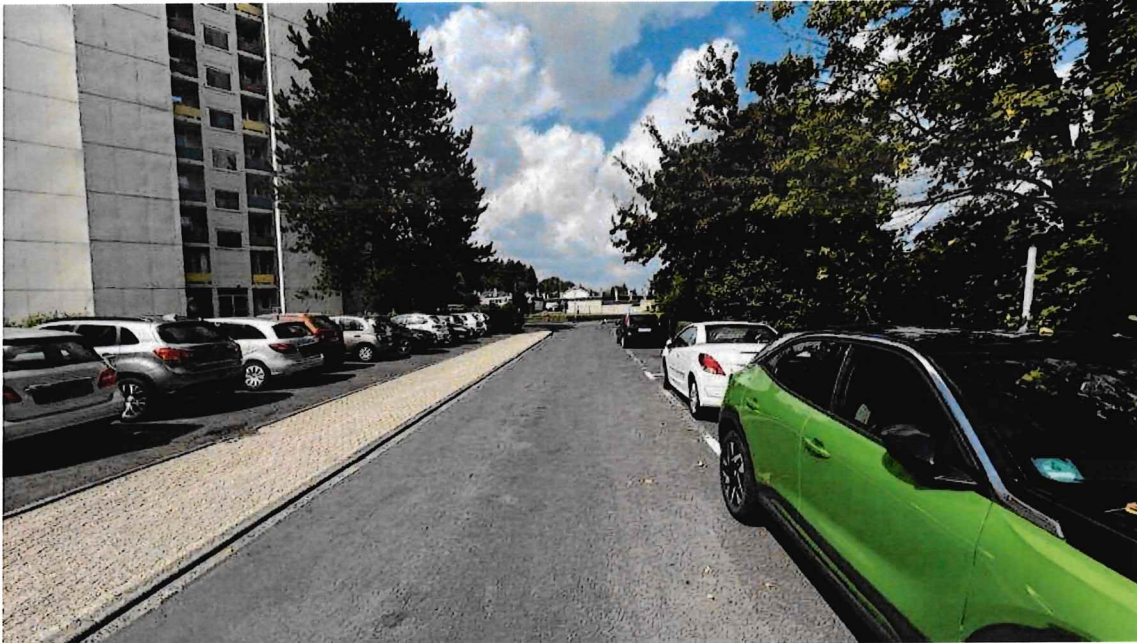
Bild A1 Blick in die Erschließungsstraße