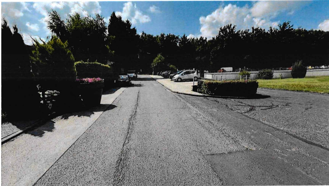
Bild A3 Blick in die Erschließungsstraße