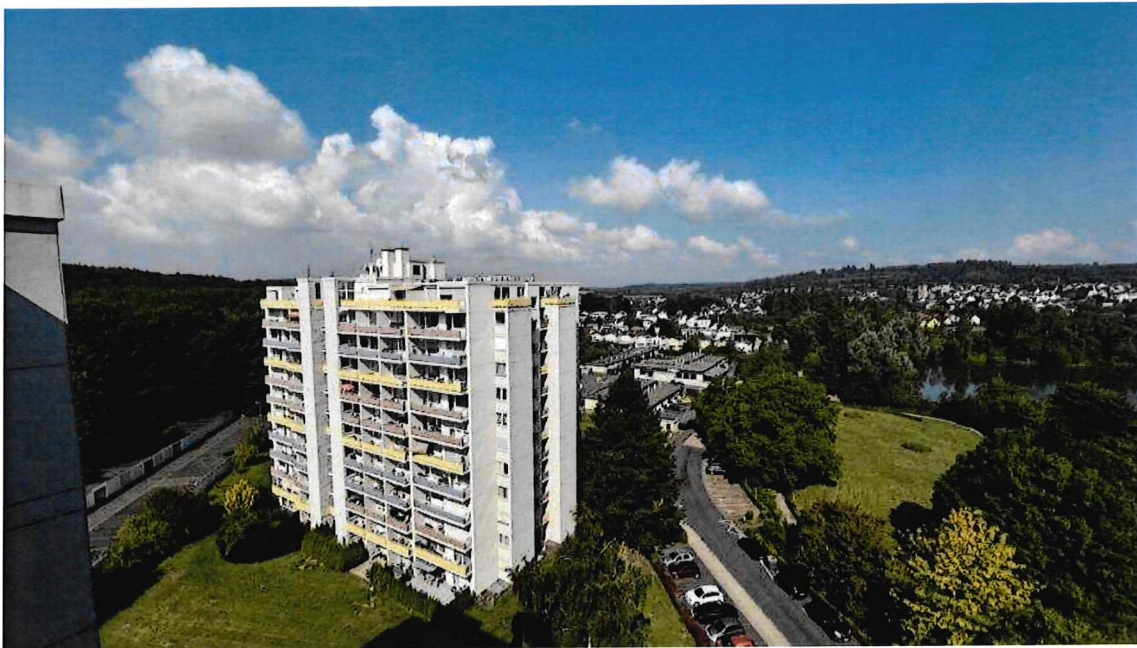
Bild A4 Umfeld / Ausblick