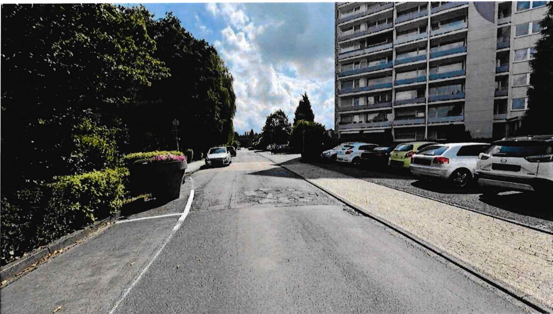
Bild A2 Blick in die Erschließungsstraße