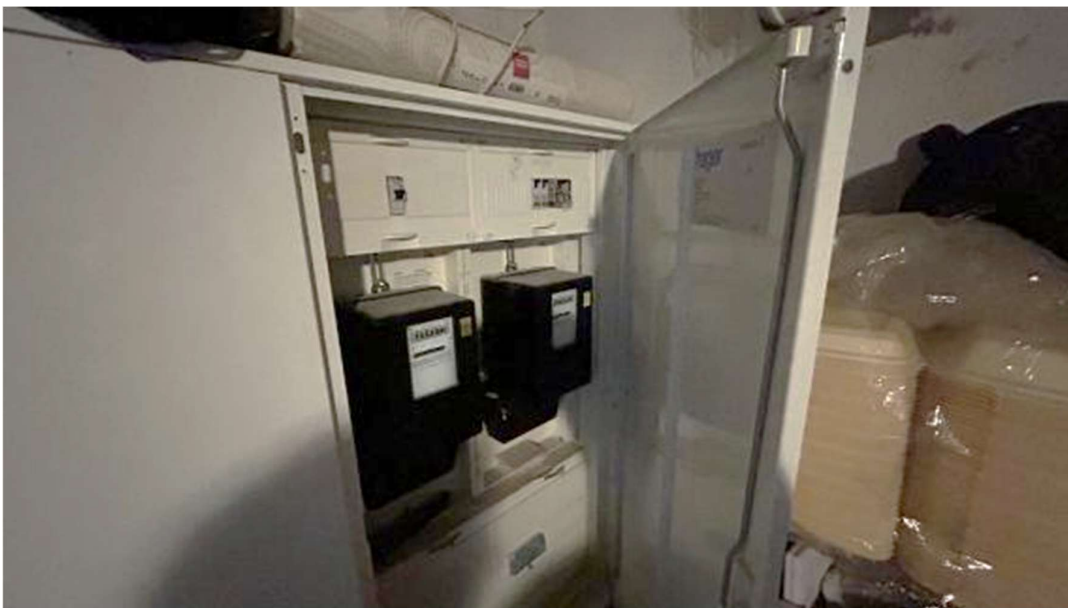
Bild C3 Beispiel Haustechnik