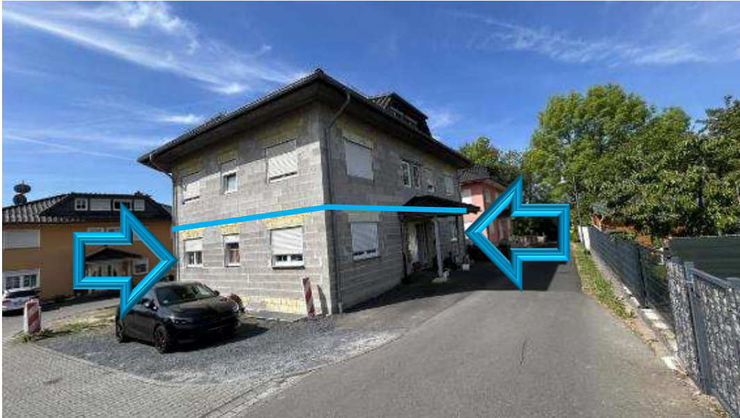
Bild B1 exemplarische Außenansicht