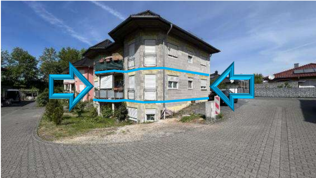
Bild B3 exemplarische Außenansicht