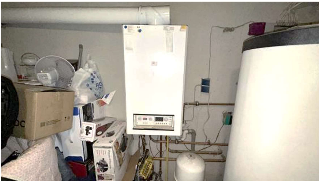
Bild C1 Beispiel Haustechnik