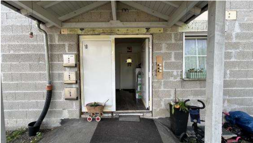
Bild B5 Gebäudeeingang