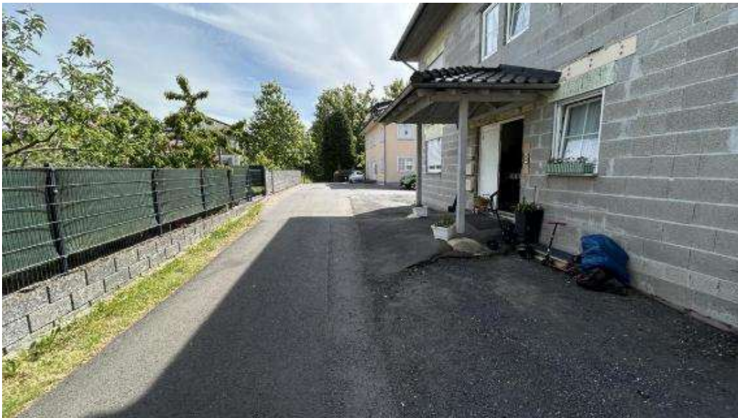
Bild A2 Erschließungssituation