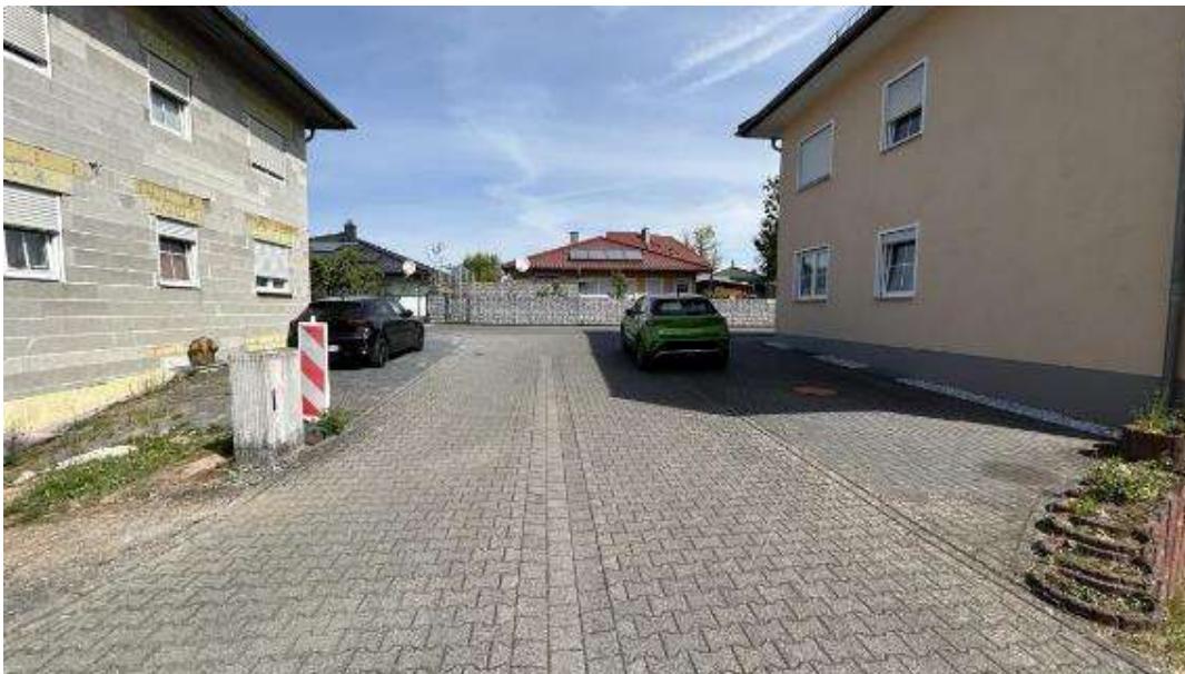
Bild A4 Erschließungssituation