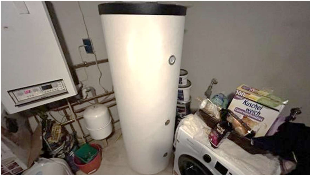
Bild C2 Beispiel Haustechnik