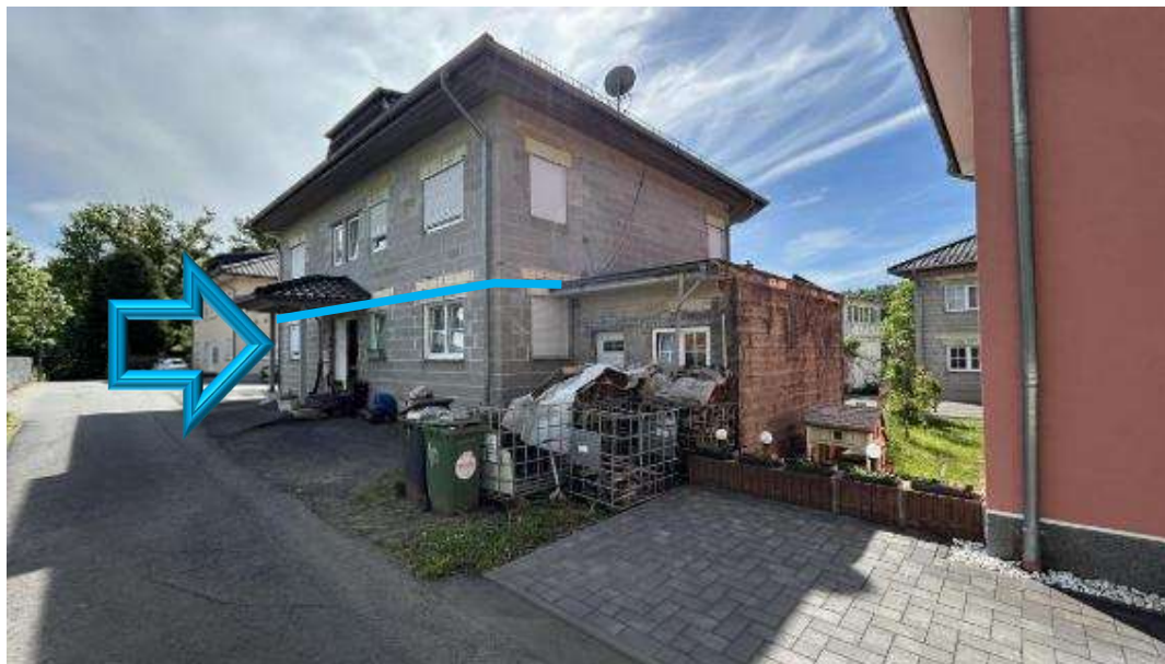
Bild B2 exemplarische Außenansicht