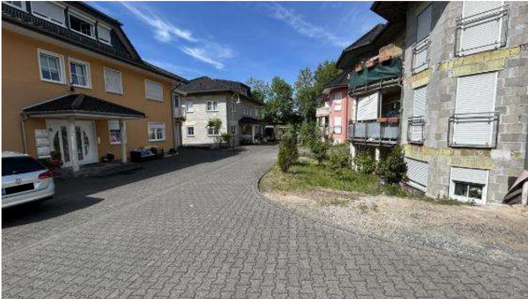
Bild A3 Erschließungssituation