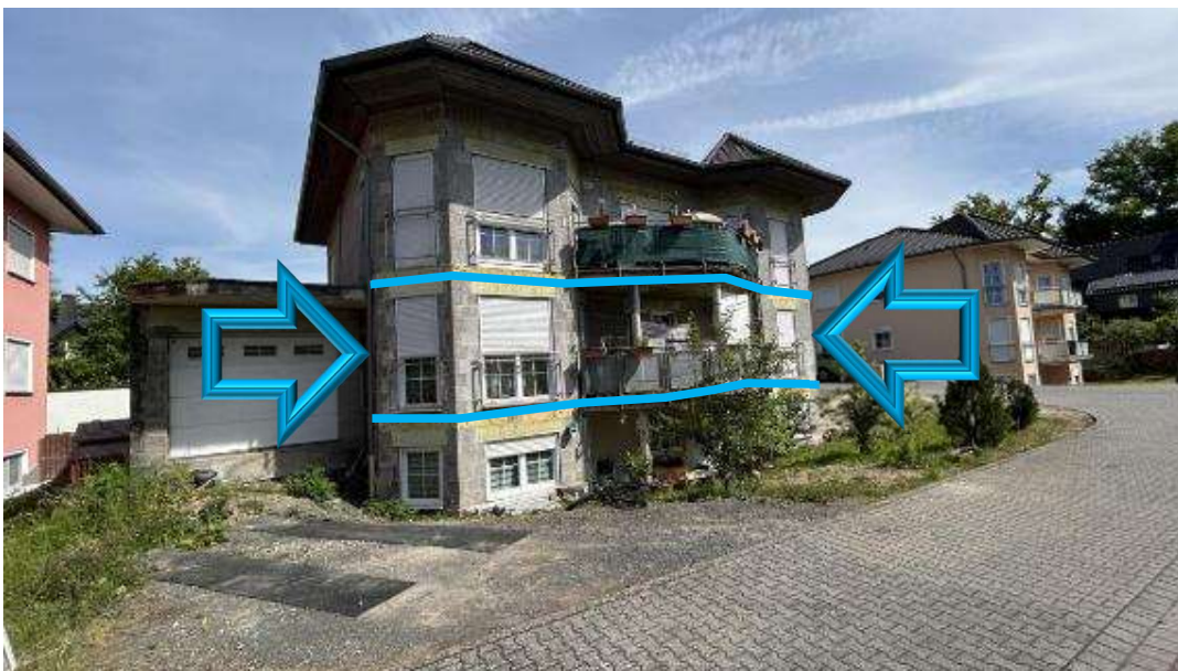
Bild B4 exemplarische Außenansicht