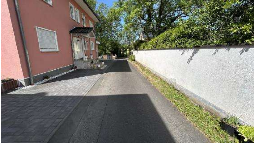
Bild A1 Erschließungssituation