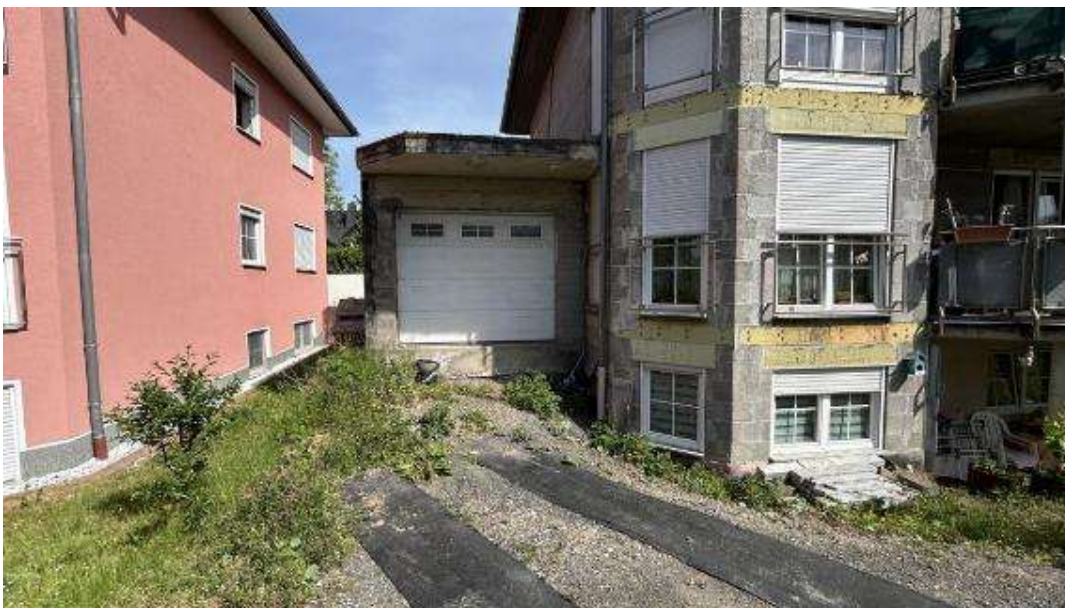
Bild B6 Garage