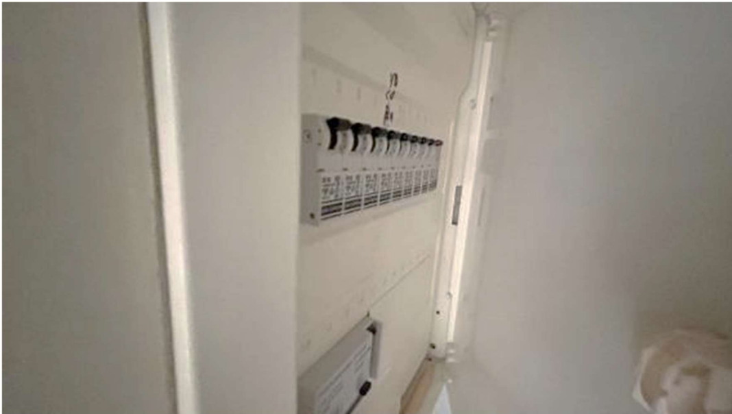
Bild C4 Beispiel Haustechnik