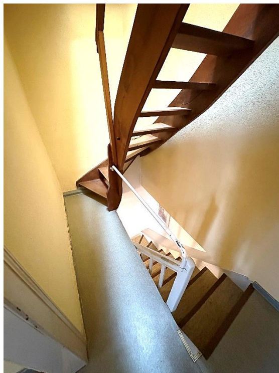
Bild 10: Treppenraum im Obergeschoss mit Zugang zum Dach- und Erdgeschoss