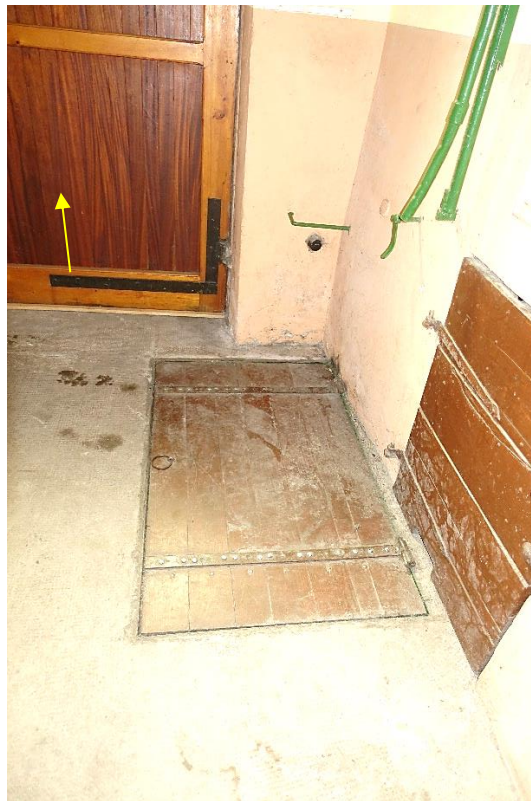
Bild 5 : Eingangsbereich zum Lagertrakt straßenseitig (Pfeil) und Bodenluke zum Keller (mittig)