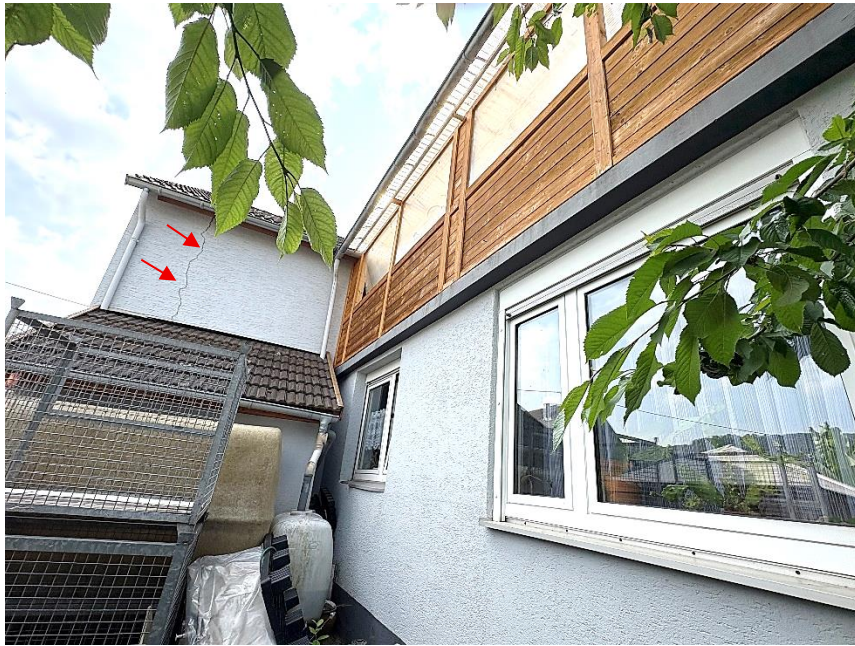
Bild 3 : starke Rissbildungen im Mauerwerk des Lagergebäudes (Pfeile)