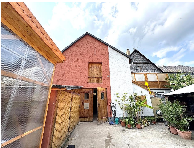
Bild 2: rückseitiger Blick auf das Lagergebäude und das Wohnhaus (Pfeil rechts)