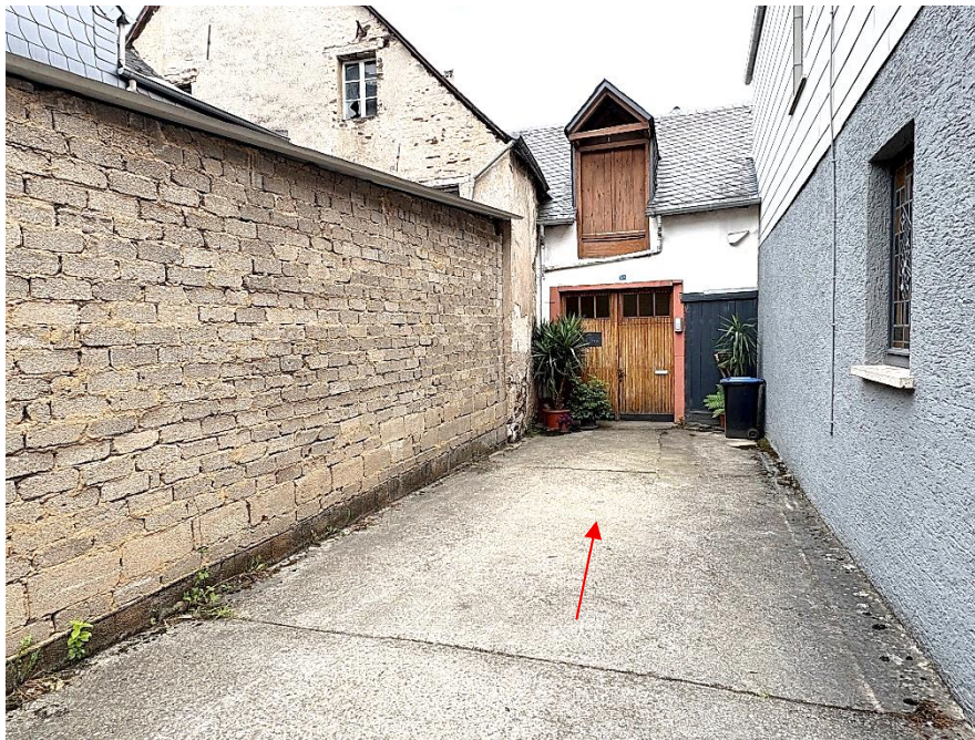
Bild 1: straßenseitige Ansicht des Bewertungsobjekts von Nordwesten mit Dienstbarkeitsfläche