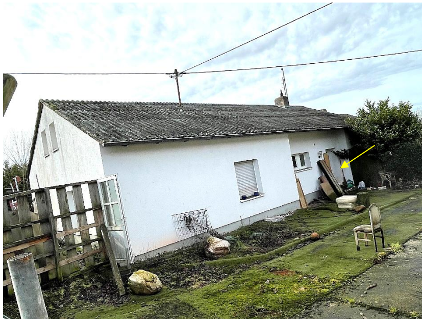
Bild 2: Blick auf das Einfamilienwohnhaus mit Haupteingang (Pfeil)