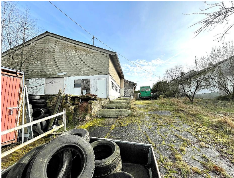
Bild 4: Blick von Westen auf die ehemalige Scheune/Stallung (links) und das Wohnhaus (rechts)