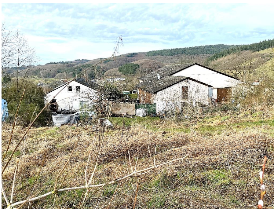
Bild 6: Wohnhaus (links) und ehemalige Scheune mit Stallung (rechts) von Südosten