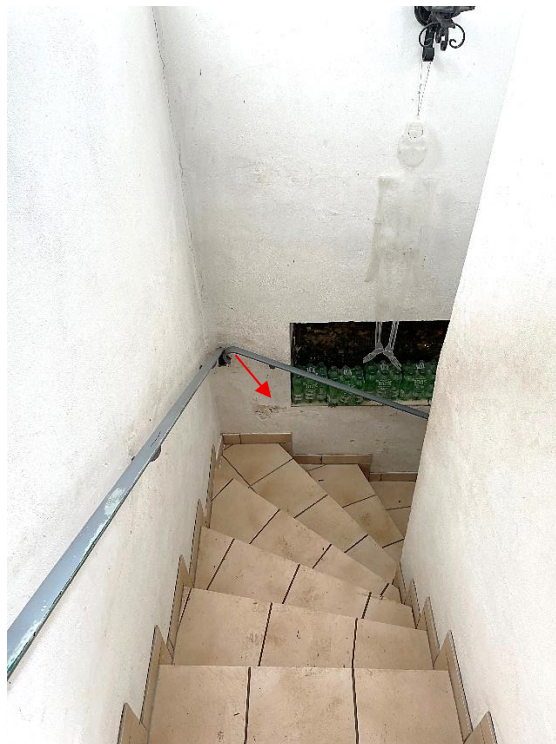
Bild 12: Treppe vom EG zum KG mit Feuchtigkeitsschäden im Außenwandbereich (Pfeil)