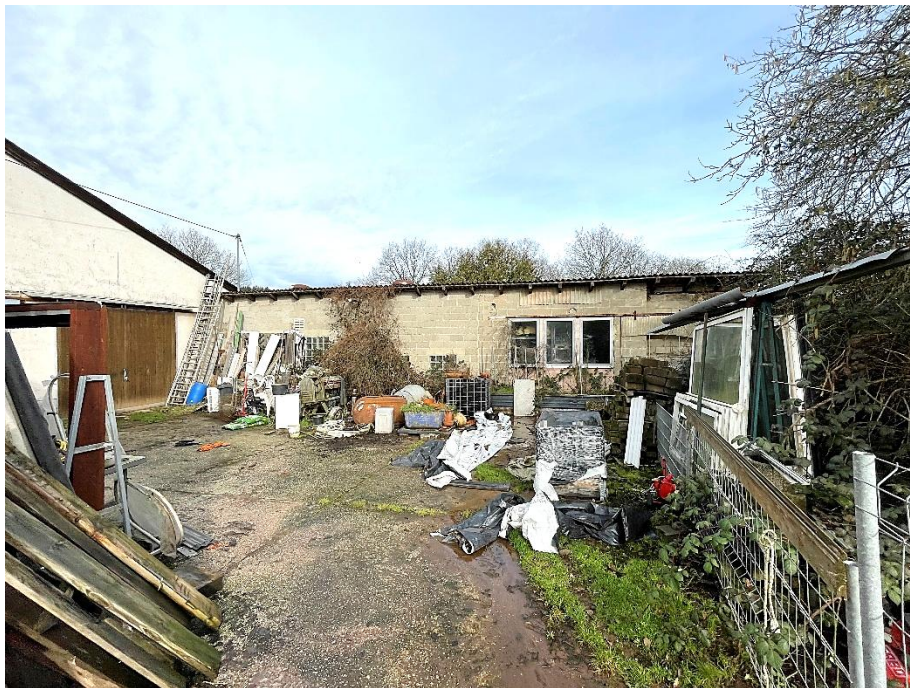
Bild 5: Blick auf ehemaligen Scheunentrakt (links) und Geräteschuppen (mittig)