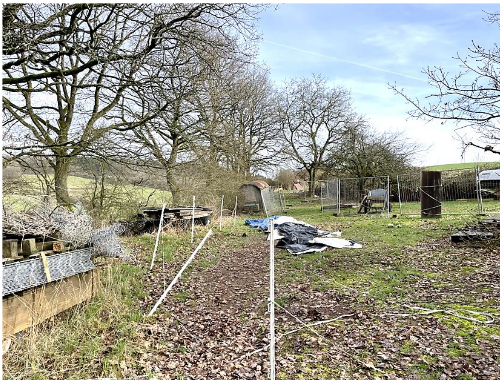
Bild 8: nordöstlicher Bereich der Grundstückseinheit von Südwesten