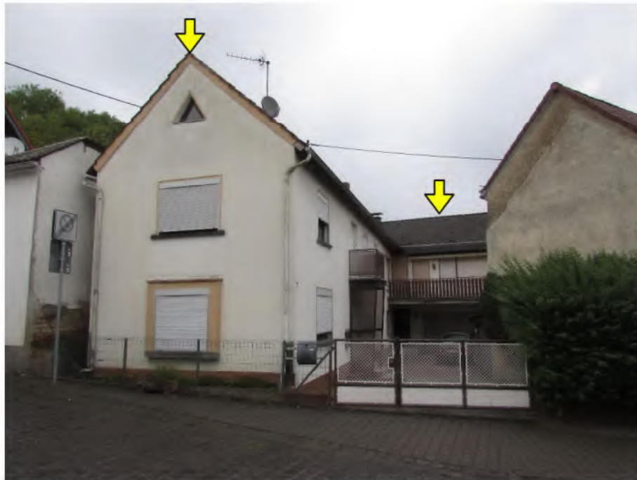
Foto 1: Flurstück 108 : Altbau/Wohnung 1 (vorne), Neubau/Wohnung 2 (hinten)