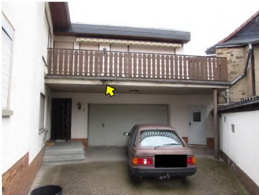
Foto 8: Hofansicht Neubau/ Wohnung 2 mit Doppelgarage 2: Feuchtigkeit im Bereich des Balkons