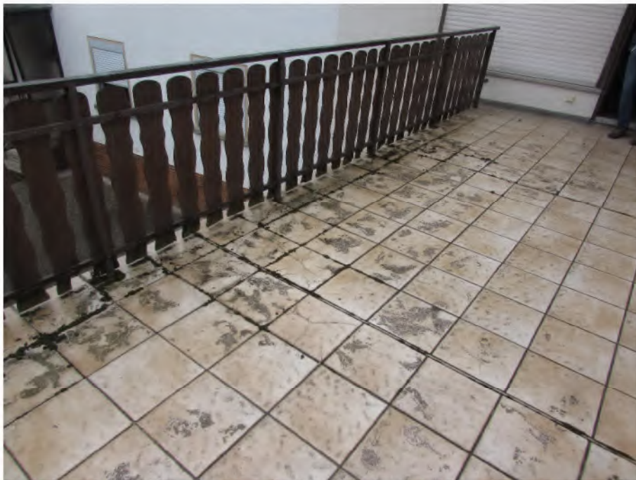
Foto 10: Wohnung 2/Neubau, Obergeschoss, Balkon: schadhafte Bodenfliesen