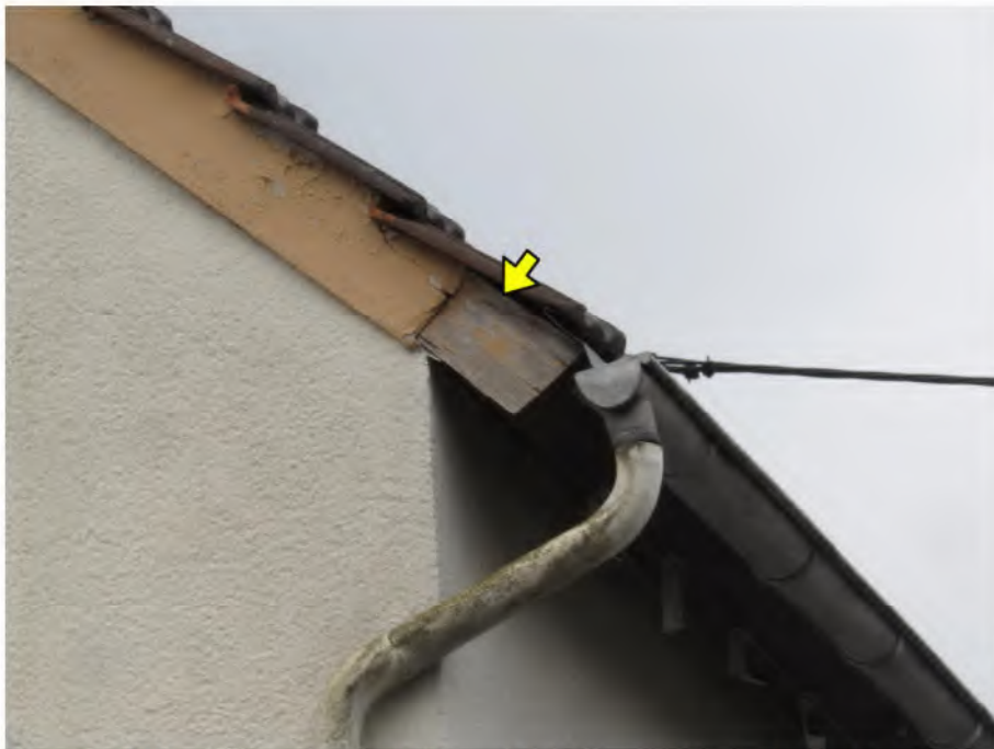
Foto 4: Altbau: verwitterte Holzverkleidung im Bereich des Ortanges