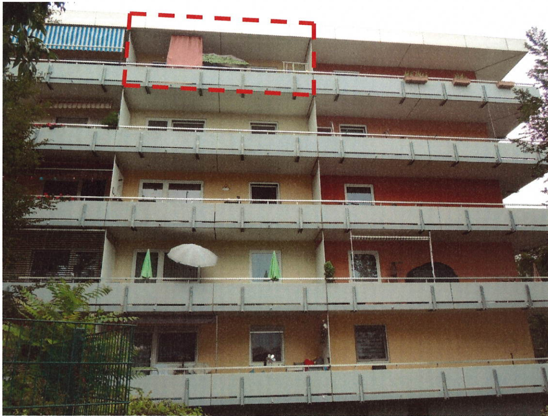
Ansicht mit Markierung der Wohneinheit