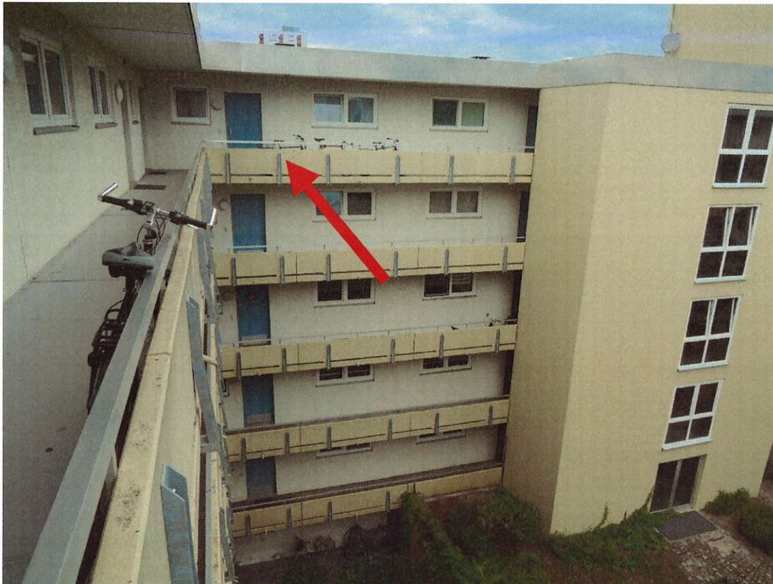
Blick auf die Wohnung