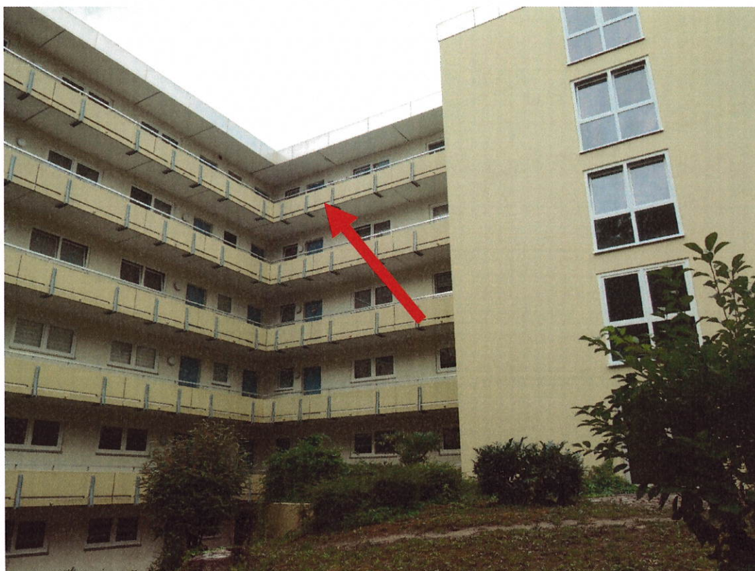
Blick auf die Wohnung