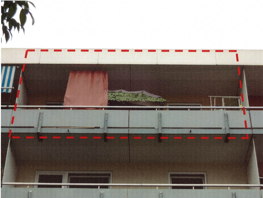
Außenansicht Mit Wohnung Markierung