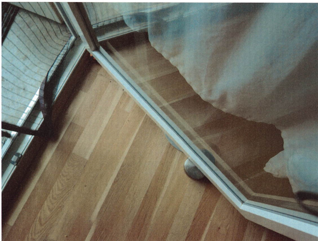
Teilansicht Balkontür und Boden