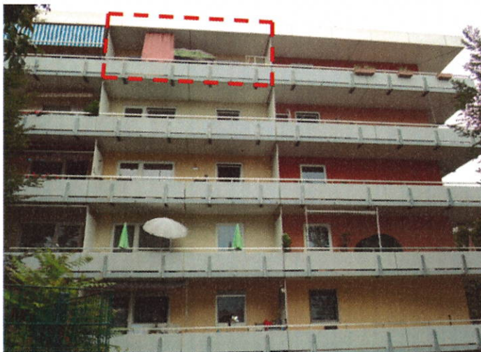
Straßenansicht (mit Wohnungsmarkierung)

verbunden mit dem Sondereigentum an der Wohnung im 4.OG, im Aufteilungsplan be- zeichnet mit Nr. 95 (nachfolgend WE 95 genannt)