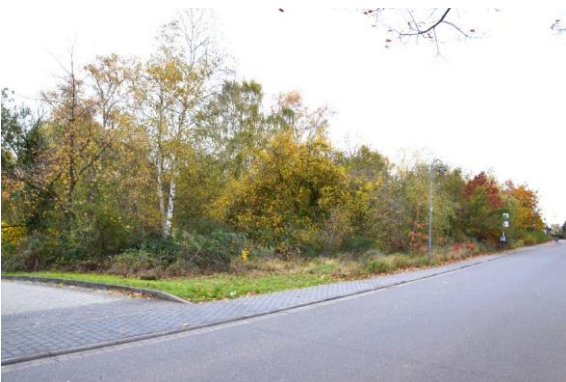
Ansicht von Südosten