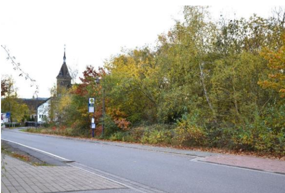
Ansicht von Nordosten

Objekt: unbebautes Grundstück, Lage: Laacher-See-Straße 56743 Mendig Nutzung: Brachland / Holzung Grundstück: Gemarkung Niedermendig, Flur 8 Flurstück 124/3 3528 m 2 Wertermittlungsstichtag: 08.11.2023