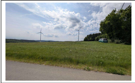
Blick auf das Bewertungsobjekt