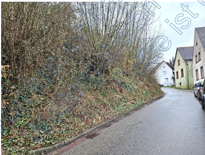
Hang zum Flurstück 193/3