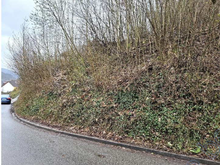
Hang zur Straße, Teil des Grundstücks 193/3