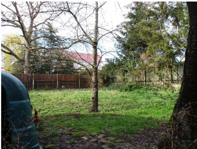
Foto Nr. 3: Ansicht hinterer Teil an der Hauptstraße von Südosten