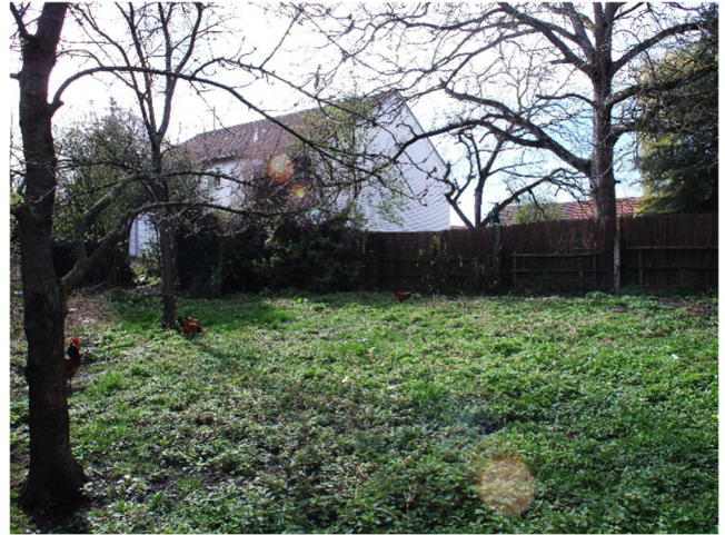
Foto Nr. 2: Ansicht mittlerer Teil an der Hauptstraße von Nordosten