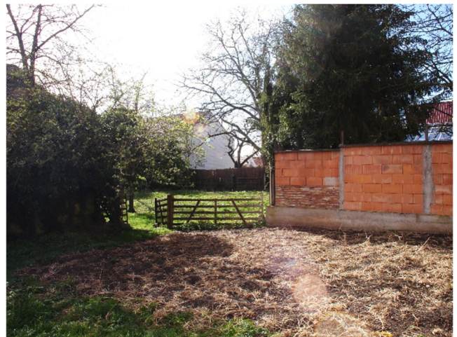
Foto Nr. 4: Ansicht hinterer Teil an der Hintergasse und Hauptstraße von Nordosten