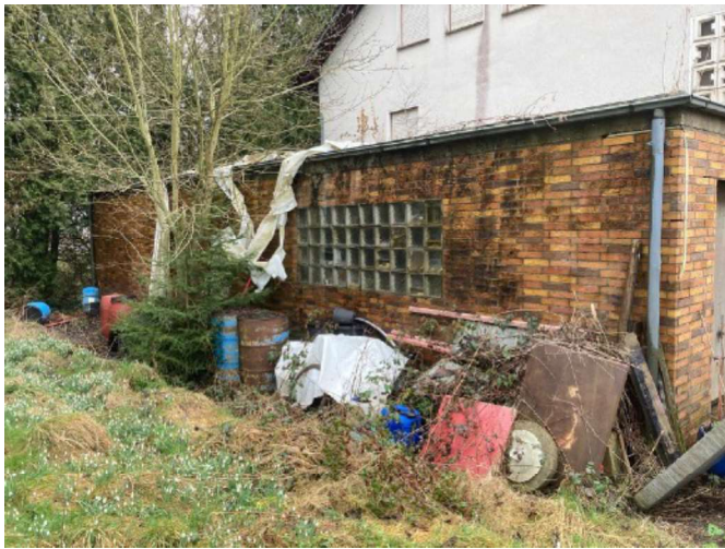
Nord-West-Seite mit Garage