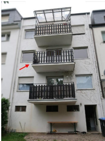
Bild 2 Außenansicht Hof/Gartenseite