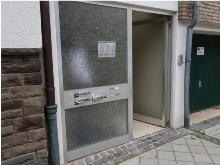
Bild 4 Hauseingang