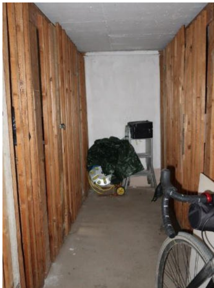
Bild 8 Innenansicht Erdgeschoss mit Kellerverschlägen (Sondernutzungsrecht / Gemeinschaftseigentum)