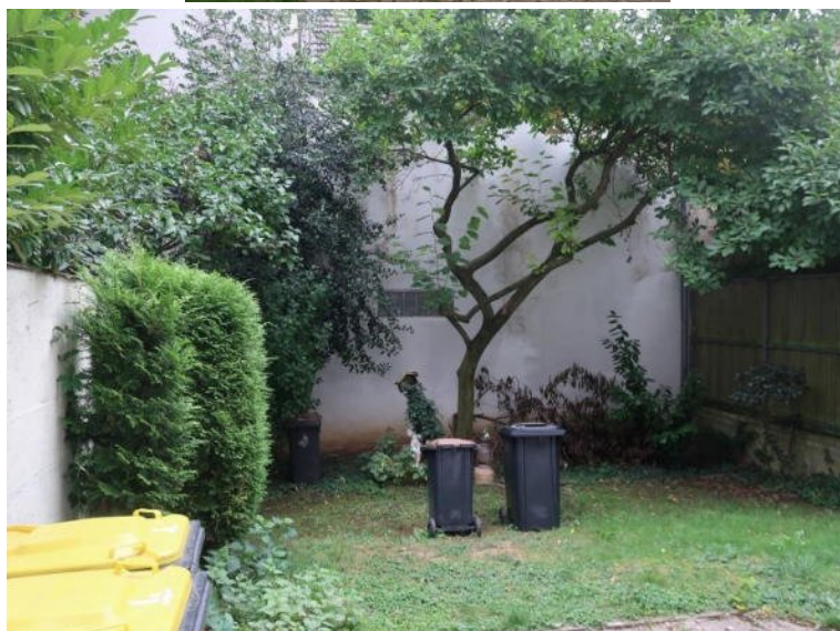
Bild 3 Außenansicht Hof/Garten