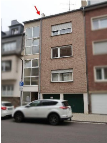
Bild 1 Außenansicht Straßenseite