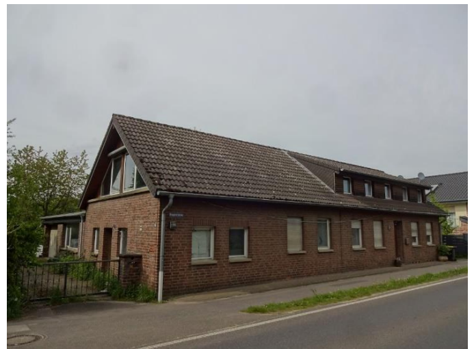
straßenseitige Ansicht Haus Nr. 159

Verkehrswert zum 29.04.2024 : 340.000,00 EURO