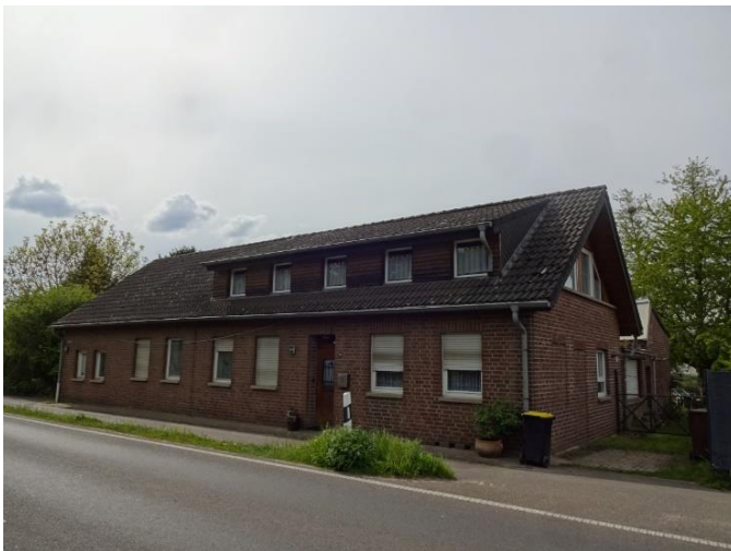
straßenseitige Ansicht Haus Nr. 160

nur nach dem äußeren Eindruck, eine Besichtigung des Objektes von innen war nicht möglich