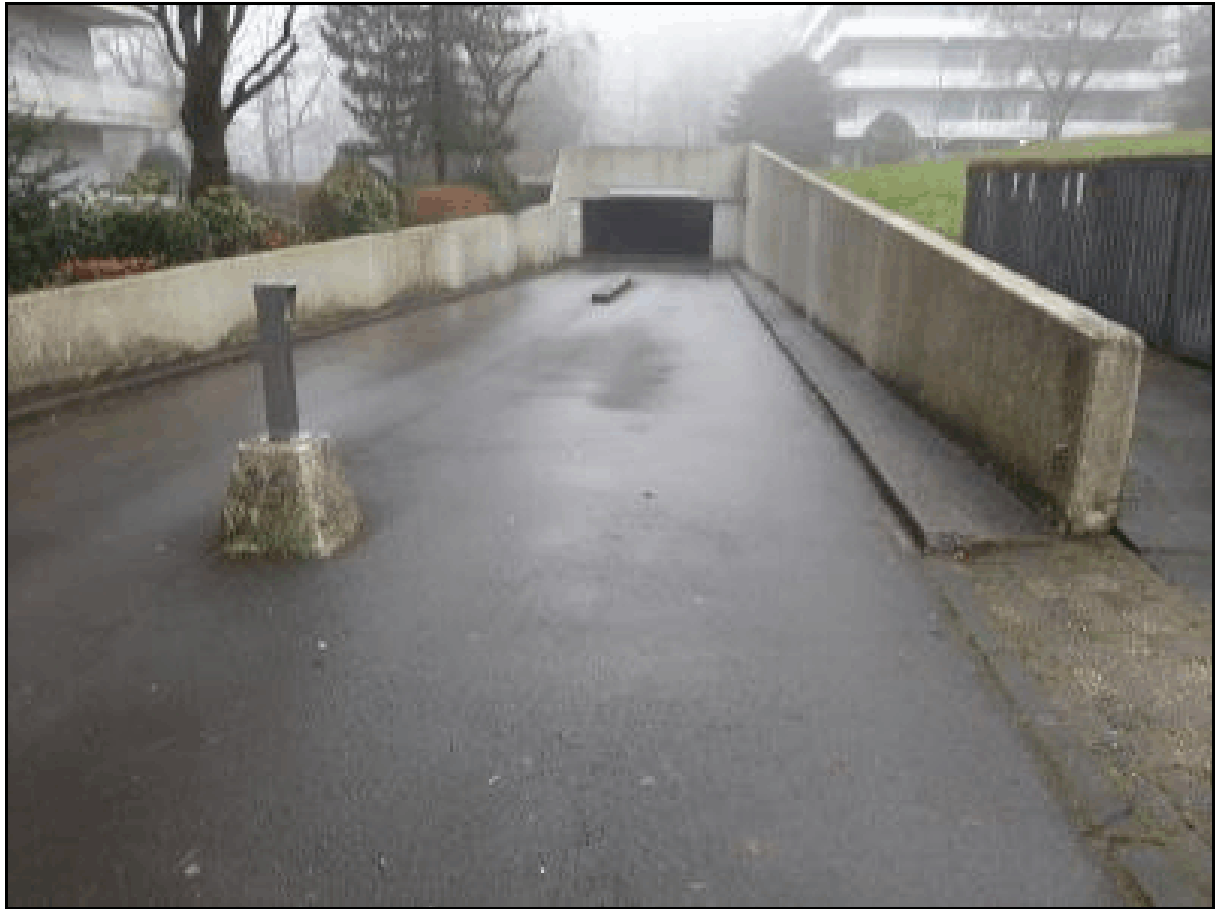
Blick auf die Tiefgarage