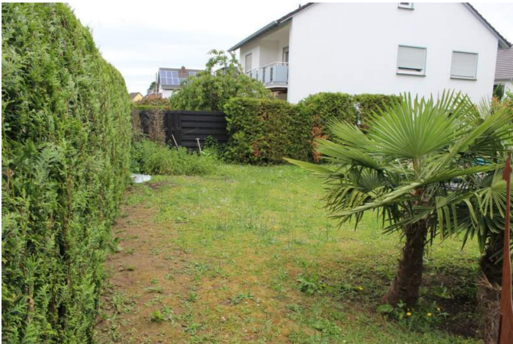
Bild 13: Flurstück 2540 (Blickrichtung angrenzendes Flurstück 2539)