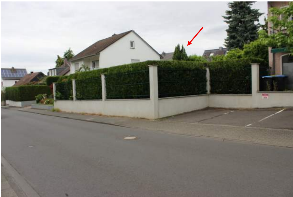
Bild 1: Straßen-Ansicht (Süd-Ansicht): Gemarkung Holzlar, Flur 6, Flurstück 2540