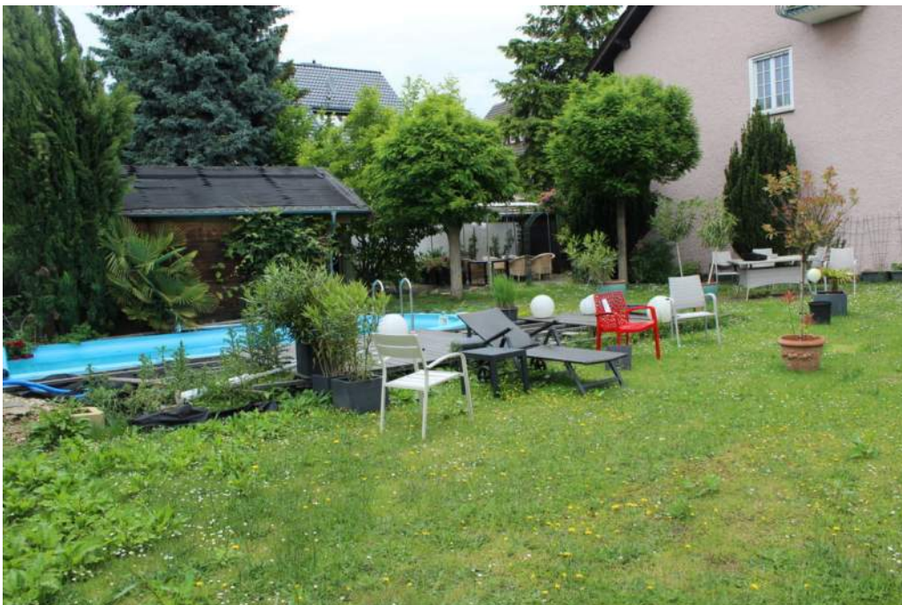
Bild 12: Flurstück 2540 (Blickrichtung angrenzendes Flurstück 2519)