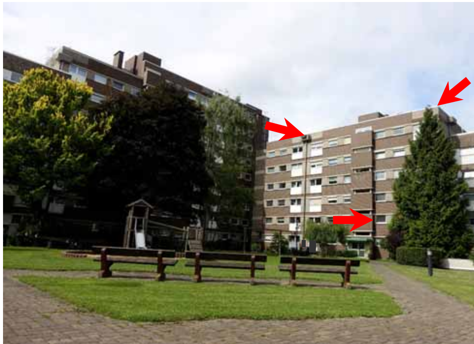
Zuwegung zu den Mehrfamilienhäusern „Bonnstraße 10-14“, Wohnung Nr. 3 im 1. Obergeschoss rechts des Hauses „Bonnstraße 10“