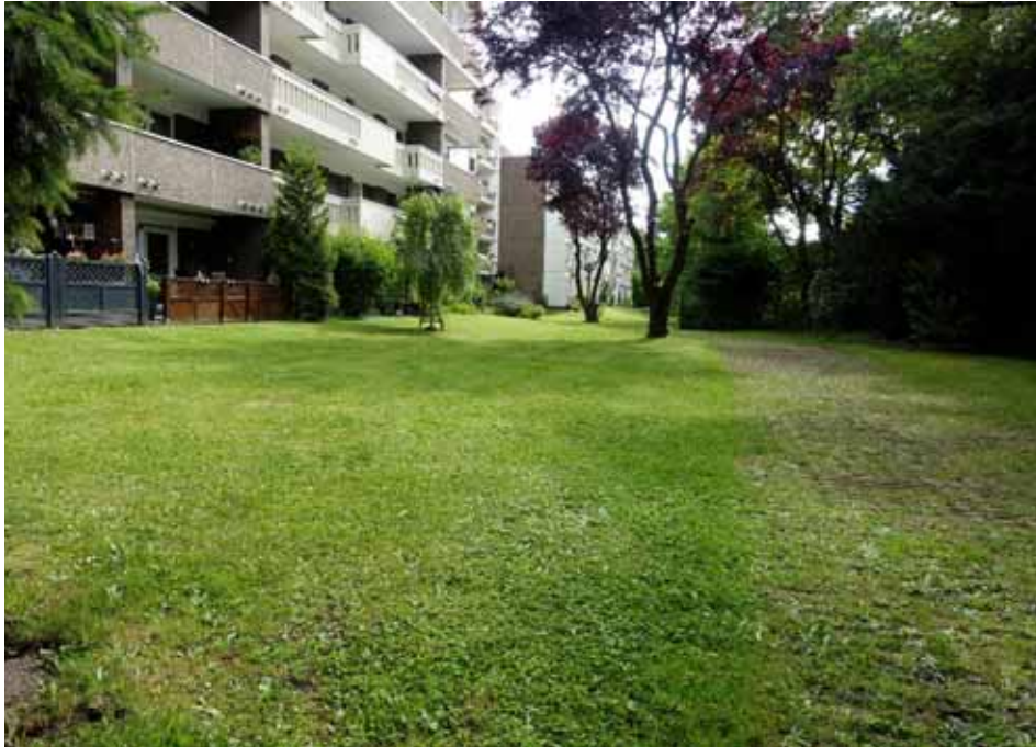
Garten im westlichen Bereich des Grundstücks