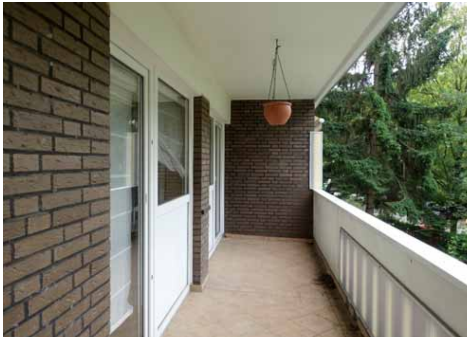
Balkon der Wohnung Nr. 3