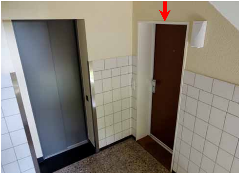
Eingangstür der Wohnung Nr. 3