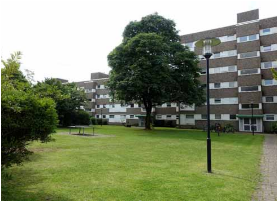
Zuwegung zu den Häusern „Bonnstraße 16-22“