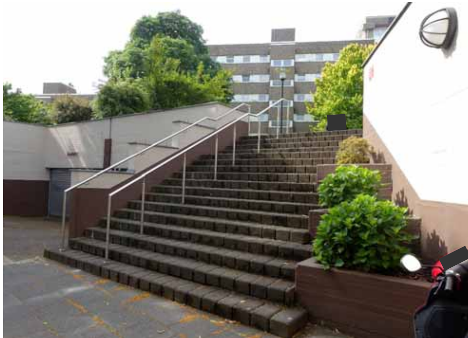
seitlich der Garagenzufahrt befindliche, von der Bonnstraße aus zum begehbaren Flachdach der Sammelgarage bzw. zu den Eingängen der Mehrfamilienhäuser „Bonnstraße 10-22“ führende Außentreppe