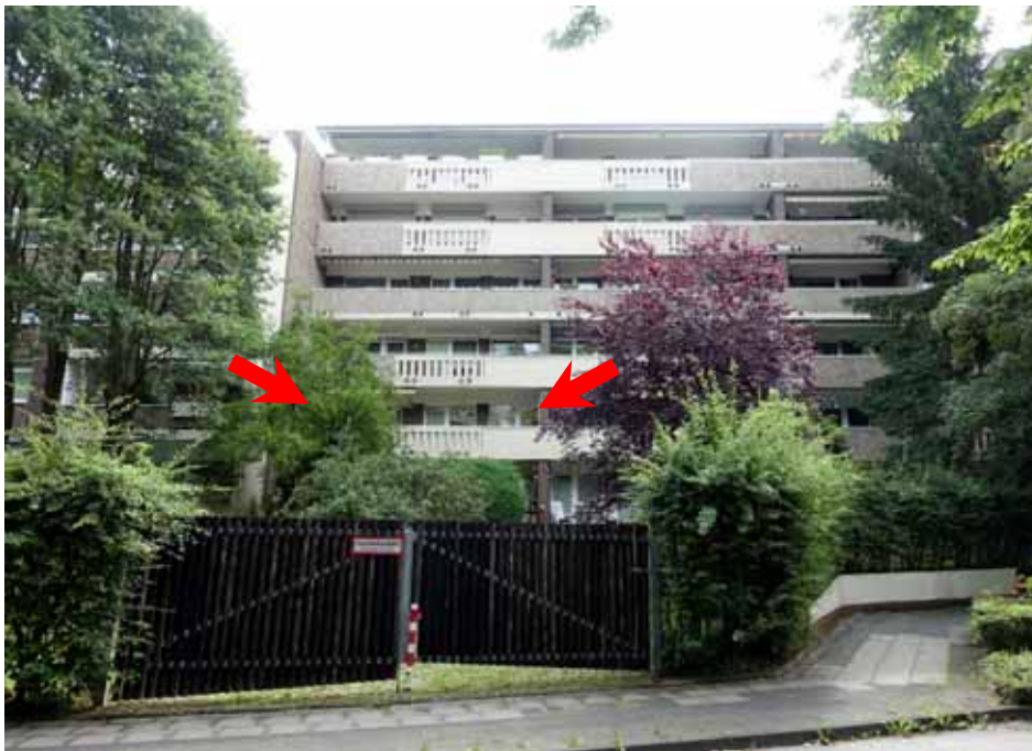
Rückansicht des Hauses „Bonnstraße 10“, Wohnung Nr. 3