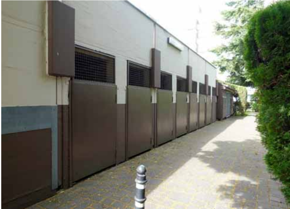
Räume für die Müllbehälter seitlich der Sammelgarage