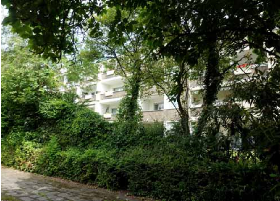
Rückansicht der Gebäude, Blick vom Villering aus