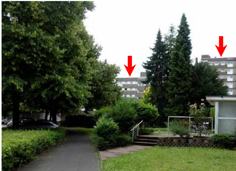
Bonnstraße, Blick Richtung Süden, Mehrfamilienhäuser „Bonnstraße 6-22“