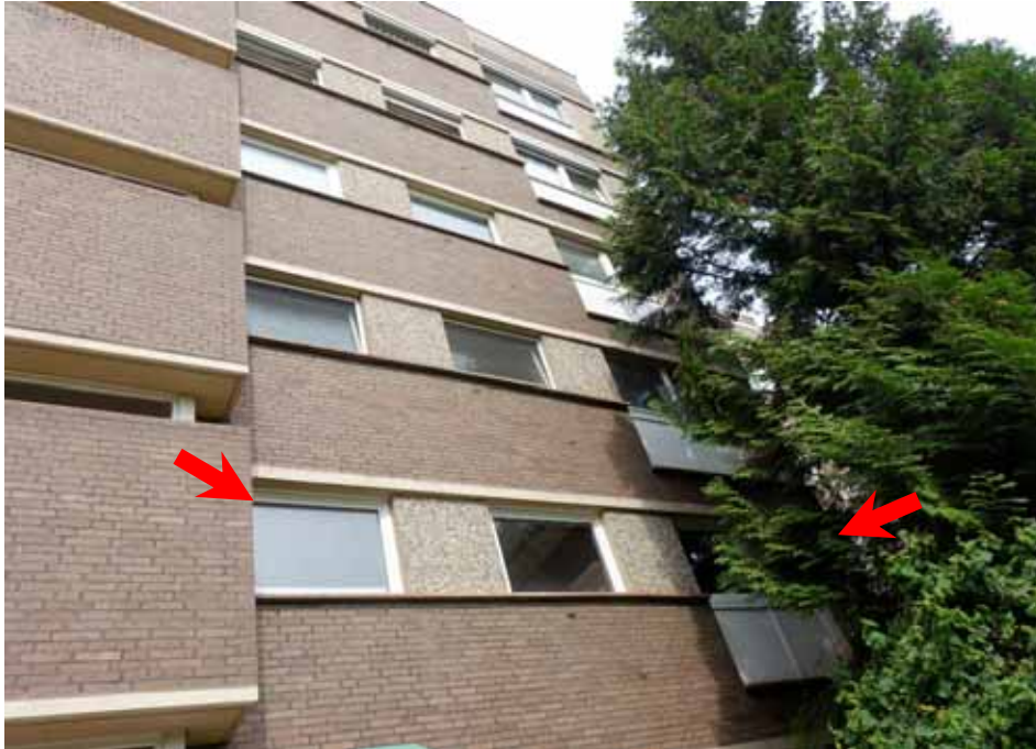
Wohnung Nr. 3 im 1. Obergeschoss rechts des Hauses „Bonnstraße 10“