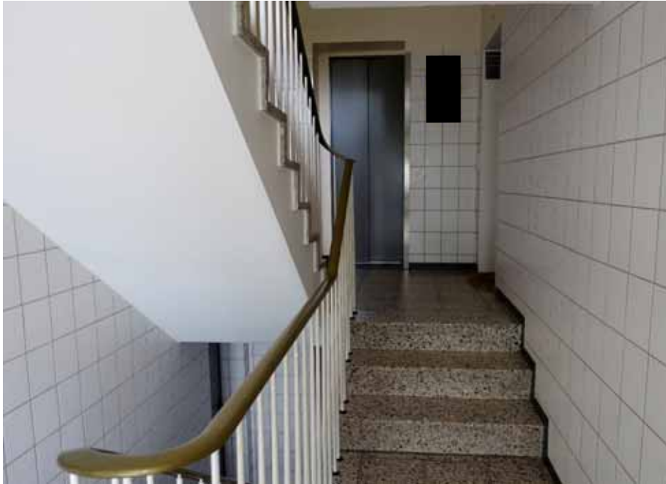
Eingangsbereich des Hauses „Bonnstraße 10“