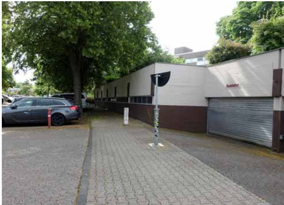
Bonnstraße, Blick Richtung Südosten, Straßenansicht der Sammelgarage