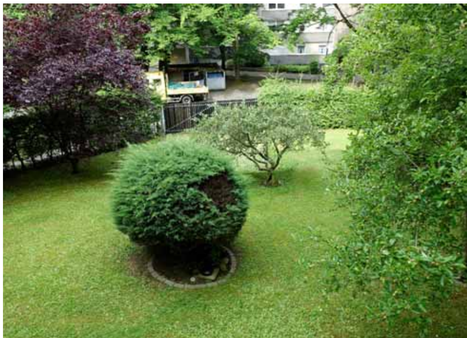
Blick vom Balkon Richtung Westen