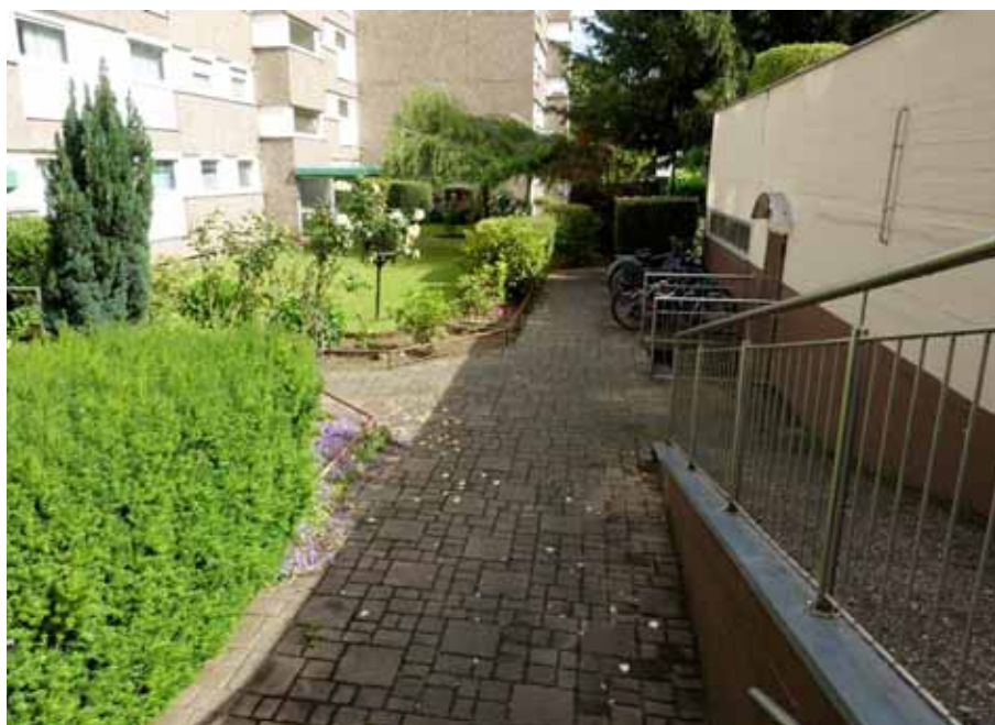
Zuwegung zu den Mehrfamilienhäusern „Bonnstraße 6-8“