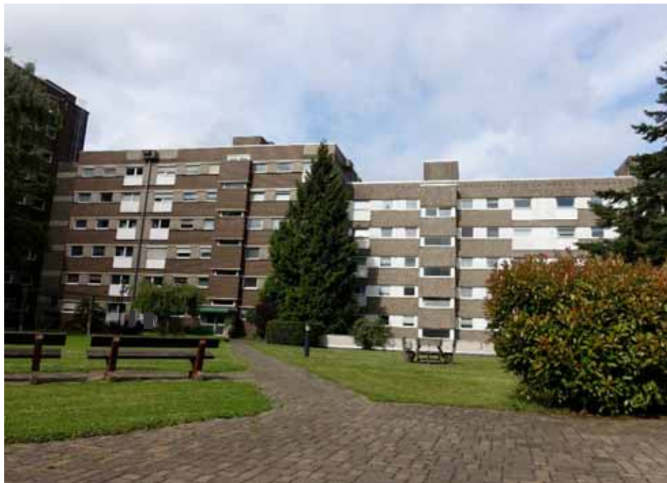
Gartenanlage auf der Ebene des Garagendaches