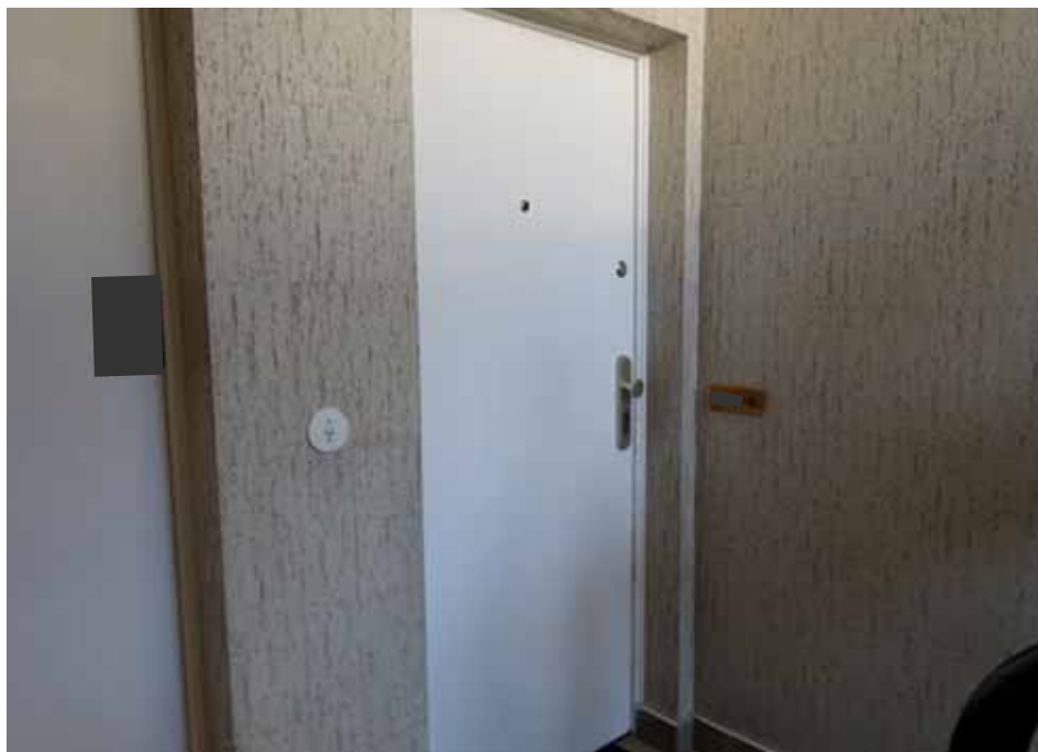
Eingangstür der Wohnung Nr. 8