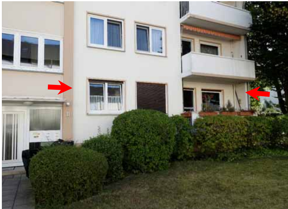
Mehrfamilienhaus „Mertener Straße 11“, Frontansicht, Wohnung Nr. 8