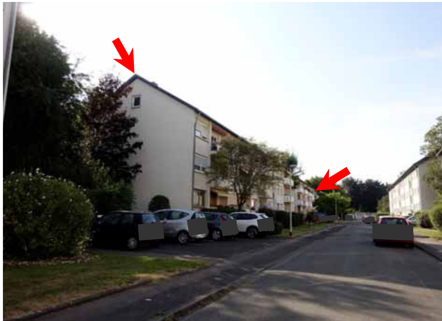
Mertener Straße, Blick Richtung Südosten, Mehrfamilienhäuser „Mertener Straße 5, 7, 9, 11“