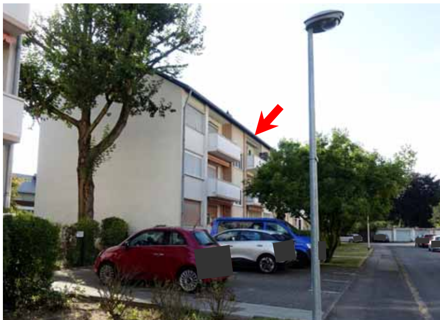
Mehrfamilienhäuser „Mertener Straße 9, 11“