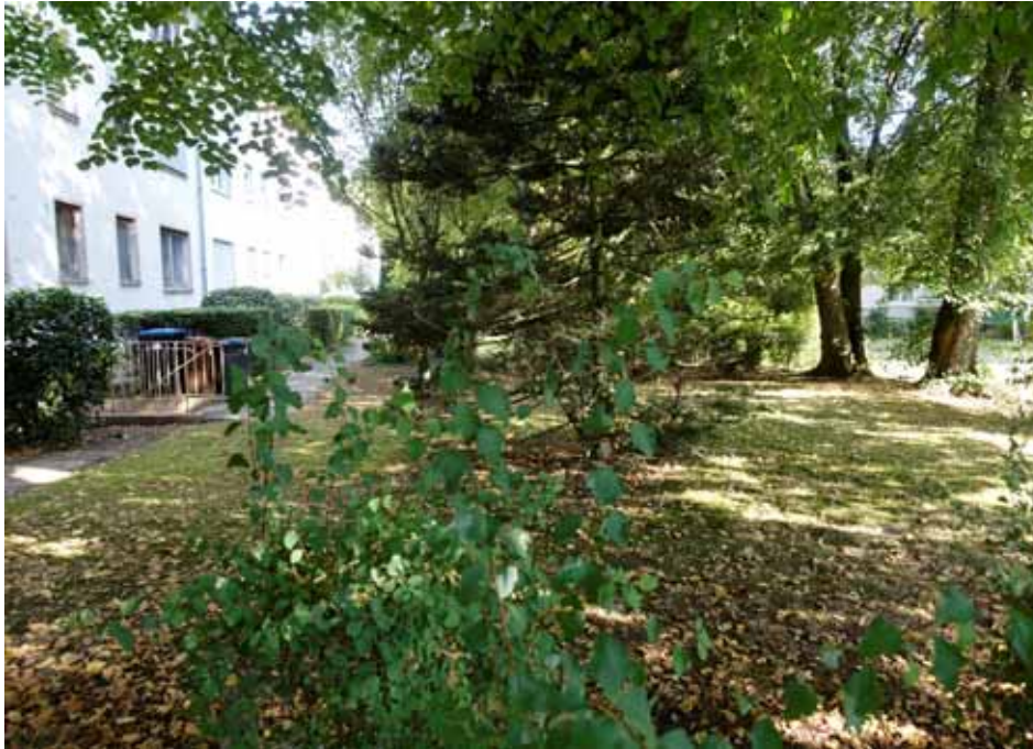
Garten im rückwärtigen Grundstücksbereich