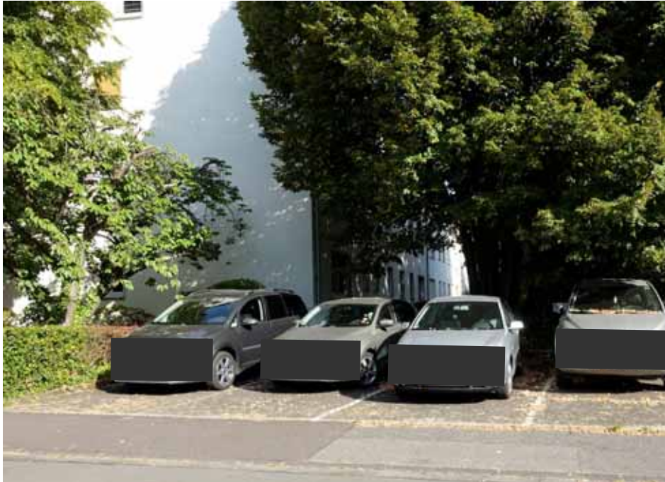
Seiten-/ Rückansicht des Mehrfamilienhauses „Mertener Straße 11“, Blick von der Hubert-Geuer-Straße aus