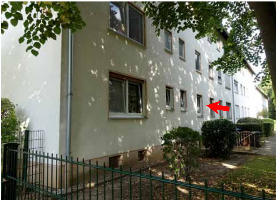
Wohnung Nr. 8