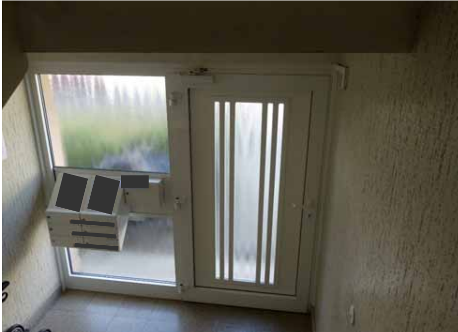
Eingangsbereich des Mehrfamilienhauses „Mertener Straße 11“