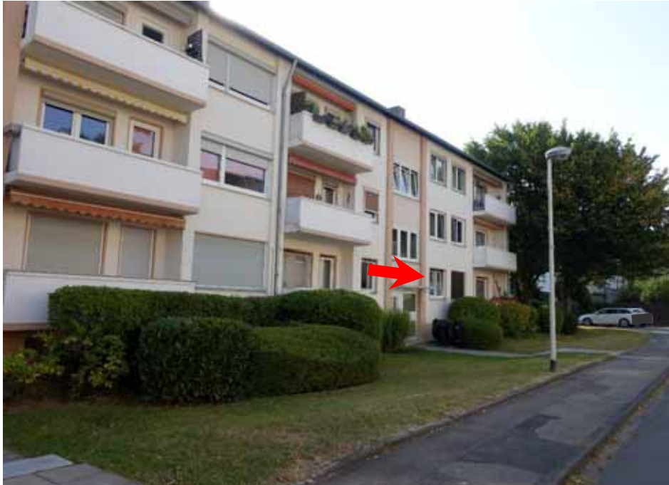
Mehrfamilienhaus „Mertener Straße 11“, Wohnung Nr. 8 im Erdgeschoss rechts