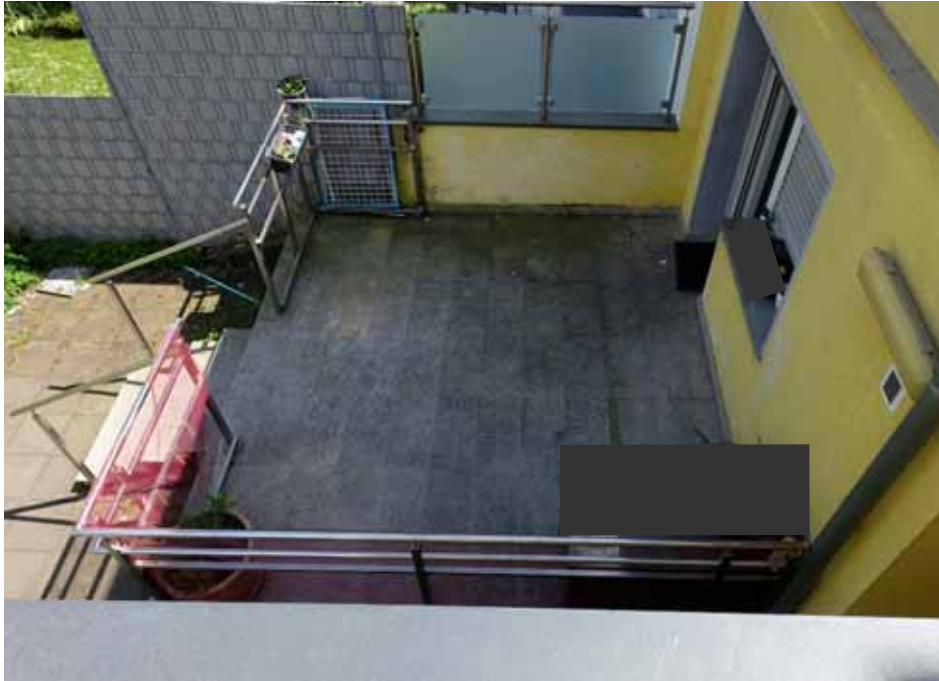
Terrasse der Erdgeschosswohnung