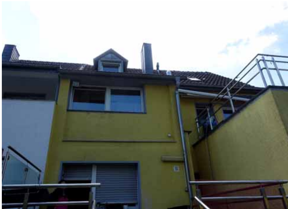
Rückansicht des Haupthauses