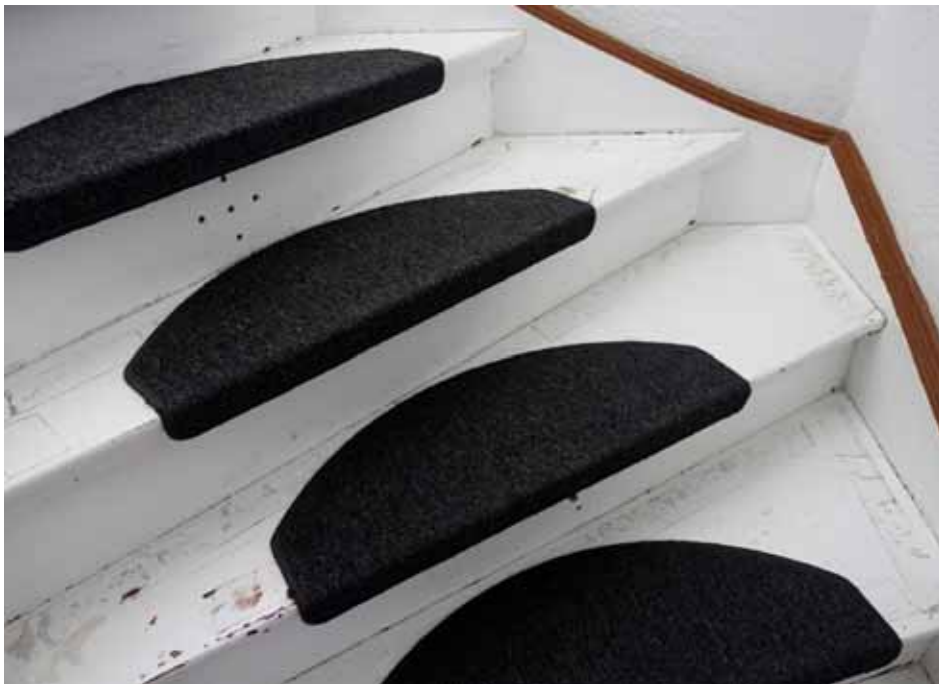
zum Obergeschoss führende Treppe