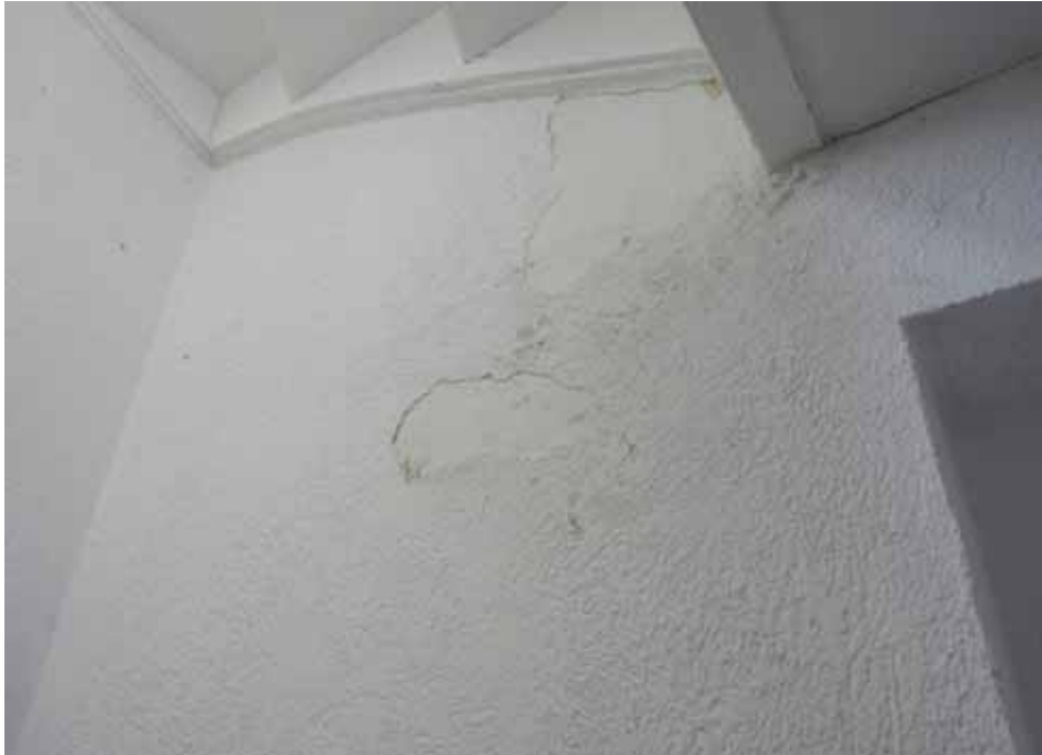
beschädigte Wandputz im Treppenhaus