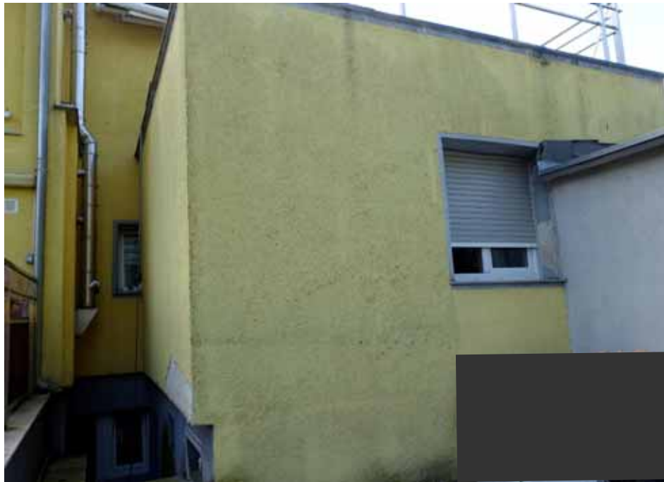
stellenweise beschädigte Fassade des Anbaus