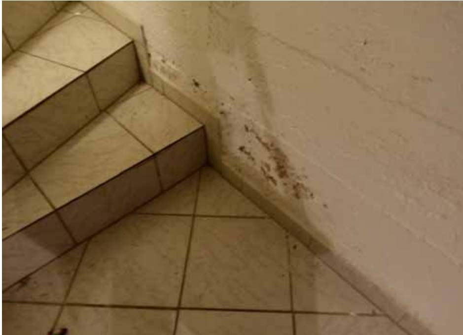
Feuchtigkeitsschäden im Bereich der Kellerwände