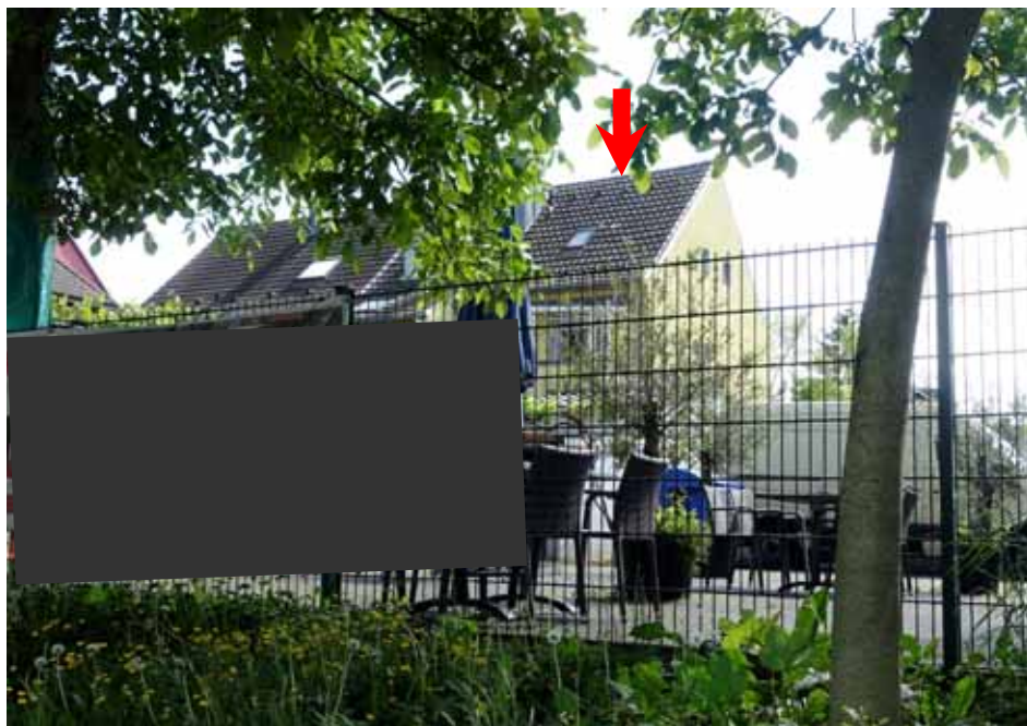
Blick von der rückwärtig angrenzenden Elsässer Straße aus