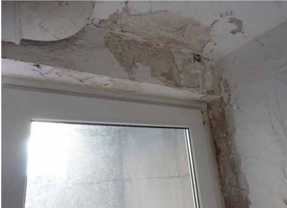
Feuchtigkeitsschäden im Bereich der Kelleraußentür