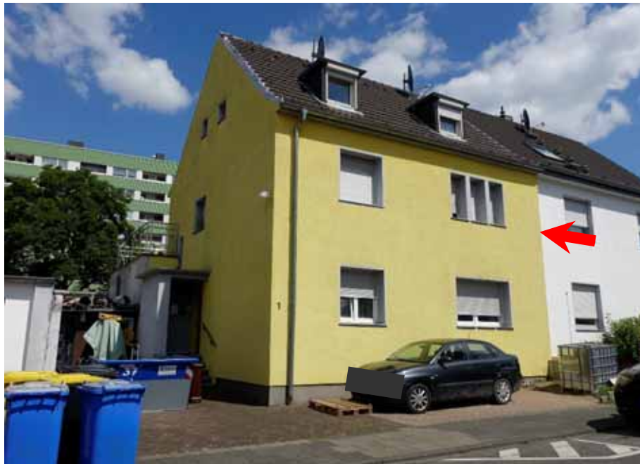
Zweifamilien-Doppelhaushälfte „Saarlandstraße 1“