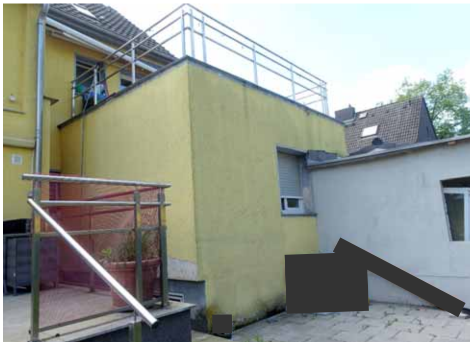
Rück-/ Seitenansicht des Anbaus, Seitenansicht des Nebengebäudes