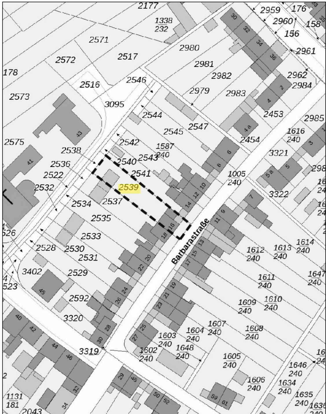
Auszug aus der Flurkarte

Anlage zum Gutachten Reg. - Nr. 24.316 Amtsgericht Brühl, AZ: 141 K 7 / 24 Teilungsversteigerungssache Barbarastraße 16, 50354 Bergheim (Gleuel)