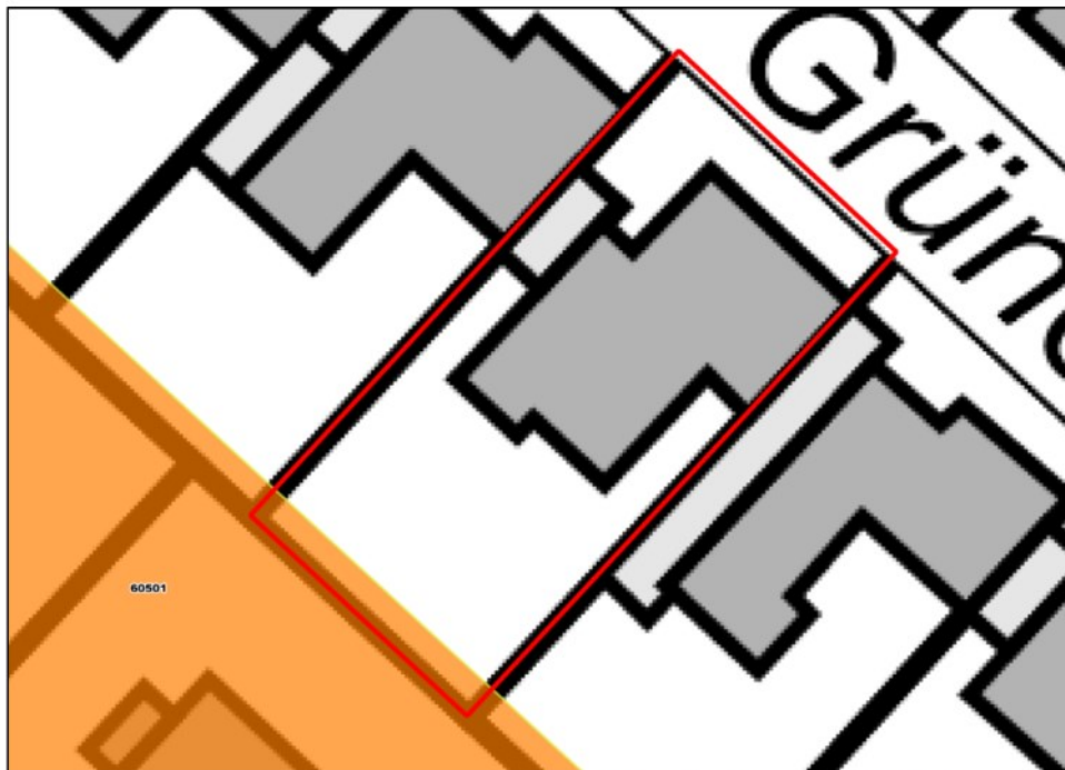
Abb. 1: Lage Flurstück 295, Flur 4 (rot umrandet) zur nachrichtlich erfassten Altablagerung 60501 (orange markiert)

Die Tatsache, dass im Anfragebereich eine Gefährdung von Schutzgütern aktuell ausgeschlossen ist, schließt jedoch nicht grundsätzlich aus, dass Schadstoffbelastungen vorgefunden werden können....“.