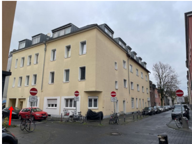
Mehrfamilienhaus Odenwaldstraße 49 / Nassaustraße 66, 68