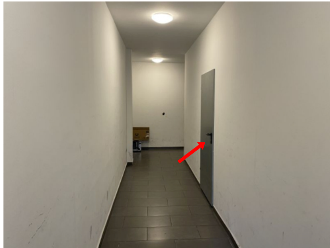
Hauseingangsflur mit Tür zum Lagerraum Nr. 17