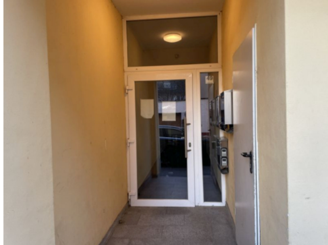
Hauseingang Odenwaldstraße 49 zum Bewertungsobjekt