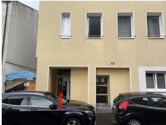
Hauseingänge Odenwaldstraße 49