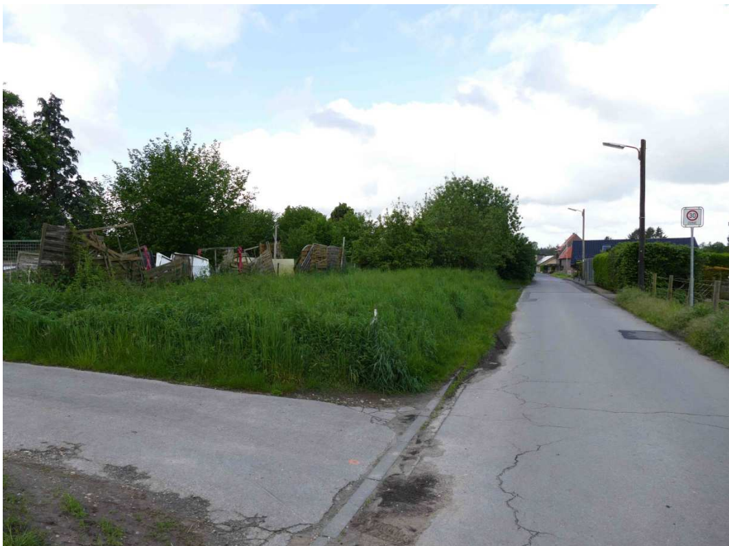
Bild 5: rückwärtiger Grundstücksteil/Wiese (Blick nach Südwesten)