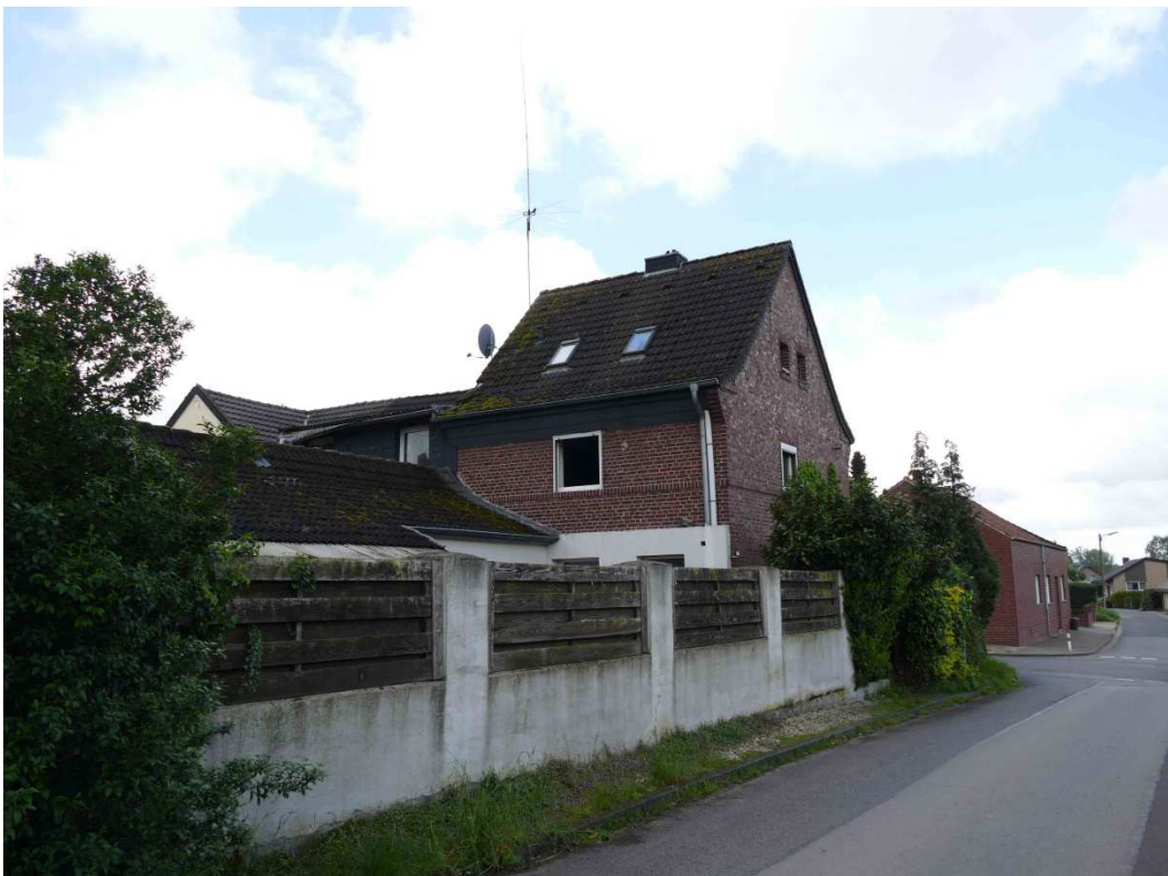
Bild 3: Profilansicht Reihenendhaus mit Anbau und Schuppen (Blick nach Südwesten)