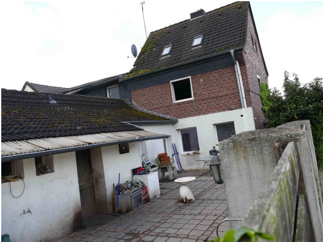
Bild 4: Rückansicht Reihenendhaus mit Anbau, Schuppen und Hof (Blick nach Südwesten)