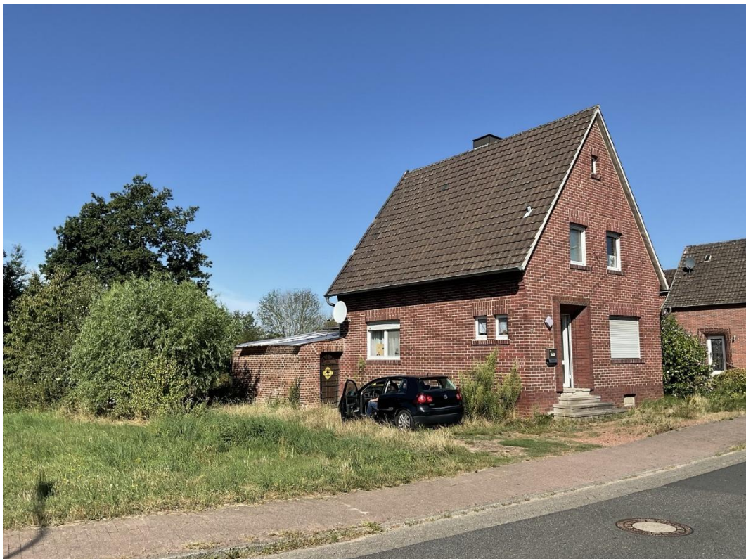
Bild 3: Profilansicht Einfamilienwohnhaus mit umbauter und überdachter Hoffläche