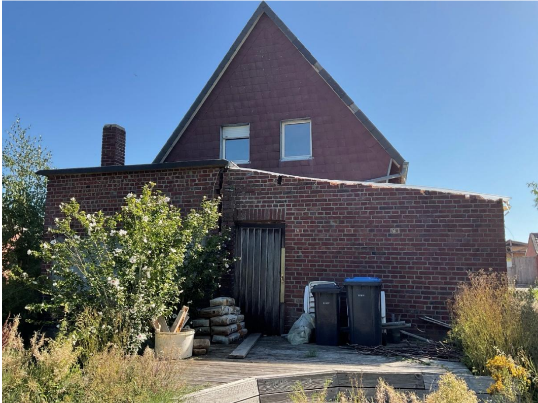
Bild 4: Rückansicht Einfamilienwohnhaus, Anbau sowie umbaute und überdachte Hofffläche