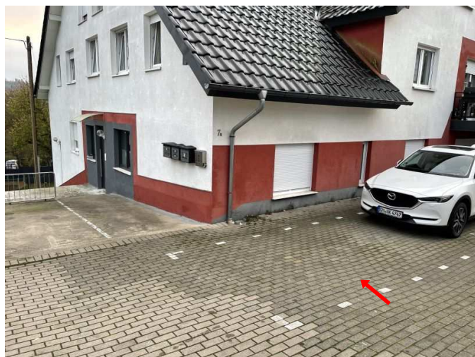
Außenstellplatz ST10 zur Wohnung Nr. 4 im Erdgeschoss links