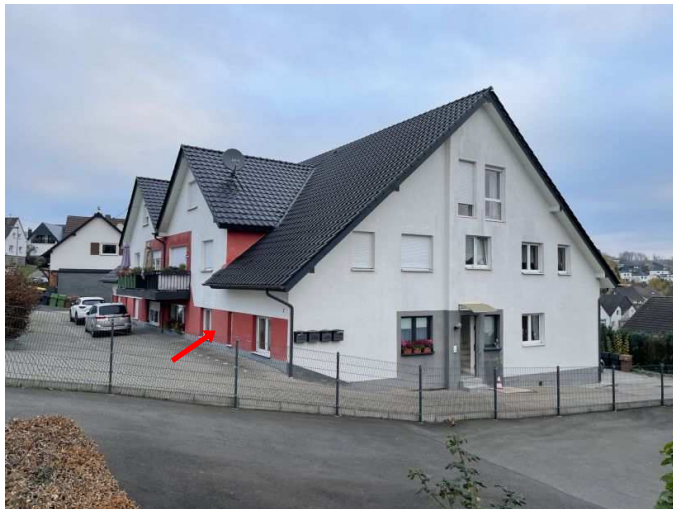
Mehrfamiliendoppelhaushälfte Südring 7 mit Wohnung Nr. 4