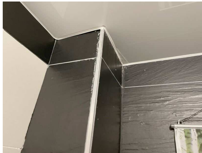
Mängel in der Wohnung Nr. 4 im Erdgeschoss links