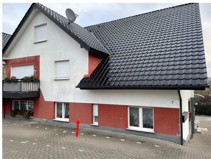
Wohnung Nr. 4 im EG links (vom Hauseingang aus gesehen)