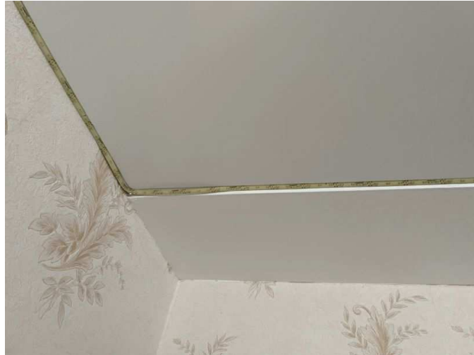
Mängel in der Wohnung Nr. 4 im Erdgeschoss links