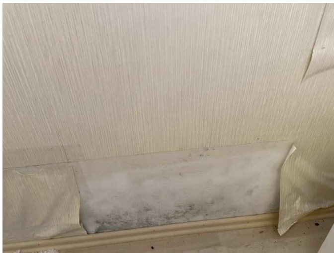
Feuchtigkeitserscheinung in der Wohnung Nr. 4