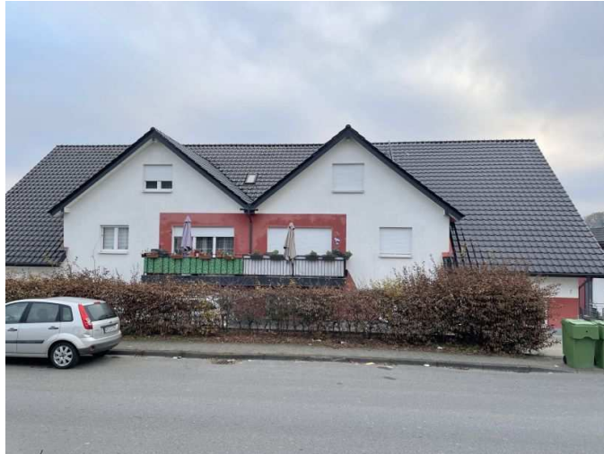
Mehrfamiliendoppelhaus Südring 7, 7a