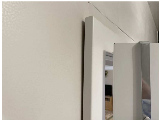
Mängel in der Wohnung Nr. 4 im Erdgeschoss links