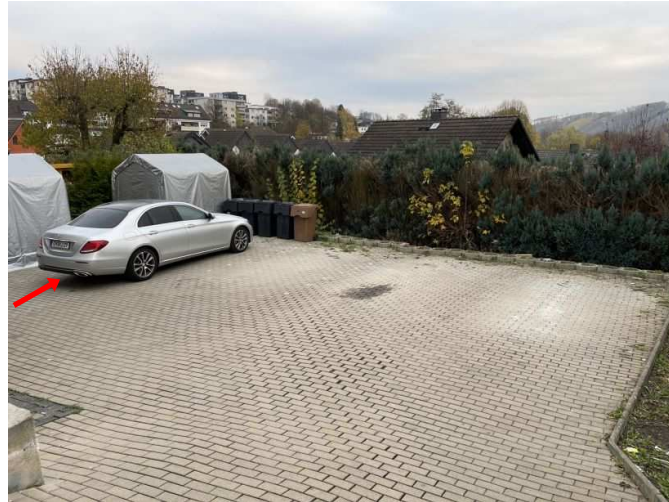
Außenstellplatz ST4 zur Wohnung Nr. 4 im Erdgeschoss links