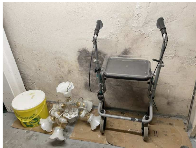
Feuchtigkeitserscheinung im Kellergeschoss