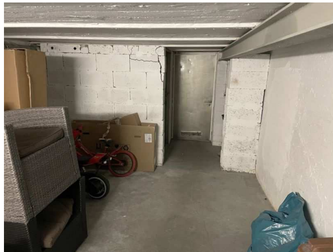
Eingezogene Stahlträger im Kellergeschoss, Schäden