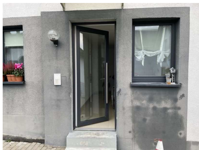
Hauseingang Südring 7