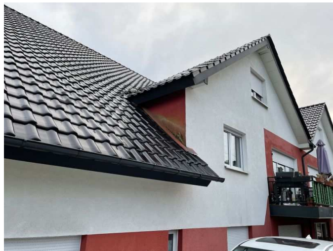
Feuchtigkeitserscheinung an einer Dachgaube