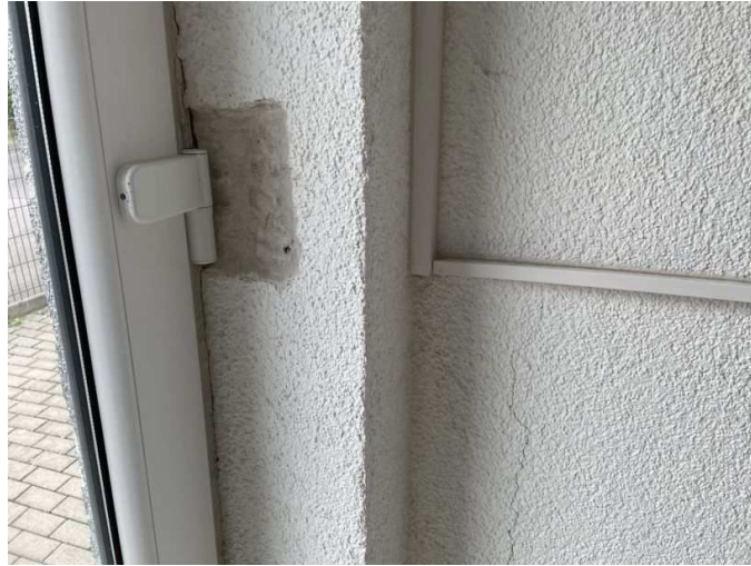
Schaden Hauseingang Südring 7