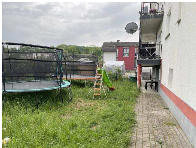
Freifläche hinter dem Wohnhaus mit Zuwegung zum KG