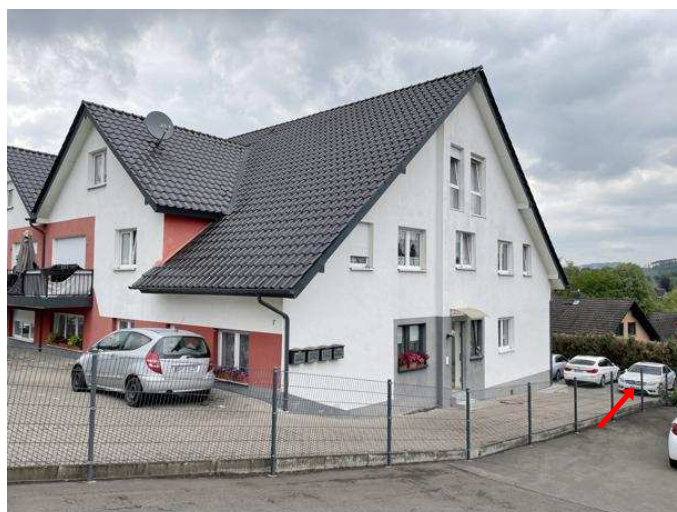
Mehrfamiliendoppelhaushälfte Südring 7 mit Stellplatz ST1