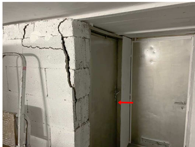
Kellerraum zur Wohnung Nr. 1 im Erdgeschoss links