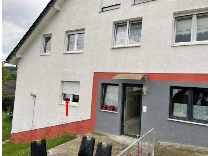
Hauseingang Südring 7a mit Wohnung Nr. 1 im EG links