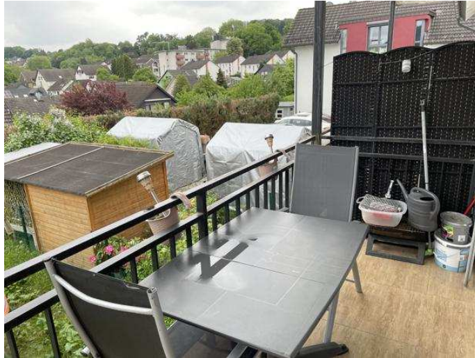
Balkon der Wohnung Nr. 1 im Erdgeschoss links