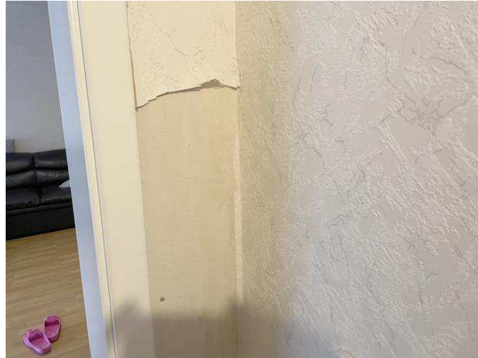
Tapetenschaden in der Wohnung Nr. 1 im Erdgeschoss links