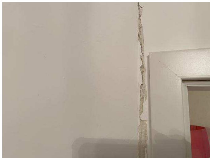
Putzschaden in der Wohnung Nr. 1 im Erdgeschoss links