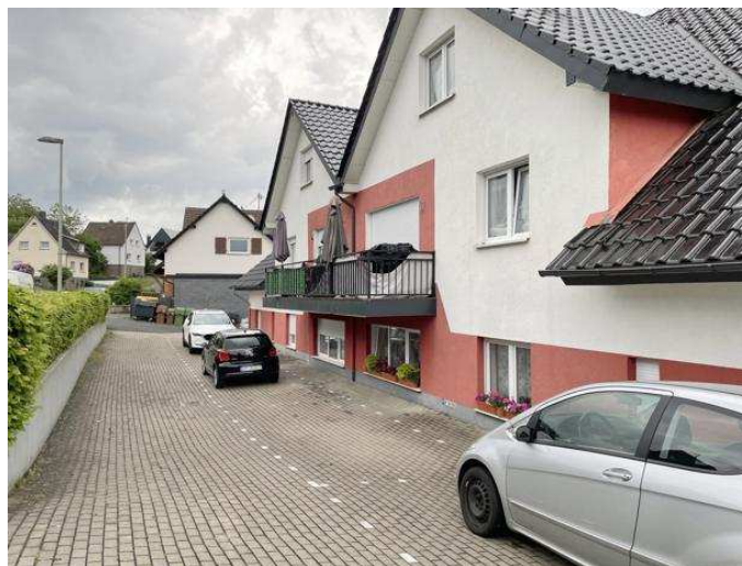
Kfz-Außenstellplätze vor dem Wohnhaus