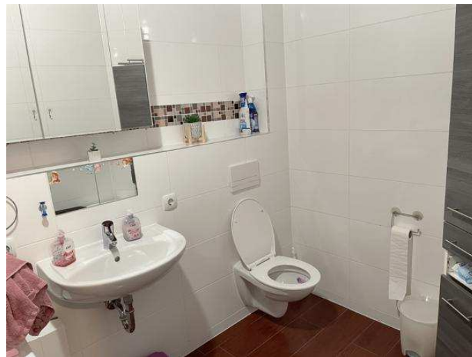
Bad der Wohnung Nr. 1 im Erdgeschoss links