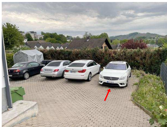
Außenstellplatz ST1 zur Wohnung Nr. 1 im Erdgeschoss links