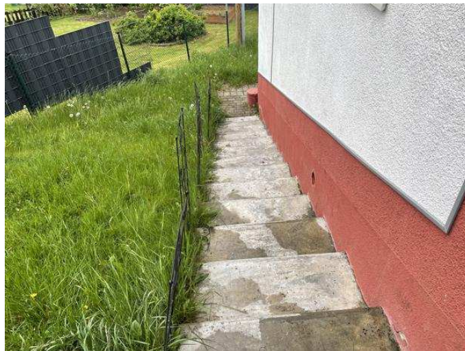
Treppe zum Kellergeschoss