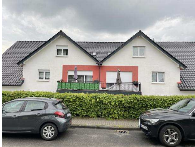
Mehrfamiliendoppelhaus Südring 7, 7a