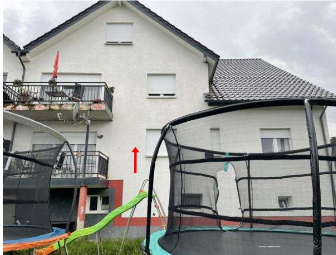
Rückwärtige Ansicht Mehrfamiliendoppelhaushälfte Südring 7a