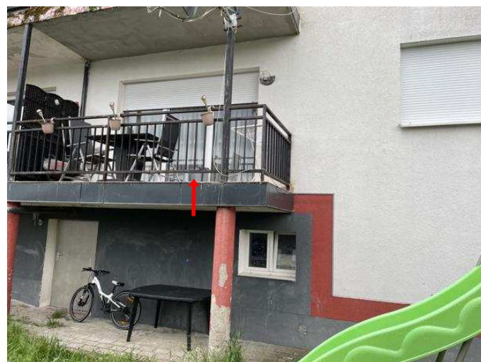
Balkon der Wohnung Nr. 1 im Erdgeschoss links