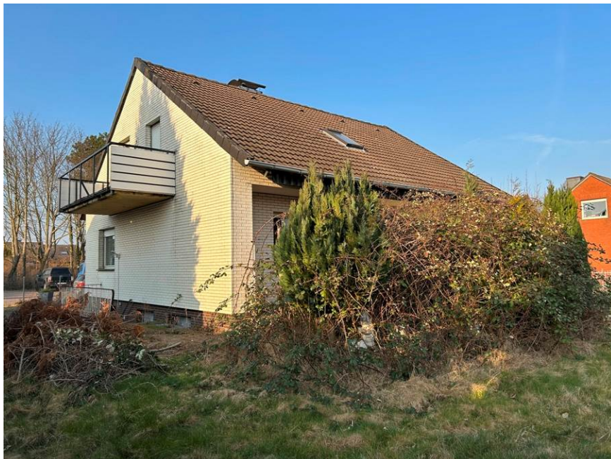
Südostansicht (Gartenansicht) des Einfamilienhauses