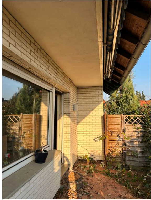
Detailansichten Balkon und Terrasse