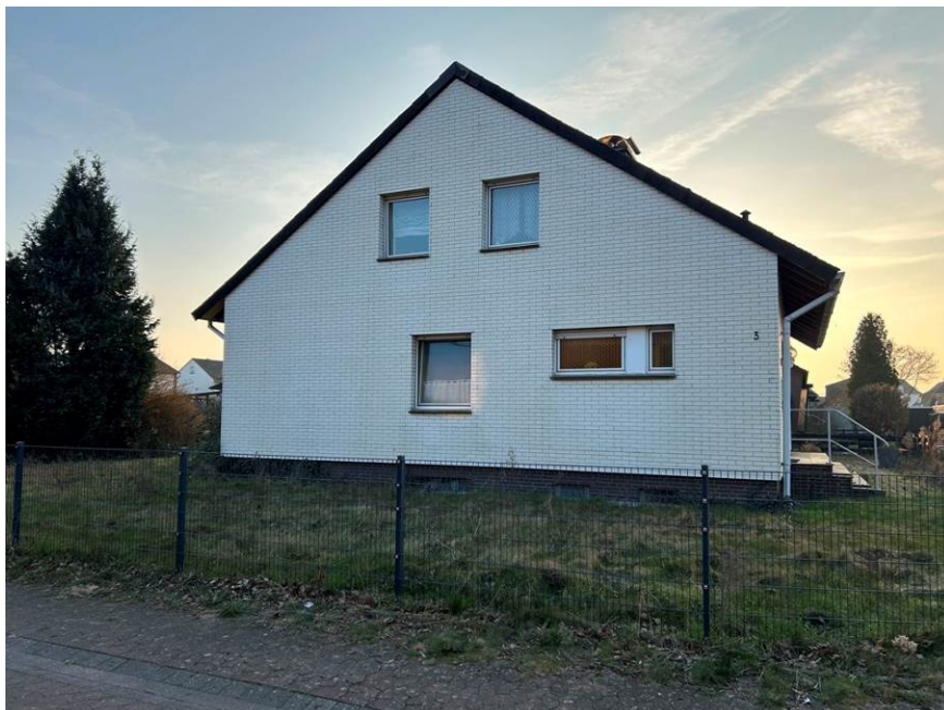
Ostansicht (Straßenansicht) des Einfamilienhauses