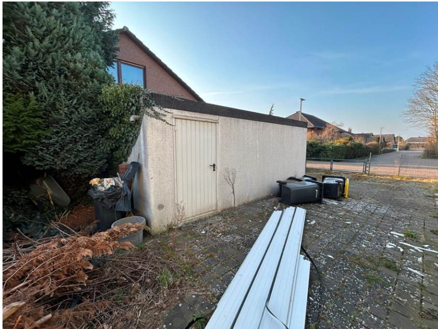
Südostansicht der Garage