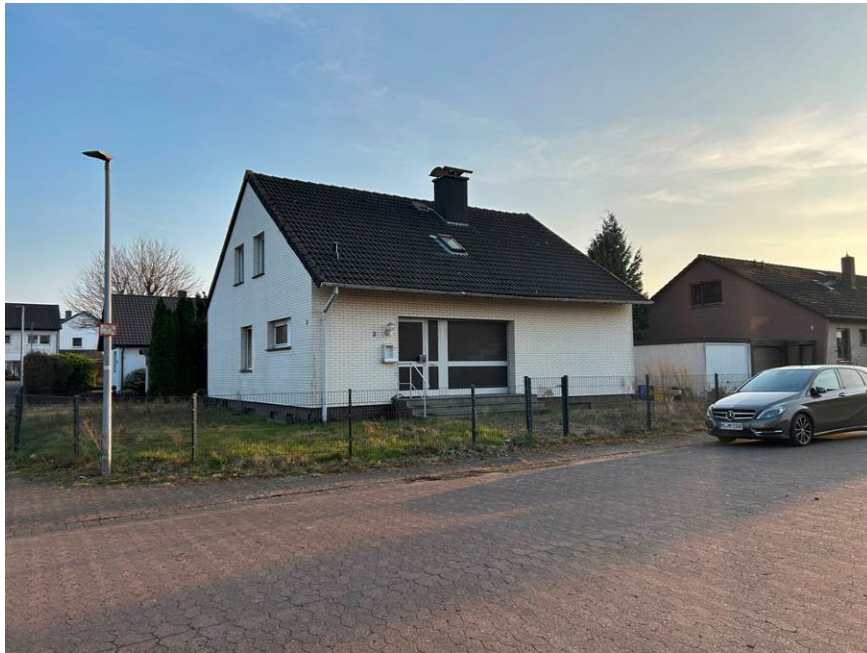
Nordansicht (Straßenansicht) des Einfamilienhauses mit Garage