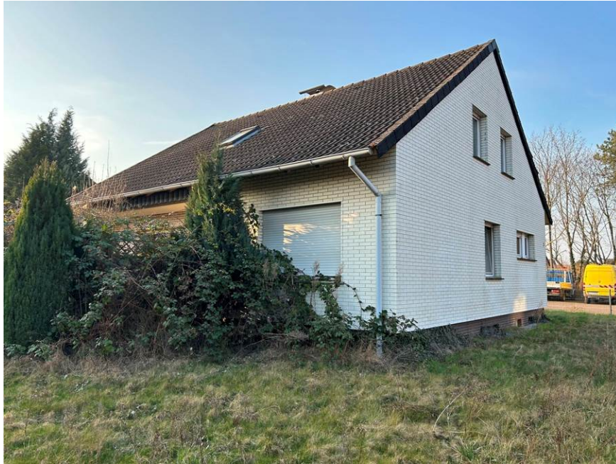
Südostansicht (Gartenansicht) des Einfamilienhauses