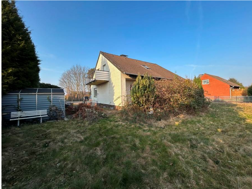
Südansicht (Gartenansicht) des Einfamilienhauses mit Gewächshaus