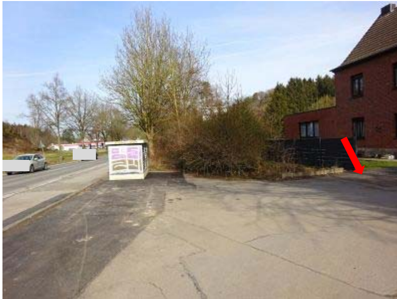
„Münsterau“ mit Zufahrtstraße zu Hausnr. 168 und Flst. 518 Straßenflucht Nord