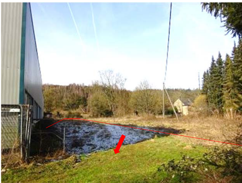
Flurstück 274 – Blick von Osten