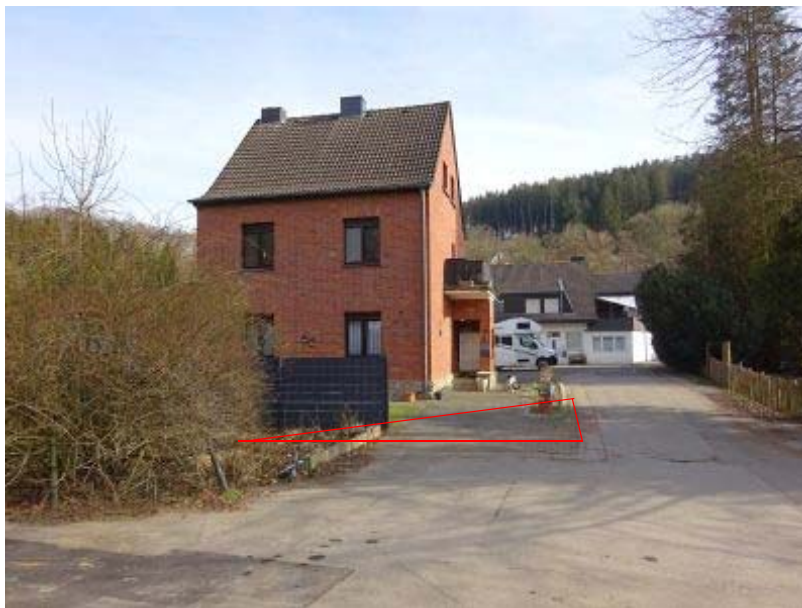
„Münsterau 168“ – Wohnhaus und Zufahrt Betriebsgelände Flst. 272 Markierung / Arrondierungsfläche – Flst. 518