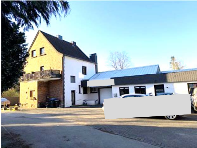
Rückansicht Wohnhaus und Zugang Hallensegment 1 (Flst. 272)