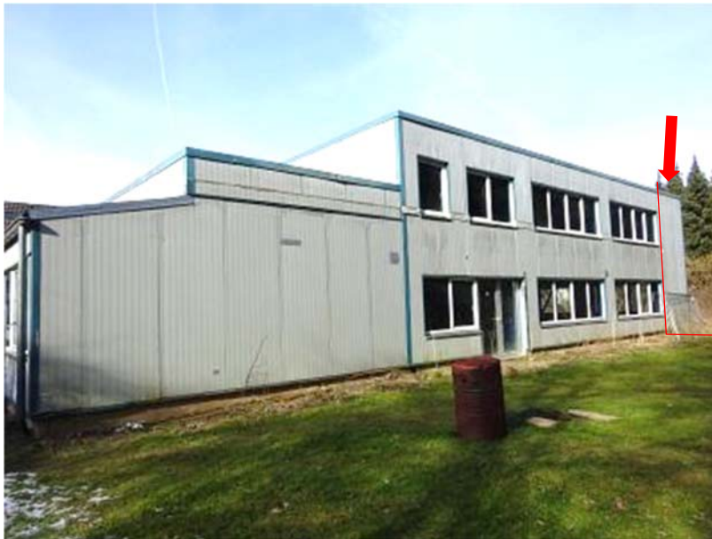
Ostfassade Halle und Anbau, geschätzte Lage - Überbau Flst. 274