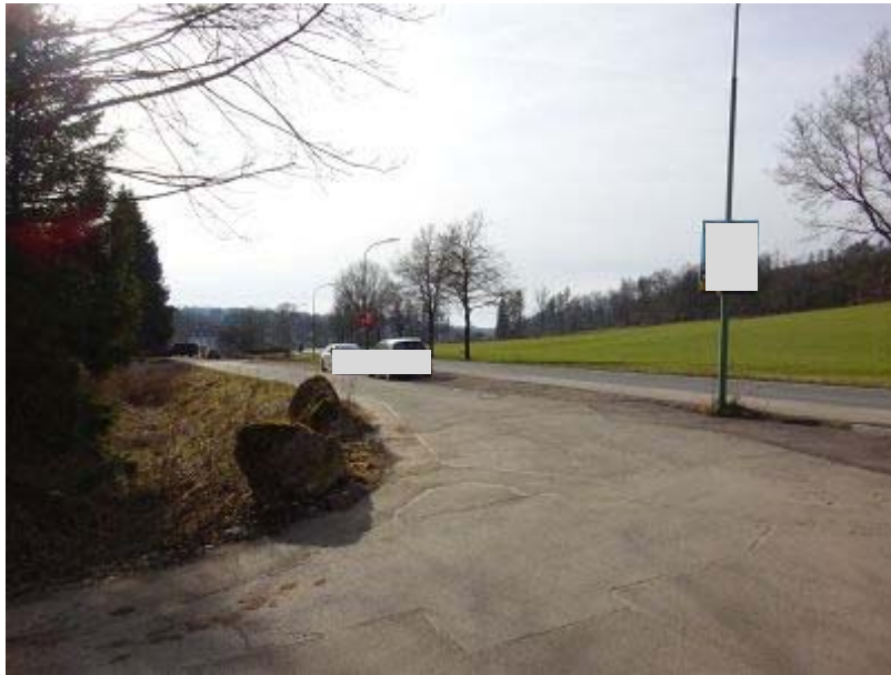
„Münsterau“ mit Zufahrtstraße zu Hausnr. 168 Straßenflucht Süd