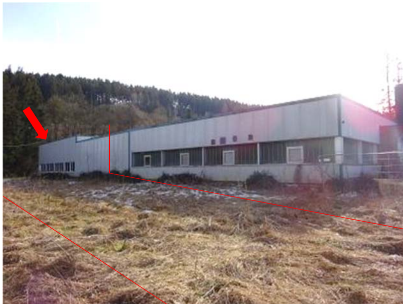
Hallengebäude Nordfassade, geschätzte Lage - Überbau Flst. 274